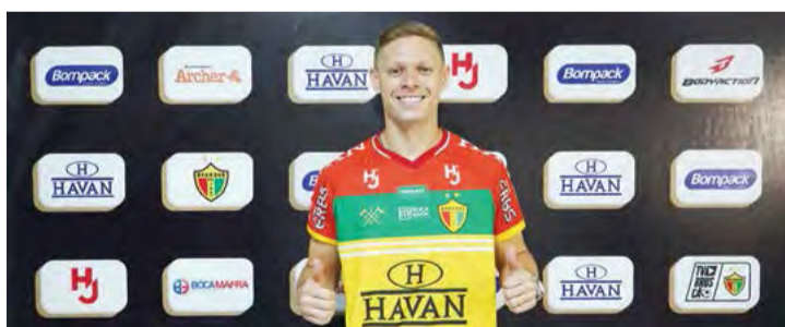
Jogador já defendeu as cores do Vasco, Fluminense, Cruzeiro, Atlético Mineiro, Sport e Corinthians

"Um jogador forte, rápido, boa estatura, finaliza bem e apesar dos 29 anos