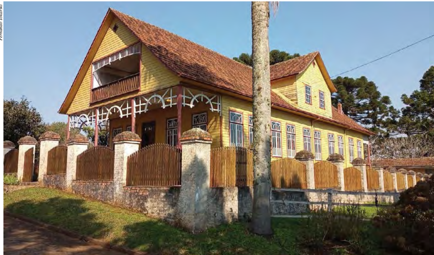
Construído entre 1926 e 1928, imponente construção em madeira permanece conservada, e preserva inúmeras relíquias em seu interior