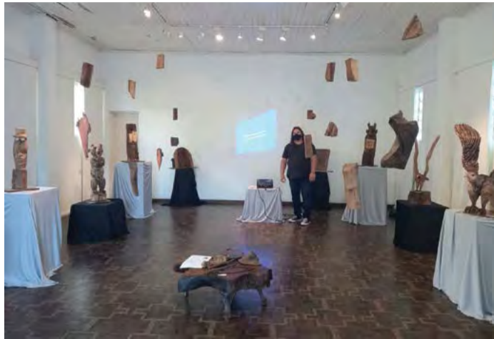
Exposição reúne inúmeras obras confeccionadas em madeira

Todas as obras expostas no MAC, segundo o artista, estão à venda. Além das esculturas, Greszeschen também realiza trabalhos