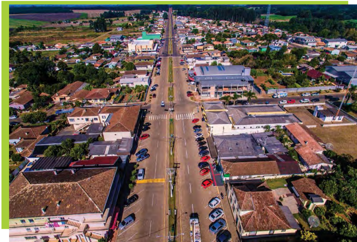
Vista geral da área central de Irineópolis