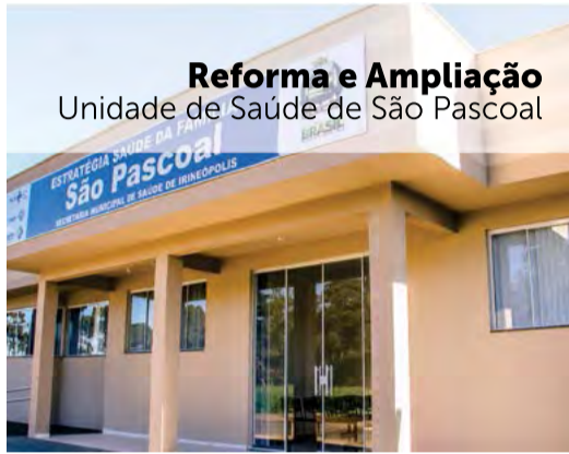
Reforma e Ampliação Unidade de Saúde de São Pascoal