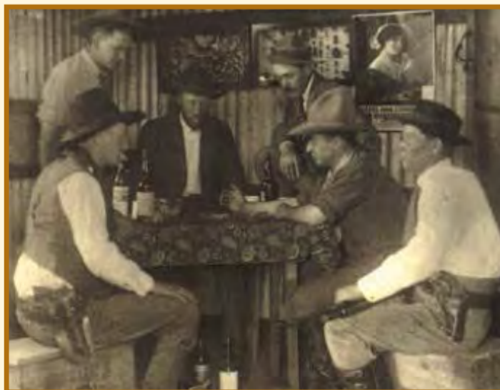
Nas mediações da Lumber funcionava um casino, onde diretores, trabalhadores e seguranças se reuniam para jogar pôquer e outros jogos. Essa foto, de 1912, foi tirada no interior do casino, e analisando a textura das paredes internas, é provável que a foto tenha sido tirada neste local, ao lado de onde funcionava o bar do casino. Atualmente a construção é utilizada como refeitório.