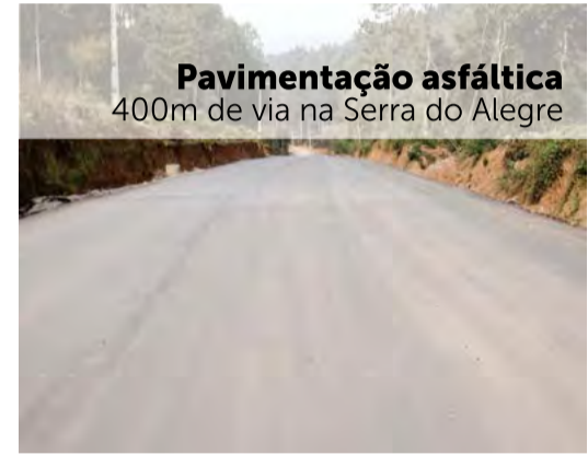
Pavimentação asfáltica 400m de via na Serra do Alegre

Essas são algumas das obras realizadas na cidade e no interior e que devem contribuir ainda mais com a qualidade de vida da população. É dessa forma, com investimentos em diversas áreas, que celebramos os 59 anos de Irineópolis, uma terra acolhedora, repleta de belezas e que tem no trabalho a sua principal marca.