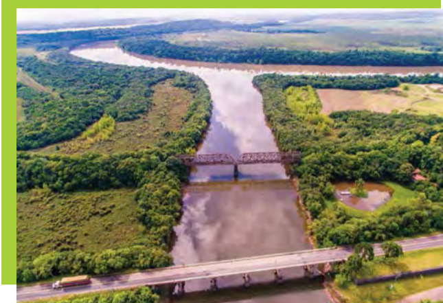
Rio Iguazu e Rio Timbó, belezas naturais irineopolitenses