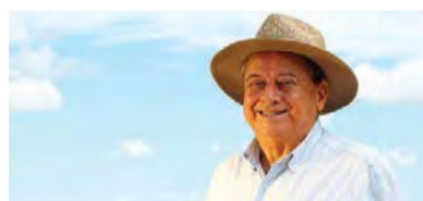
Indicado ao Prêmio Nobel da Paz, Alysso Paolinelli será um dos homenageados

O 20º Congresso Brasileiro do Agronegócio reunirá milhares de profissionais para debater o tema central Nosso Carbono é Verde. Em três painéis: Energia Limpa e Sustentável, Brasil Verde e Competitivo, e O Futuro do Agro no Comércio Mundial, os participantes terão a oportunidade de assistir às avaliações de especialistas, colaborando para ampliar o entendimento e a compreensão de cada temática.