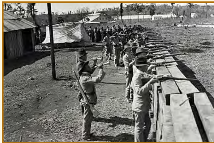
Essa foto, também do período da Guerra, é uma das mais conhecidas e mais utilizadas para ilustrar o período. Nela, uma trincheira de segurança armados protege as entradas da Lumber. Com poucos pontos de referência, foi difícil encontrar o posicionamento exato, tendo como base, ruínas de um barracão que não existe mais, e a ponta do telhado de um barracão que aparece ao fundo, no lado direito da foto. Analisando o posicionamento da trincheira, foi constatado que ela era posicionada em local central, em uma lomba no terreno, que permitia uma visibilidade total dos acessos da Lumber, para ver quem estava chegando e prevenir possíveis ataques. Atualmente, com novas construções e árvores, a visibilidade não é mais a mesma.