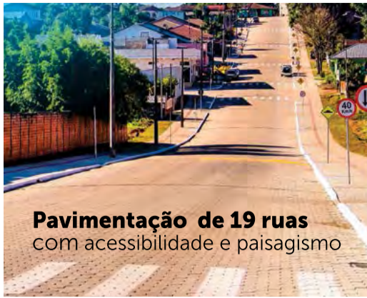
Pavimentação de 19 ruas com acessibilidade e paisagismo