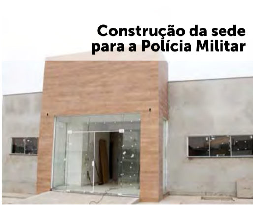
Construção da sede para a Polícia Militar