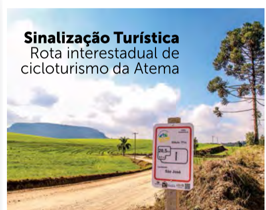
Sinalização Turística Rota interestadual de ciclismo da Atema