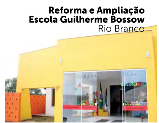
Reforma e Ampliação Escola Guilherme Bossow Rio Branco