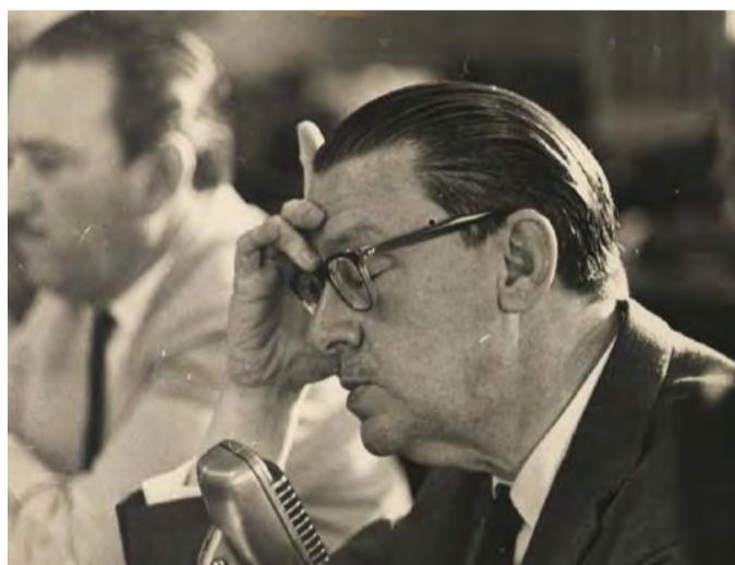
ÁLVARO VIEIRA PINTO

Álvaro Vieira Pinto foi um intelectual e filósofo brasileiro nascido em 1909, no município de Campos/RJ, falecido no ano de 1987. Autor de vasta obra filosófica, porém pouco conhecida e estudada no Brasil. Suas ideias influenciaram o debate educacional em meados do século XX, inclusive no pensamento de Paulo Freire (1921-1997). Em 1932, Álvaro Vieira Pinto se formou em medicina, pela Faculdade Nacional de Medicina do Rio de Janeiro. Importante ressaltar a diversidade de estudos desenvolvidos, bem como áreas profissionais em que atuou o filósofo no início de sua carreira. Por breve período exerceu a medicina e dedicou-se a pesquisas de laboratório. Graduou-se em física e matemática na Universidade do Distrito Federal (UDF), onde lecionou uma disciplina inédita denominada lógica matemática. Também lecionou lógica na Faculdade Nacional de Filosofia (FNFi). Nos primeiros anos da década de 1940, colaborou com a Revista Científica "Cultura Política", que mobilizava, naquele contexto, importantes intelectuais vinculados ao Estado Novo. Ao longo do ano de 1949 desenvolveu estudos na Sorbonne, em Paris, França. Retornando ao Brasil dedicou-se exclusivamente aos estudos