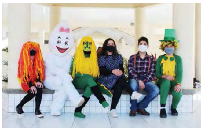
Personagens do Sítio do Picapau Amarelo foram interpretados por alunos

Com o intuito de proporcionar magia e seriedade ao assunto, a personagem Narizinho, jogava o seu pó de "pirlimpimpim"