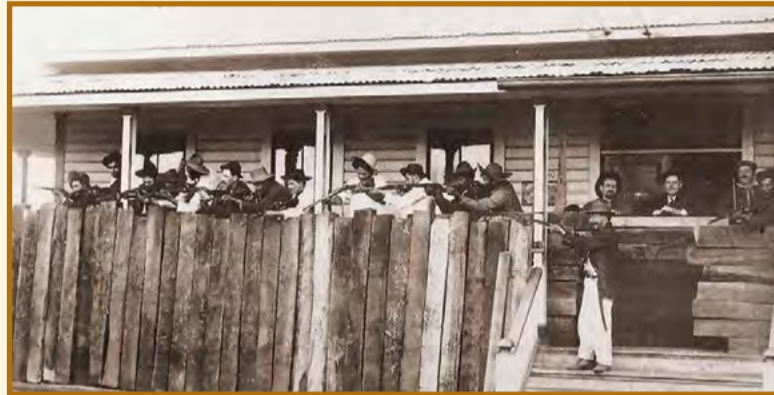
A foto, do período da Guerra mostra uma trincheira de defesa da Lumber em Três Barras, a proteção era feita com dormentes da linha férrea. O local exato da foto, é a varanda do setor administrativo da Lumber, no lado do prédio onde ficava a sala do diretor da empresa. Atualmente, esse prédio abriga a administração do Campo de Instrução Marechal Hermes, e ao longo dos anos, algumas pequenas atualizações foram feitas no prédio, como o fechamento da "bandeira" sobre a porta (lado direito), e a retirada da escada de madeira para a colocação de uma rampa em alvenaria. Entretanto, na madeira do assoalho ainda é possível ver as marcas do local onde ficava a escada. O telhado, que originalmente era de zinco, atualmente é com telhas de barro.

Muitas dessas fotografias foram tiradas nas terras onde hoje é o Campo de Instrução, e assim, surgiu a oportunidade de fotografar os locais exatos. Confira abaixo como estão atualmente três cenários onde foram feitas fotos históricas do Contestado.