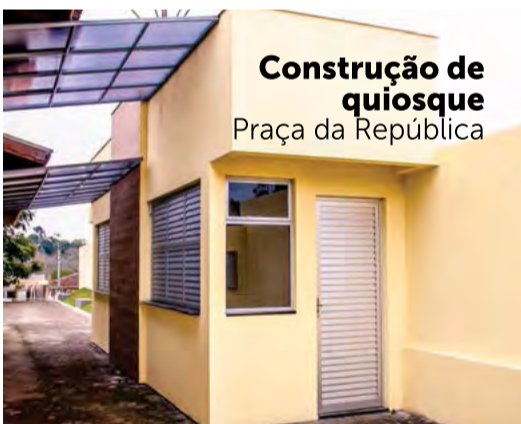
Construção de quiosque Praça da República

Essas são algumas das obras realizadas na cidade e no interior e que devem contribuir ainda mais com a qualidade de vida da população. É dessa forma, com investimentos em diversas áreas, que celebramos os 59 anos de Irineópolis, uma terra acolhedora, repleta de belezas e que tem no trabalho a sua principal marca.