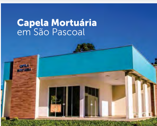
Capela Mortuária em São Pascoal