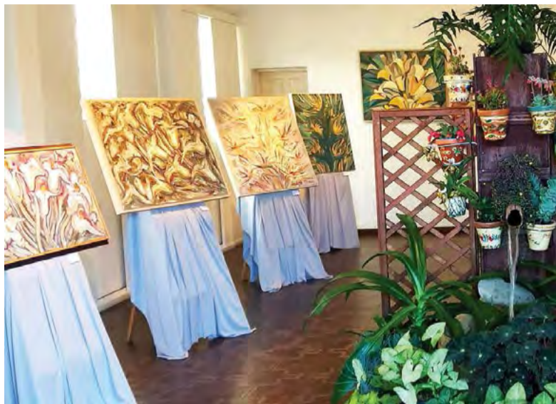
Exposição está aberta durante a semana, das 8h30 às 11h30 e das 13h30 às 16h30