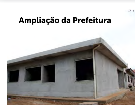
Ampliação da Prefeitura

Mais de R$12 milhões investidos em obras