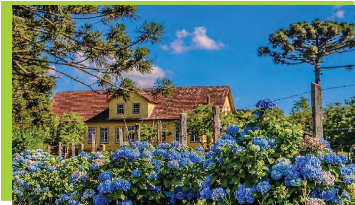
Museu Casarão Domit, um dos principais pontos turísticos do município

Reconhecida nacionalmente como a cidade com o maior desfile de tratores do Brasil, Irineópolis completa na próxima quinta-feira, 22, os 59 anos de instalação do município. Terra lavrada por muitas mãos e que tem na agricultura o carro chefe de sua economia, Irineópolis também tem sido destaque nos últimos anos pelas boas condições das estradas rurais, incentivo aos empreendedores locais, obras públicas