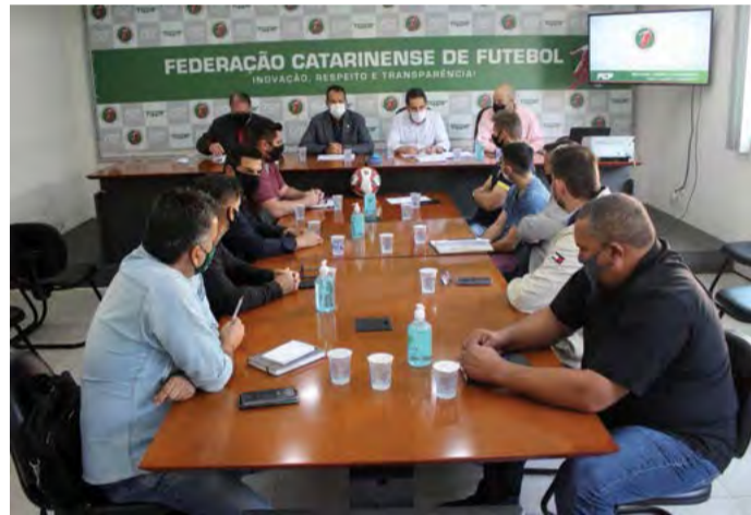
Conselho Técnico da competição foi realizado na sede da FCF