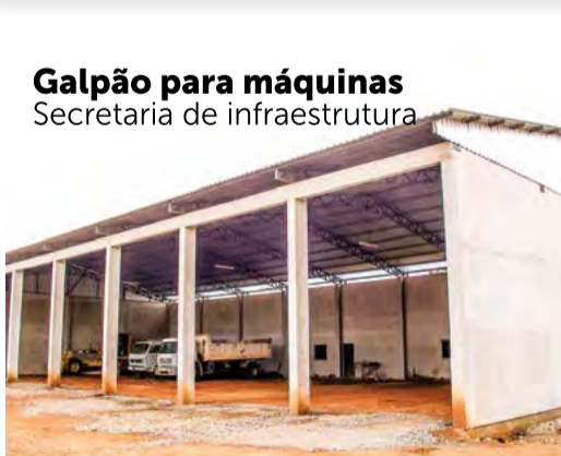
Galpão para máquinas Secretaria de infraestrutura