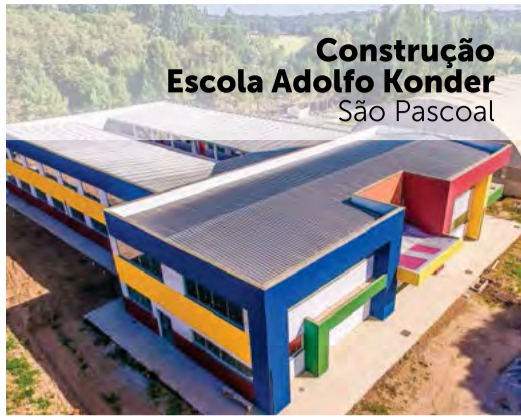
Construção Escola Adolfo Konder São Pascoal