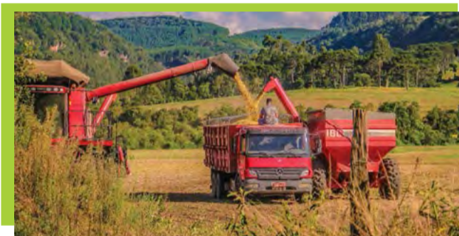
Agronegócio é a principal atividade econômica de Irineópolis