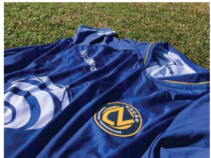
Camisa do Nação Esportes Canoinhas

A expectativa é de que em breve, as camisas estejam disponíveis para que os torcedores possam adquirir