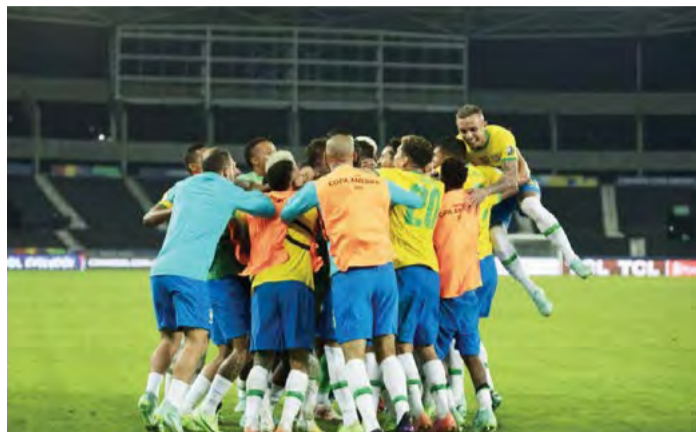
Brasil x Colômbia pela terceira rodada da Copa América 2021

"É importante, fico muito feliz de poder fazer parte dessa sequência. Acho que o segredo é preparar jogo a jogo, não pensar a