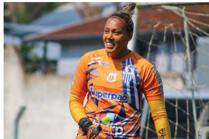
Goleira irá para a sua terceira olimpíada

O Brasil irá participar do grupo F dos Jogos Olímpicos, juntamente com China, Holanda e Zâmbia. A estreia será no dia 21 de julho contra a China.