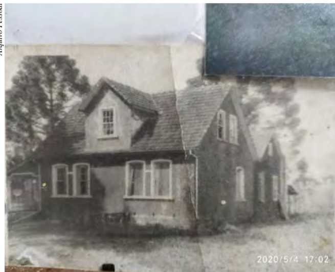
Casarão quando ainda pertencia a família Pacheco