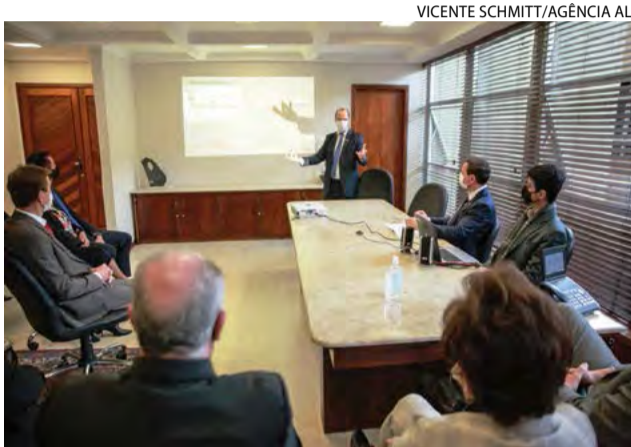
Governo apresenta dados na presidência da Alesc

Entre os números apresentados, o destaque é