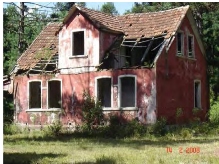
Casarão em 2008