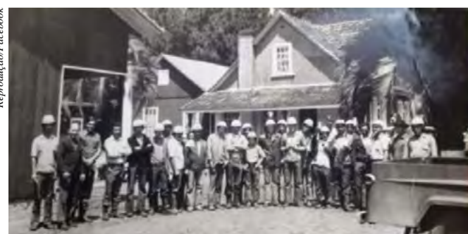
Trabalhadores em frente à casa provavelmente por volta de 1970

Acesse o QR Code para ver o vídeo gravado no local onde ficava a casa vermelha.