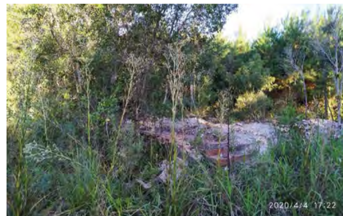
A casa no mesmo ângulo atualmente