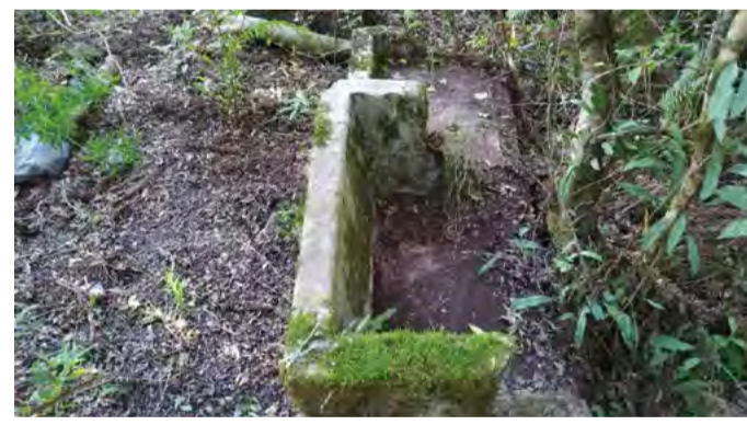
Ruínas da casa ainda existentes atualmente