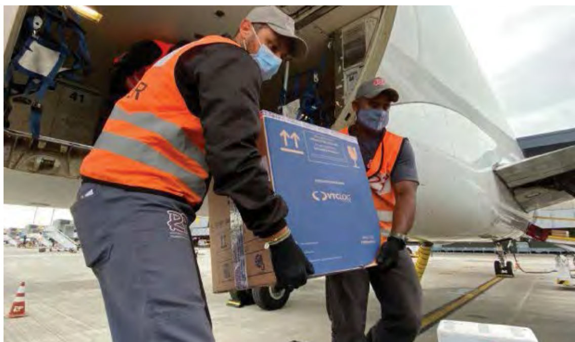
Doses chegaram ontem ao aeroporto de Florianópolis

"Queremos chegar ao final do ano com a pandemia controlada e, para isso, precisamos da colaboração de todos. É preciso ficar atento ao calendário de vacinação e seguir os protocolos sanitários já conhecidos", afirmou o secretário.