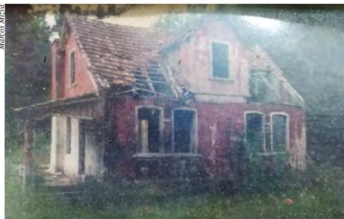
A casa ainda em pé, por outro ângulo