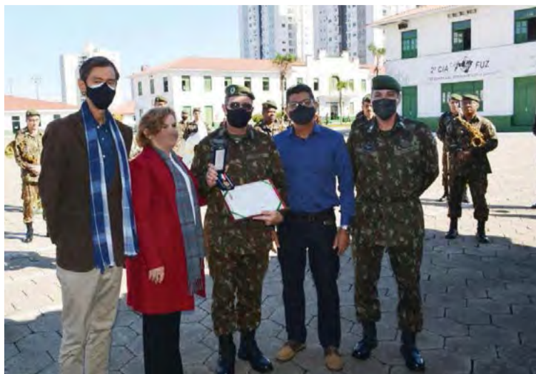
Banda recebeu a condecoração na última segunda-feira