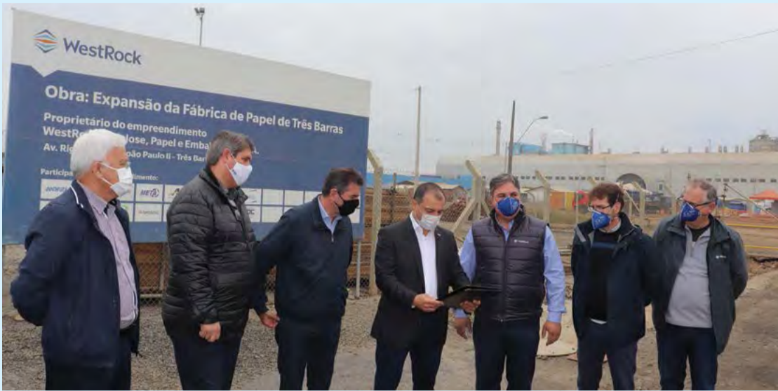
Governador durante o ato de entrega da licença ambiental

Na sexta-feira, 28, o governador Carlos Moisés (PSL) esteve no município de Três Barras, para entregar uma licença ambiental de operação para o projeto de expansão da fábrica de papel da WestRock. O investimento da empresa que começou em fevereiro de 2019, chega a US$ 345 milhões, e vai permitir expandir a produção em aproximadamente 40%. Durante seu pronunciamento, ele afirmou que a expansão do parque fabril vai gerar