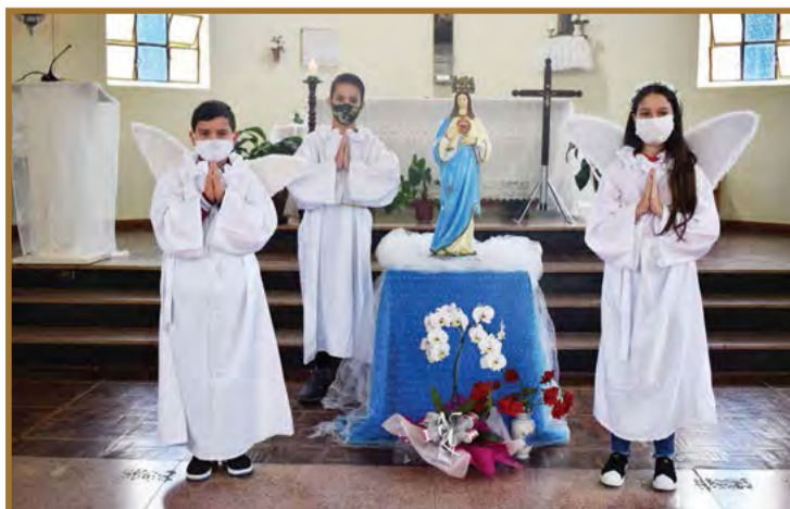
Coroação de Nossa Senhora em Marcílio Dias, em 2021