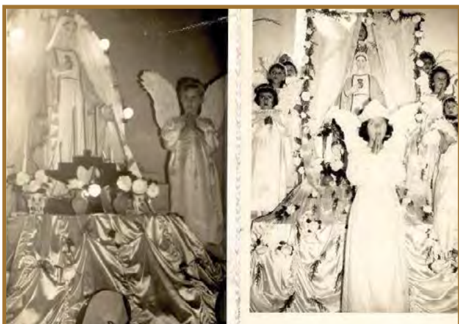
Coroação de Nossa Senhora na Igreja São Bernardo, de Marcílio Dias anos 1960