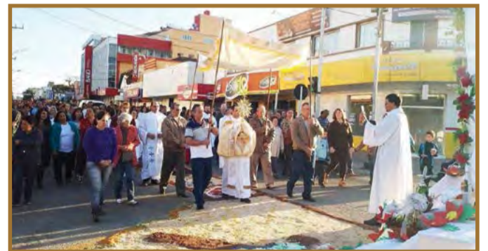
Celebração do Corpus Christi em 2017