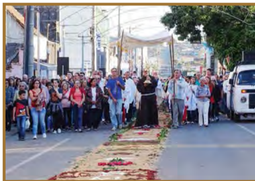
Comunidade canoinhense celebrando o Corpus Christi em 2019