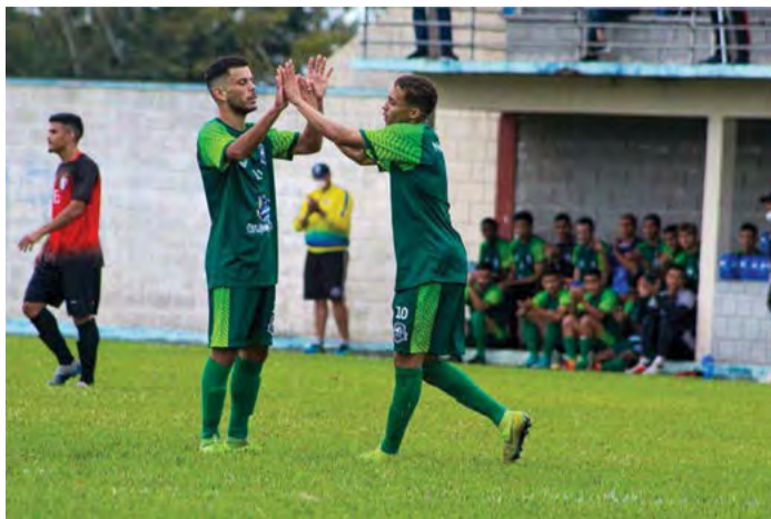
Nação segue em preparação para a Série B do Estadual