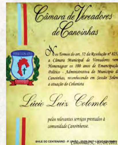
Nas comemorações do centenário de Canoinhas, a Câmara Municipal, em sessão solene realizada dia 5 de setembro de 2011, no Canoinhas Tênis Clube, homenageou Lúcio Colombo pelos relevantes serviços prestados à comunidade