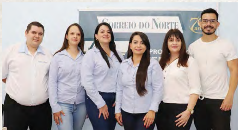
Equipe do Correio do Norte atualmente

Atualmente, o CN abrange todos os perfis de leitores, pois está presente nas plataformas digitais e tem o jornal impresso circulando em diversas cidades do Planalto Norte, tanto nas bancas, como chegando até a casa dos assinantes. Além do portal de notícias, o CN também conta com Instagram, Facebook, YouTube, grupos de WhatsApp para compartilhamento de notícias e frequentemente está