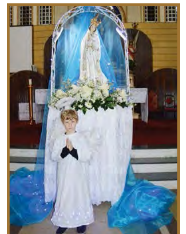
Coroação de Nossa Senhora na Igreja Matriz Cristo rei em 2018