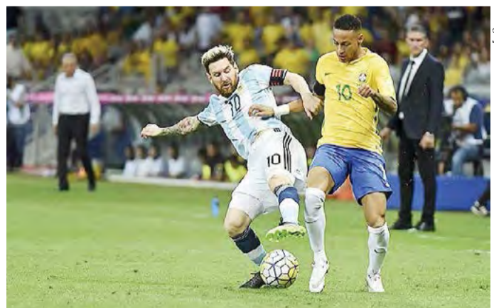
Messi e Neymar são duas das estrelas que devem estar presentes na Copa América

Em breve, as cidades sede do evento serão definidas e divulgadas.