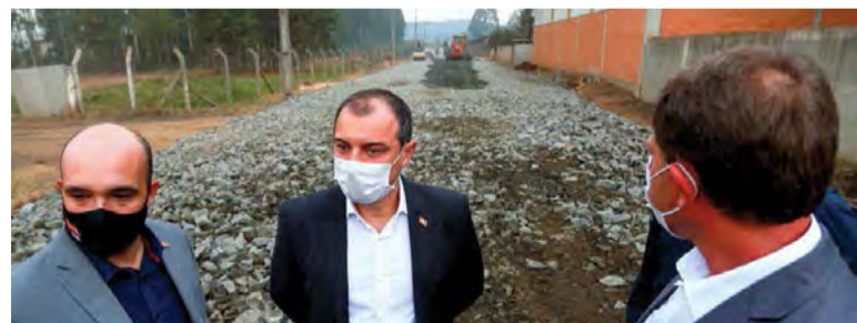
Governador Carlos Moisés (no centro da foto), visita canteiro de obras de restauração do acesso ao Bairro Industrial de Porto União

Na sexta-feira, o governador cumpriu agenda em vários municípios do Planalto Norte. Em Porto União, liberou 3 milhões de reais para a pavimentação da estrada que dá acesso ao Distrito Industrial. A obra, segundo o prefeito Eliseu Mibach (PSDB) foi prometida em 2017, ano do centenário do município, pelo então governador Raimundo Colombo, e a rodovia continua em péssimo estado de conservação até hoje.