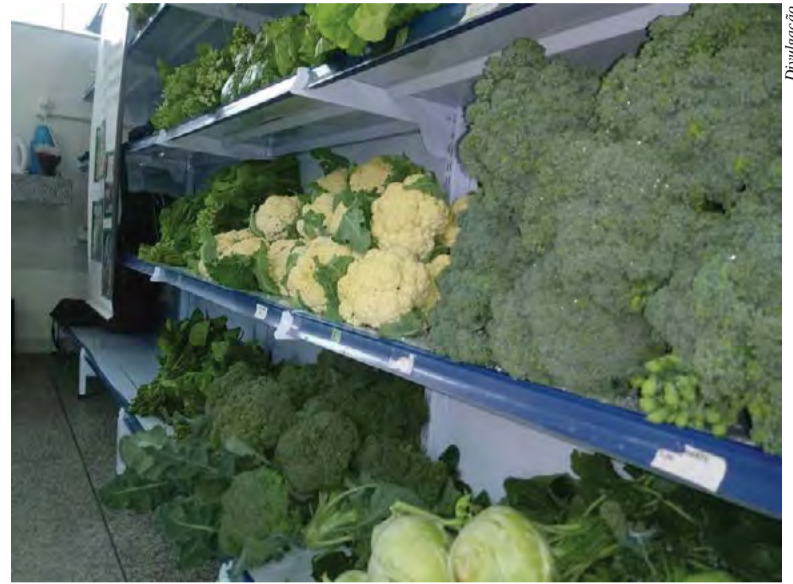
Projeto impactará no meio ambiente e na qualidade da alimentação da população

artesanais de alimentos, que são comercializados no Mercado Público Municipal de Canoinhas. Esses créditos se chamarão: "Ouro Verde" - O$.