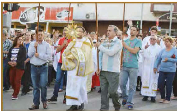
Procissão de Corpus Christi em Canoinhas, em 2018

No mês de maio, a igreja católica realiza a "Coroação de Nossa Senhora", como uma forma de homenageá-la por aceitar ser a Mãe de Jesus, pois foi Ela que permitiu chegar à humanidade, a salvação de Deus.