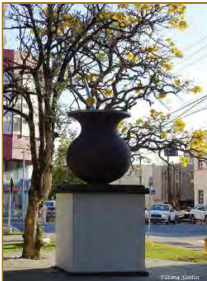
Monumento da Cuia na Praça Lauro Muller, no centro de Canoinhas.

Neste sábado, 24 de abril, será comemorado o Dia do Chimarrão. Para celebrar a data e o costume dos canoinhenses de consumir a bebida, trouxe algumas fotos que representam a relação do município de Canoinhas com a tradição do chimarrão, que passa de geração em geração.