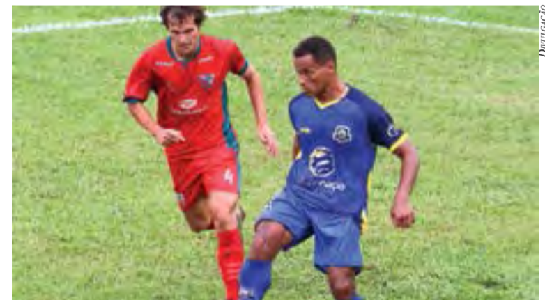
Estreia do Nação na Série B será diante do Atlético Catarinense, no estádio Orlando Scarpelli, em Florianópolis