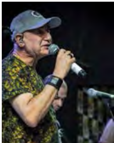
Cantor construiu a carreira na Banda Os Atuais, onde permanece até hoje

Oito". Depois, assumiu os vocais da Banda Terceira Dimensão, onde gravou as canções "Casar não é comigo", "Maria Tchá Tchá Tchá" e "Vou pra Santa Catarina", entre outras.