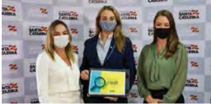
Evento reuniu a governadora e algumas secretárias do seu Governo

Aconteceu na última terça-feira, 20, o lançamento do Referencial de Prevenção à Fraude e Desvios nas Contratações Públicas. O evento reuniu a governadora Daniela Reinehr, a Secretária Executiva de Integridade e Governança (SIG) e a Secretária de Estado de Administração (SEA), que elaboraram o documento com a participação da Diretoria de Gestão de Licitações e Contratos (DGLC). Um dos objetivos do referencial é trazer mais segurança jurídica aos agentes públicos responsáveis pelas áreas de compras e contratações. Para a governadora, a estruturação de meios para prevenção de fraudes e estratégias de combate à corrupção dentro da atuação do governo é uma forma mais eficiente de entregar serviços ao cidadão. "Esse referencial é uma orientação para incentivar os servidores a manterem e melhorarem a excelência dos serviços prestados ao