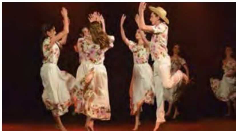
Mostra 20 anos mostrou apresentações que ocorreram ao longo dos anos