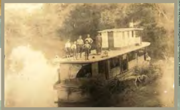
Acervo de Guerra Loeffler Digitalização: Fátima Santos