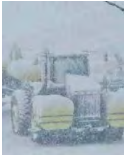
Condição climática ameaça plantio da safra 2021 nos EUA.

A previsão é que o frio se estenda até o final do mês de abril nos EUA, até lá é provável que as cotações tanto da soja quanto do milho ganhem força na Bolsa de Chicago, se o Dólar permanecer valorizado frente ao Real, a expectativa é que os produtores rurais tenham condições ainda melhores para comercializar a sua safra.