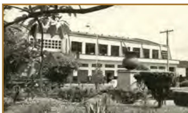
Foto antiga que mostra o monumento da Cuia na Praça Lauro Muller e a SBO.