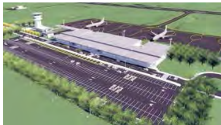
Foto da maquete do novo aeroporto que será construído na Serra Gaúcha

- E o que mais interessa aos turistas e visitantes do Natal Luz, é que o acesso a Gramado pelo novo aeroporto deverá encurtar o trajeto em cerca de 40 minutos, em relação ao traslado desde o aeroporto de Porto Alegre. Vale lembrar que a região conta ainda com um projeto da iniciativa privada para a construção de um aeroporto em Canela.