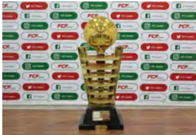
Série B 2021 contará com a participação de 10 clubes

Os dois clubes que fizerem mais pontos garantem vaga no