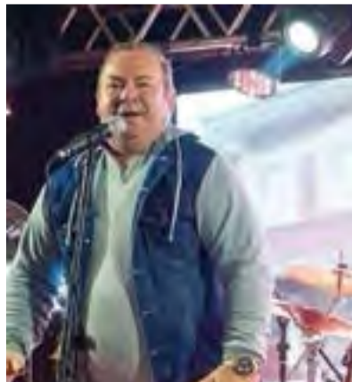
Artista liderou as bandas Corpo & Alma, Terceira Dimensão e Sangue Latino, e atualmente participa de eventos ao lado da Banda Ouro