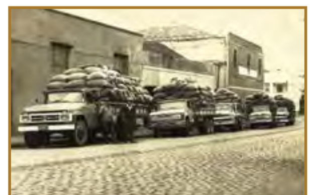
Carregamento de erva mate no município de Canoinhas no ano de 1971.