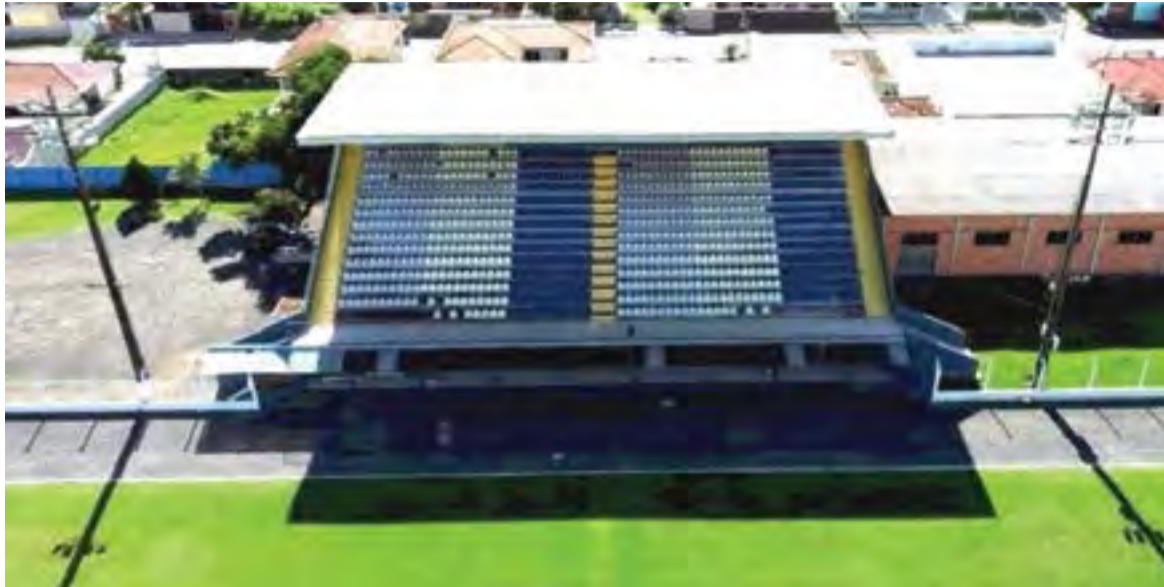
Estádio Ditão está sendo preparado para ser a nova casa do Nação

Na redes sociais, o clube se mostra entusiasmado com a mudança. "A metodologia do projeto segue sendo o mesmo, mas agora, mandará os jogos na capital mundial