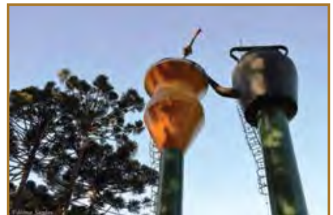
Cuia e chaleira em frente à centenária Ervateira Seleme.