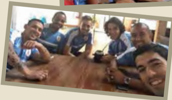
Ao redor do mundo a tradição do chimarrão também tem se popularizado, especialmente após os jogadores da seleção uruguaia de futebol levarem o chimarrão para o banco de reservas durante jogos da Copa do Mundo de Futebol.