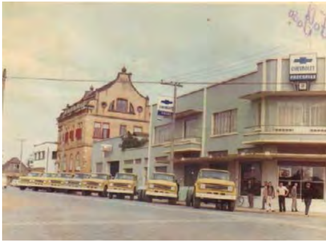
Na Rua Getúlio Vargas, em data que não sei precisar, a entrega de caminhões Chevrolet. Ao fundo, o magnífico casarão Seleme.