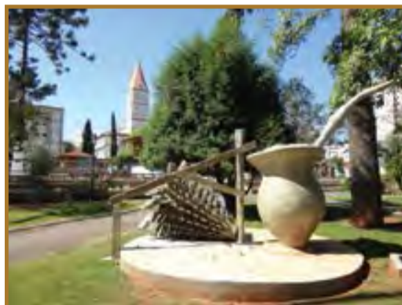
Monumento da cuia e um Barbacua na praça Osvaldo de Oliveira, em frente à igreja Matriz de Canoinhas.