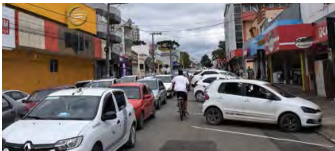
Mudanças na legislação de trânsito estavam em discussão desde 2019

Confira no quadro ao lado, as principais mudanças no Código de Trânsito Brasileiro: