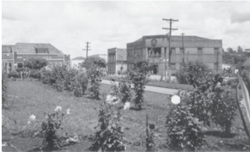
Em meados dos anos 1940, em primeiro plano parte da Praça Lauro Müller e ao fundo o prédio da Prefeitura de Canoinhas.