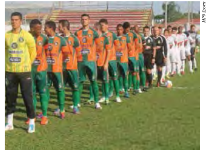
Equipe disputou a Série B do Campeonato Catarinense em 2020

Na temporada 2020, o Camboriú ficou na quinta colocação no Campeonato Catarinense da Série B.