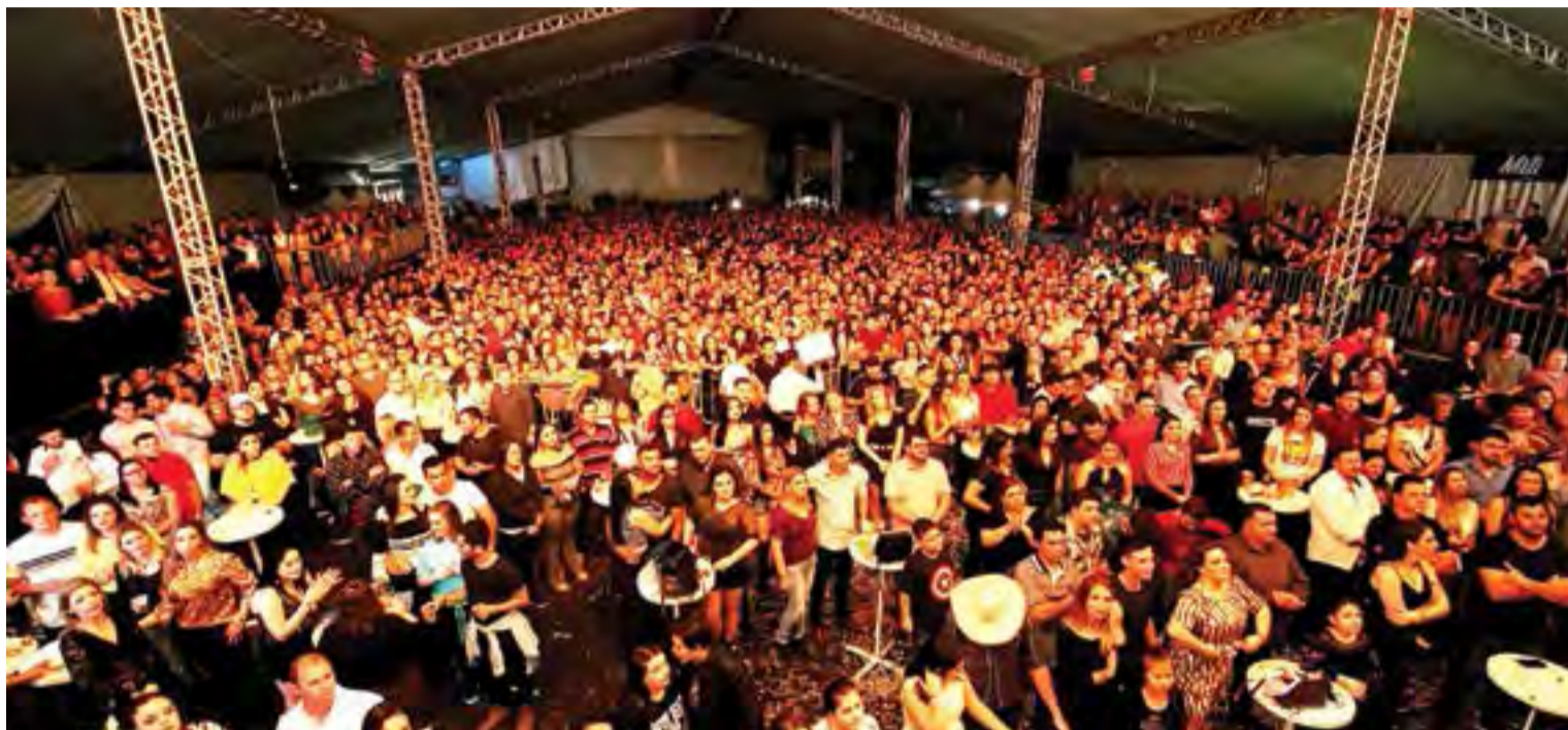
Eventos do município atraem grande público, e são oportunidades para os artistas locais mostrarem seu trabalho e ganhar dinheiro. A foto é de um show da Fesmate de 2019