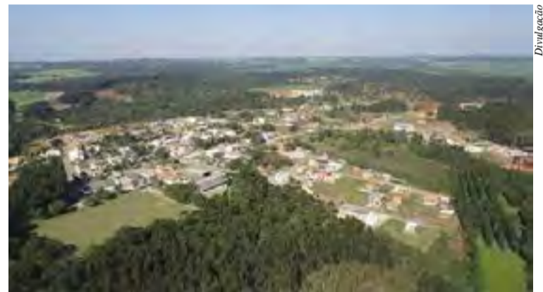
Vista aérea de Bela Vista do Toldo