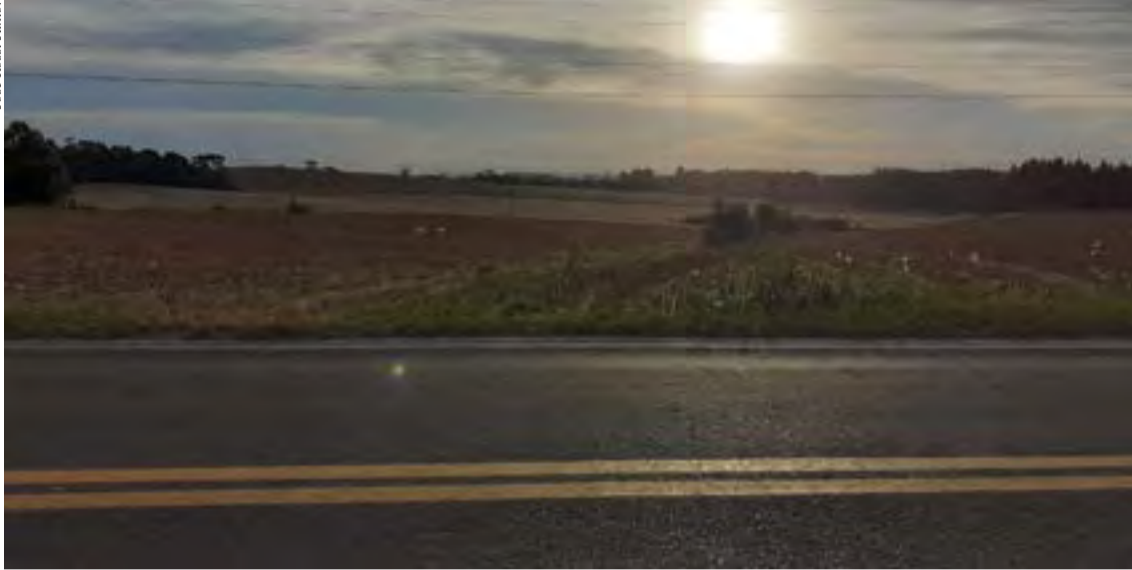
Paisagem rural de Bela Vista do Toldo, às margens da rodovia de acesso ao município

Cidade mais jovem do planalto norte se destaca pela força do agronegócio, turismo e constante desenvolvimento