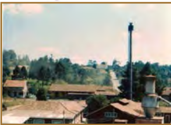
Firma Wiegando Olsen nos 70. Observem ao fundo da imagem, a igreja São Bernardo, a estação, restaurante e o trem.

A firma Wiegando Olsen foi uma manufatura de madeira criada por imigrantes europeus em 1924, no interior de Santa Catarina. Sua sede era localizada no distrito de Marcílio Dias, em Canoinhas. No início, contou com trabalhadores, grande parte descendentes e imigrantes. No auge, a empresa chegou a contar com 600 funcionários. Desta empresa, saía a madeira trabalhada com cuidado artesanal e transformada em pisos e revestimentos, que eram utilizados nos principais mercados importadores, como Portugal, Inglaterra, França, Itália, Austrália, Estados Unidos, Canadá e no Brasil.