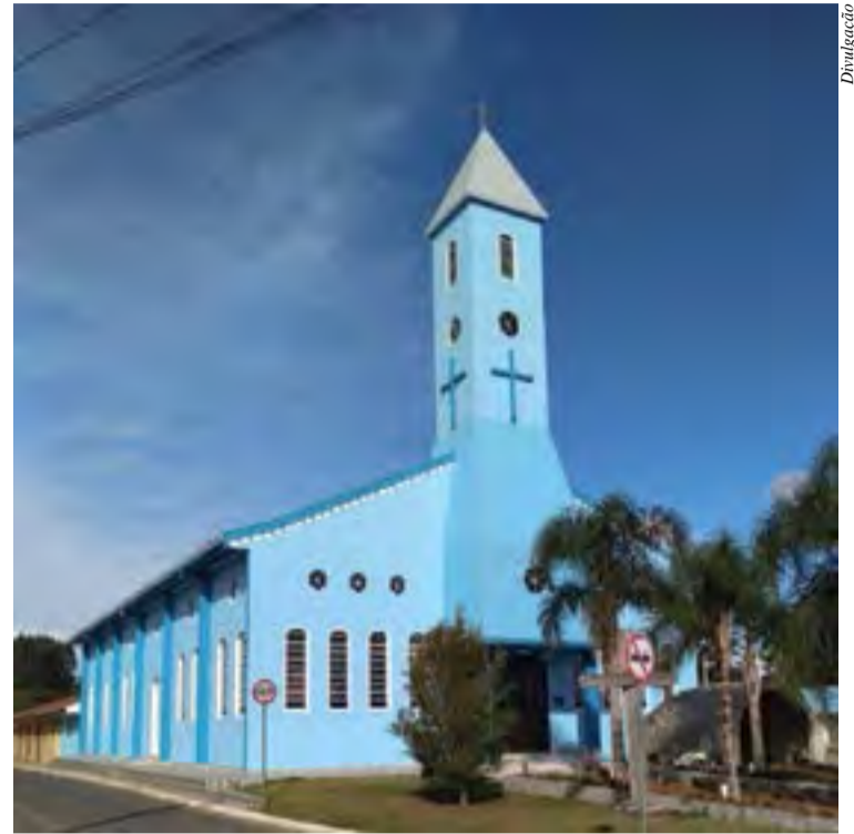
Matriz Nossa Senhora da Glória, no centro de Bela Vista do Toldo

Em síntese, Bela Vista do Toldo é um lugar tranquilo para se viver, que passa por constante desenvolvimento e crescimento. Parabéns Bela Vista do Toldo!