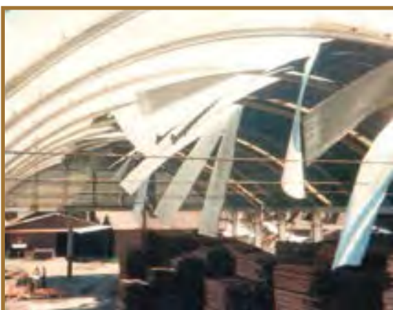
Cobertura da Firma Wiegando Olsen destruída em um vendaval.