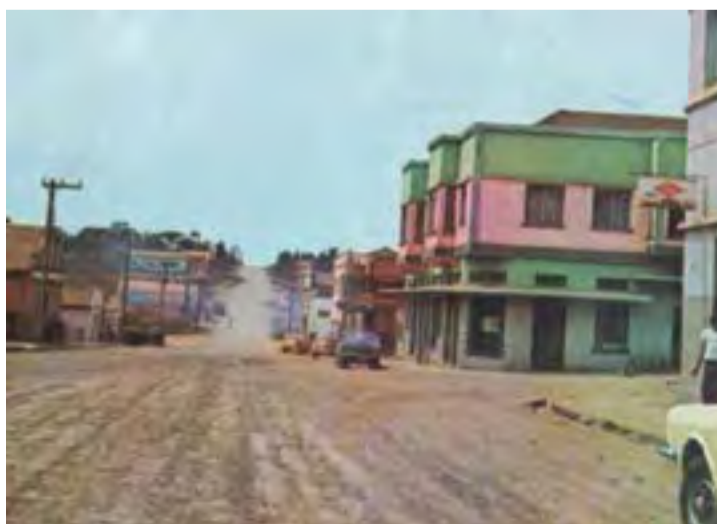
Papa João XXIII possivelmente na década de 1970