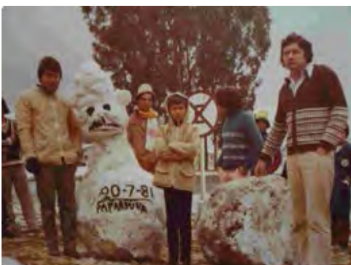
Registro de neve em Papanduva em 1981