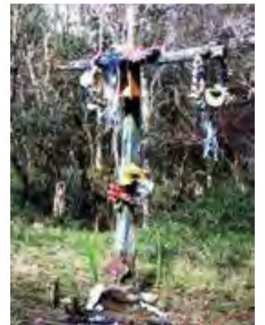
O Poço do Monge João Maria é um dos atrativos históricos, que faz referência ao período da Guerra do Contestado

O Correio do Norte deseja a todos os papanduvenses as felicitações pelos 67 anos de emancipação do município, que hoje é referência de progresso, desenvolvimento e hospitalidade. Parabéns Papanduva!