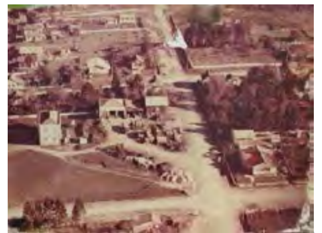
Foto antiga da vista aérea rua Simeão Alves de Almeida