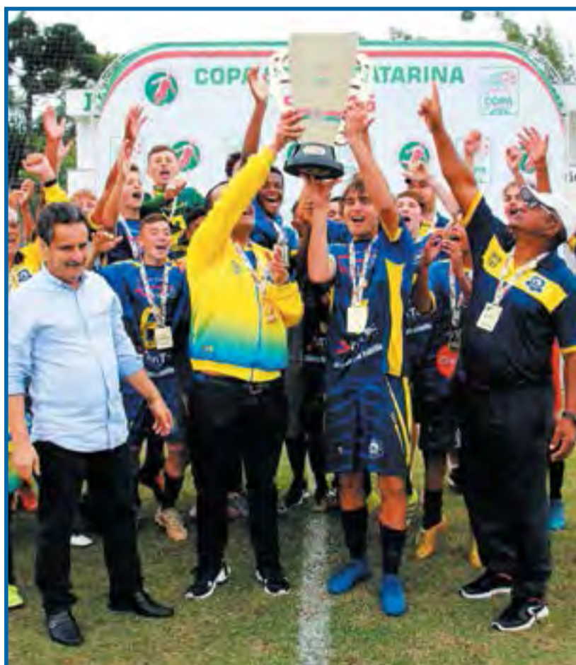
Em 2019, o Nação Esportes foi campeão da Copa Santa Catarina Sub-15

Neste ano, a equipe disputa a Série B do Estadual, que terá início no dia 20 de junho e contará com 10 clubes: Nação, Tubarão, Barra, Camboriú, Caçador, Internacional, Guarani, Fluminense, Atlético Catarinense e Carlos Renaux. E também, a Copa Santa Catarina, que reúne os principais clubes do Estado e dá vaga à Copa do