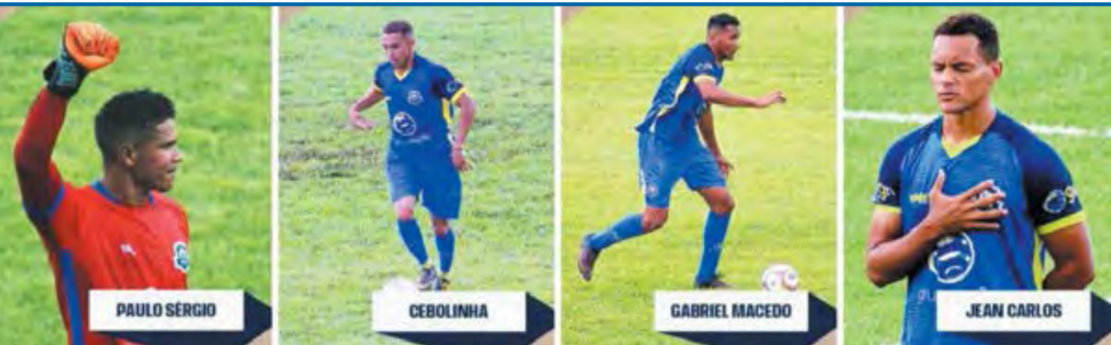
Alguns dos atletas de destaque na última temporada, já tiveram a permanência confirmada para a Série B

tar Canoinhas nas competições; Anúncio da consolidação do projeto pode acontecer nos próximos dias