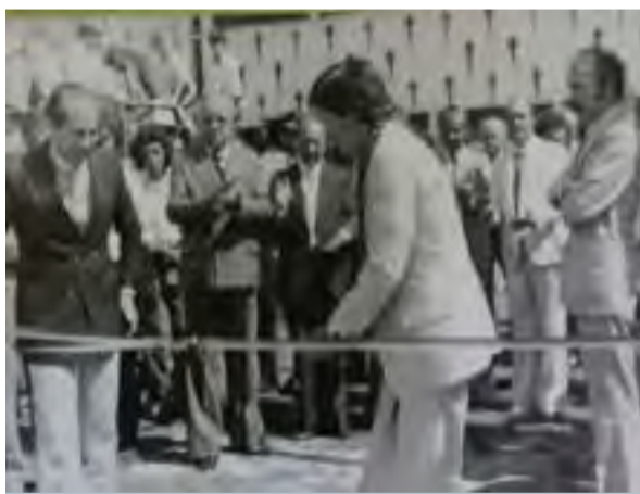
Inauguração da primeira linha telefônica em Papanduva