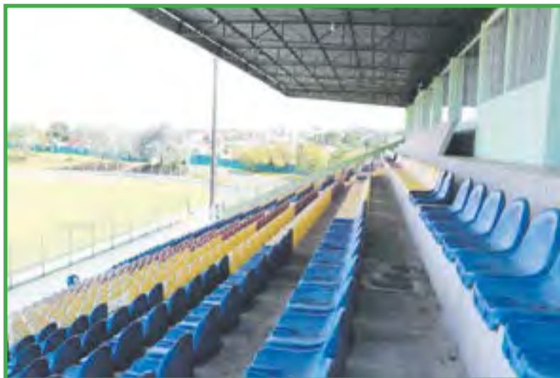
Ditão está recebendo manutenções e melhorias para receber os jogos

Com o destaque obtido na Série C do Catarinense de 2020, muitos atletas do clube passaram a ser desejados por outras equipes, entretanto, no mês de fevereiro, o Leão anunciou a renovação do contrato de alguns de seus principais jogadores, para