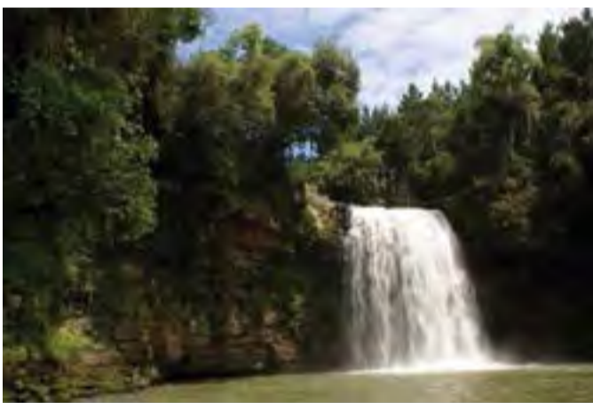
As cachoeiras são um dos grandes atrativos turísticos de Papanduva. Na foto, a cachoeira Werka, na localidade do Rio Bonito