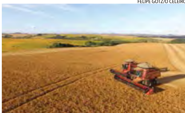
FELIPE GÓTZ/O CELEIRO

Em março, a saca de 60 kg de milho em Santa Ca-