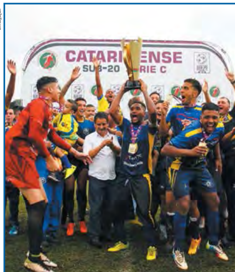
No primeiro ano de sua história, o clube conquistou um campeonato estadual na categoria sub-20