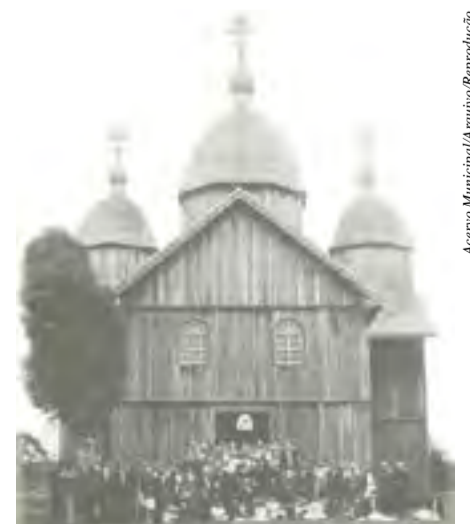
Fieis em frente a antiga Igreja de São Valdomiro Magno