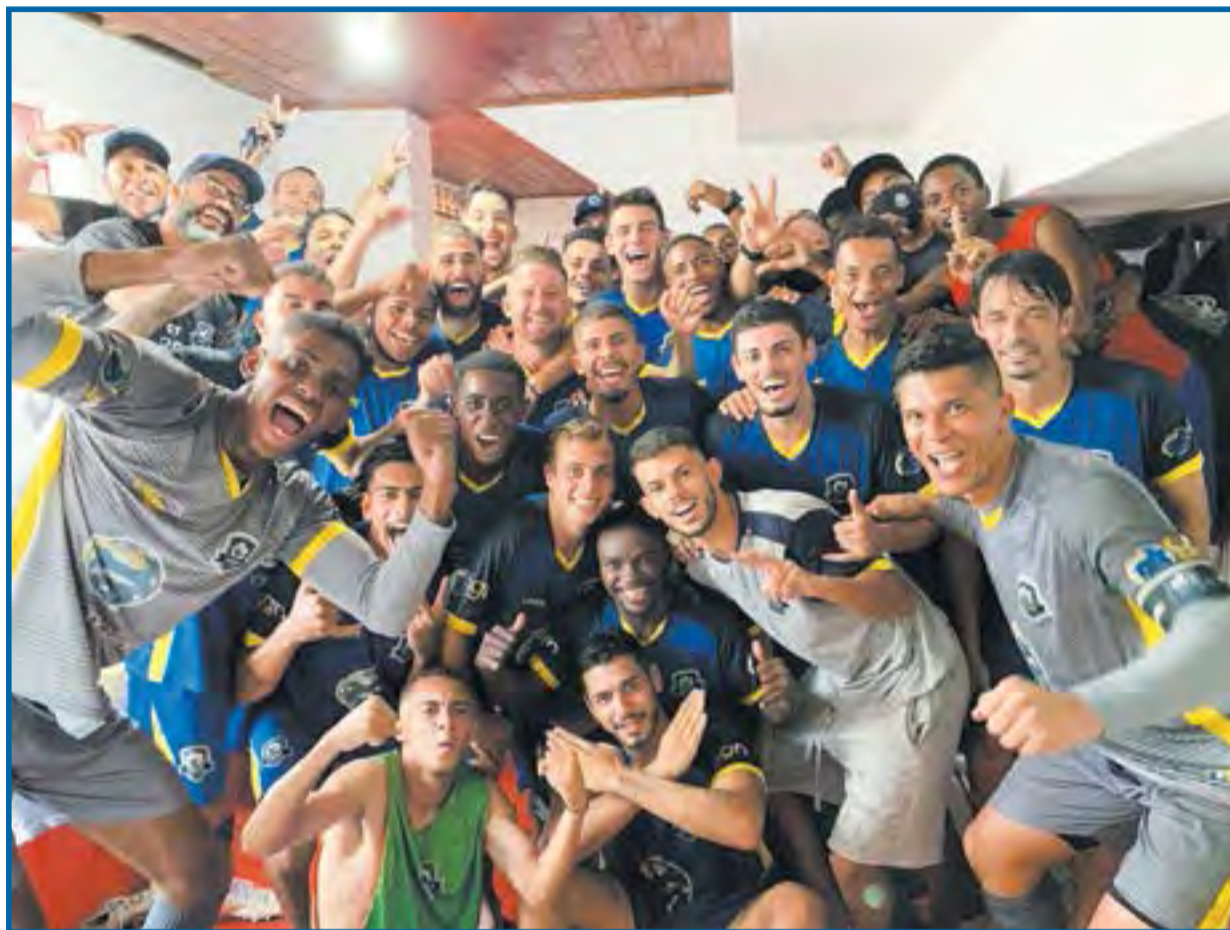
Elenco do Nação que conquistou o acesso em 2020 e a segunda colocação na Série C do Estadual

Cerca de um mês e meio após a informação sobre a instalação do Nação Esportes em Canoinhas ser divulgada, nenhuma novidade foi divulgada, nem por parte do clube, nem por parte da Administração Municipal, então, a comunidade passou a questionar como andavam as negociações entre clube e município. Isso motivou o CN, ao