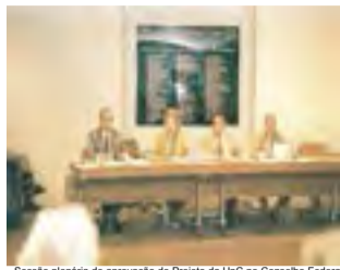
Sessão plenária de aprovação do Projeto da UnC no Conselho Federal de Educação - 1991