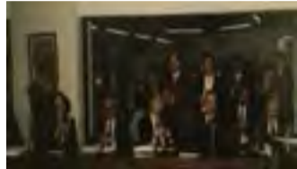
Plenária da aprovação do reconhecimento da UnC