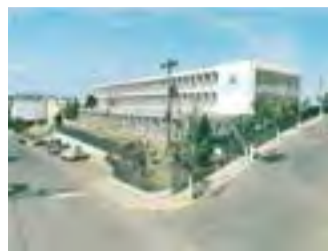
Prédio em Caçador/SC