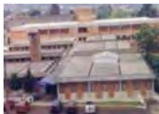
Prédio da UnC - Porto União