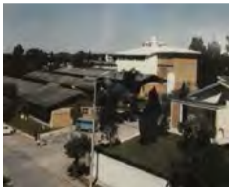
Prédio FUNPLOC - Centro de Canoinhas

Presidente FEARPE: Ardelino Grando Prefeito: Ardelino Grando Governador: Colombo Salles Presidente da República: Emílio Garrastazu Médici