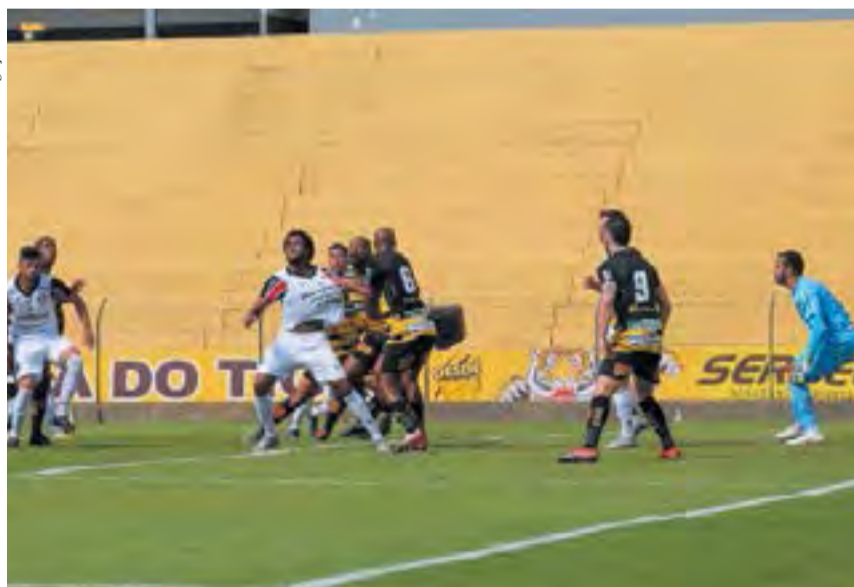
Equipe catarinense foi até o estado de São Paulo enfrentar o Novorizontino

O Joinville Esporte Clube empatou em 0 a 0 com o Novorizontino, na tarde de sábado, 28, em Novo Horizonte/SP, e está eliminado do Campeonato Brasileiro da Série D 2020.