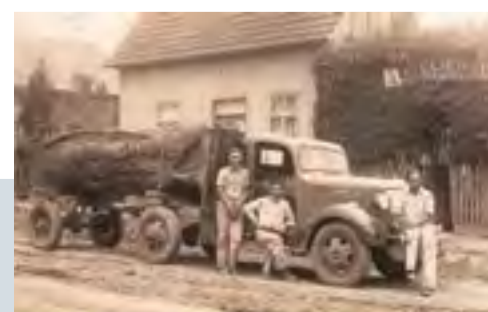
Caminhão movido a gasogênio. Motorista e ajudantes da Firma Wiegando Olsen de Marcílio Dias, provavelmente.