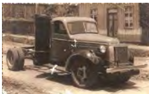
Caminhão movido a gasogênio da Firma Wiegando Olsen de Marcílio Dias. Acervo de Rodolfo Baukat.