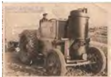
Trator movido a gasogênio provavelmente de propriedade da Firma Wiegando Olsen. Ano de 1940.