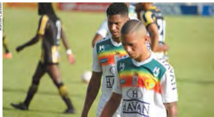
Cabisbaixos, jogadores do Brusque lamentam a derrota

Na tarde de sábado, 28, o Brusque FC sofreu a maior goleada de sua história como mandante: 8 a 1, para o Volta Redonda, do Rio de Janeiro, em partida válida pela Série C do Brasileirão. Ainda no primeiro tempo da partida, a equipe catarinense já perdia por 6 a 0.