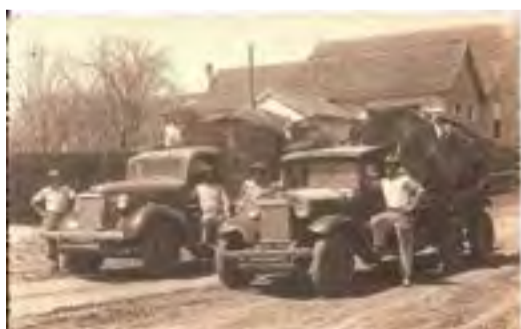
Motoristas e ajudantes da Firma Wiegando Olsen de Marcílio Dias. Caminhão movido a gasogênio. Foto Uhlig