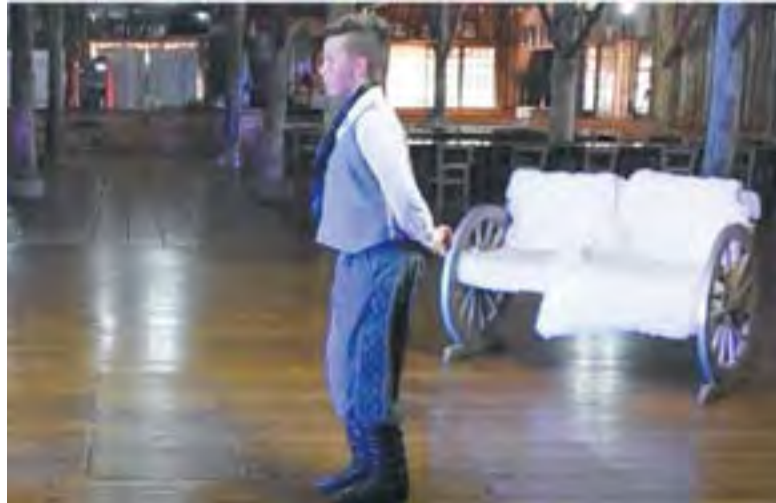
Coreografia tradicionalista conquistou o primeiro lugar Estilo Livre Solo Masculino Infantil - 11 a 15 anos