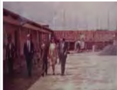
Construção FUNORTE - Mafra/SC