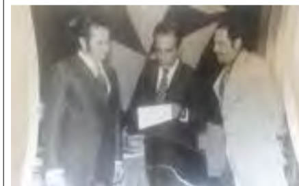
Solemnidade de entrega da autorização do curso de Ciências Contábeis no campus Curitiba/SC pelo Ministro da Educação Ney Braga