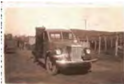
Caminhão movido a gasogênio. Firma Wiegando Olsen de Marcílio Dias.