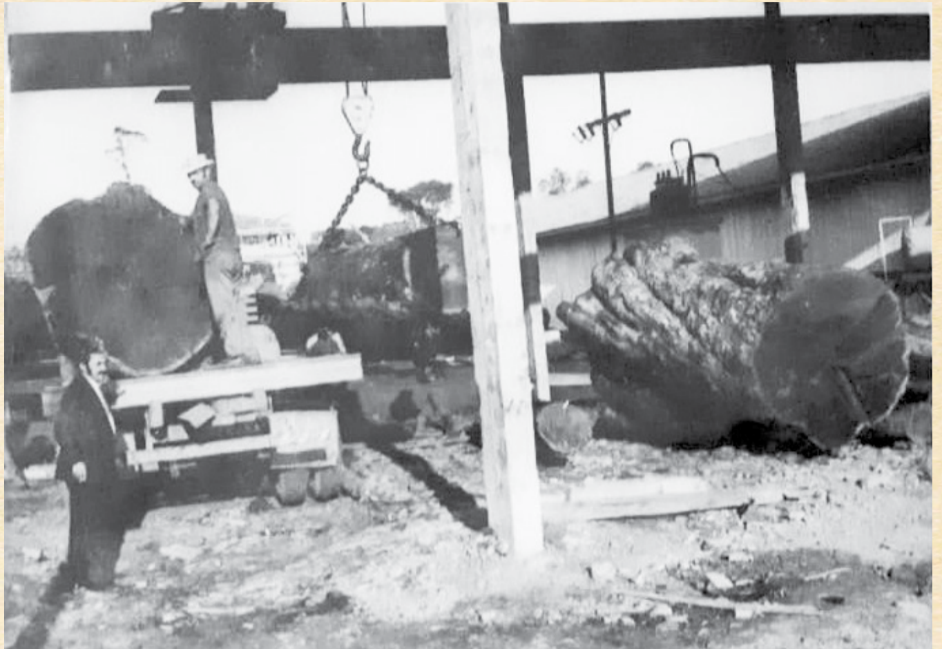
Antigo carregamento de madeiras da empresa

"Ser referência no seu setor de atuação, sempre de maneira objetiva, dinâmica e realista. Buscando inserir-se na Comunidade onde atua, contribuindo para melhores condições de vida aos seus colaboradores e de todos os envolvidos em sua cadeia produtiva".