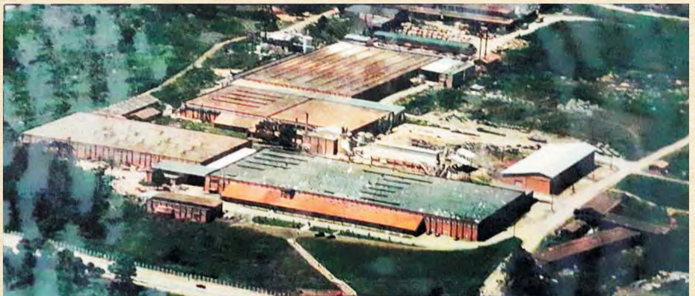
Vista aérea da unidade da empresa em Canoinhas

Após transformação em Sociedade Anônima de Capital Fechado que ocorreu em 16 de dezembro de 1965, onde passou a denominar-se de Indústria e Comércio Irmãos Zugman S/A, em 1971 a empresa instalou sua primeira fábrica de compensados em Canoinhas, desde então, a Irmãos Zugman amplia a sua capacidade de produção tendo em 1978 concluída