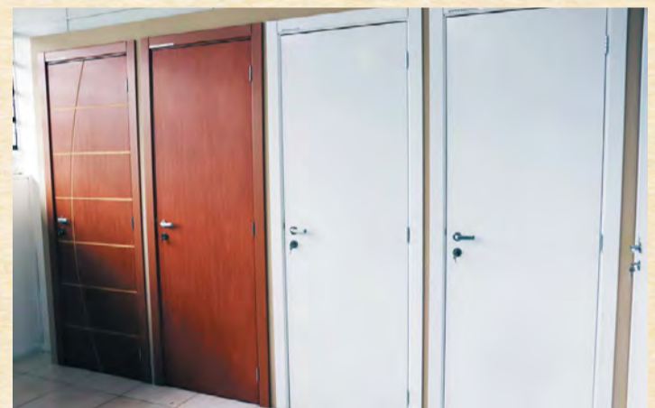
Mostruários do Kit Portas completo