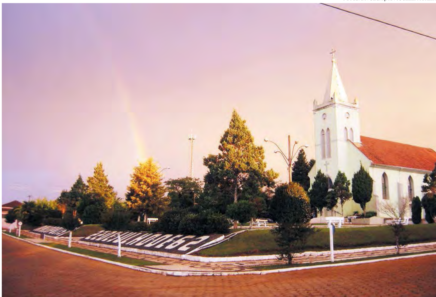
Praça da Igreja Matriz