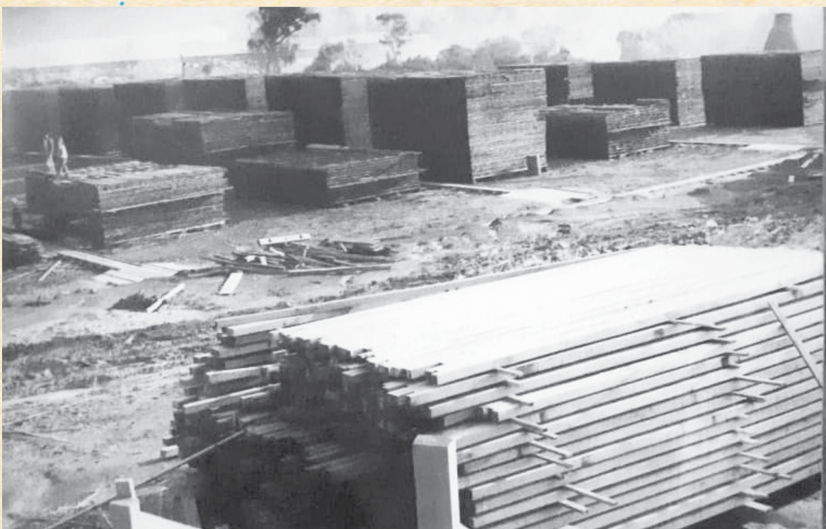
Empilhação de madeiras da Irmãos Zugman S/A