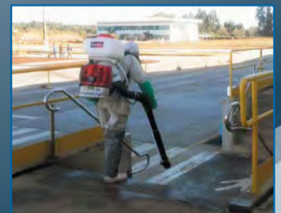
Funcionário fazendo a desinfecção da área