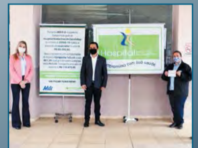
Doação ao Hospital