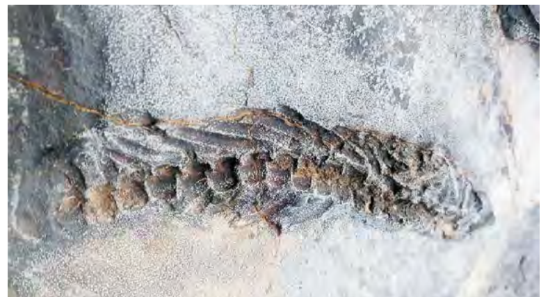
Cempaleo de Mafra foi chamado para estudar os fósseis