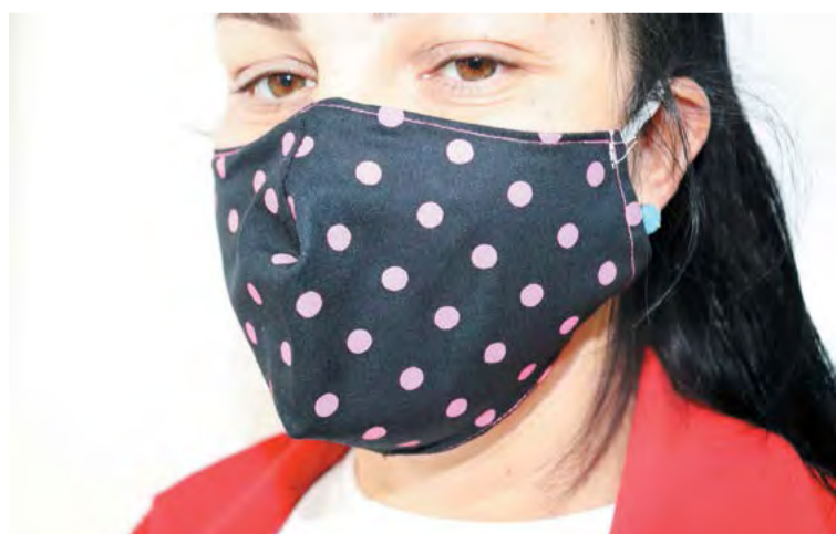
Máscaras devem cobrir o nariz e a boca e ficarem bem ajustadas ao rosto