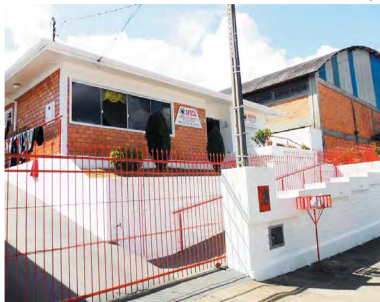
Apoca está localizada na Rua Benjamin Constant, no centro de Canoinhas