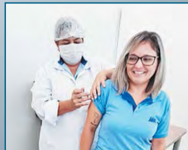
Vacinação de colaboradores