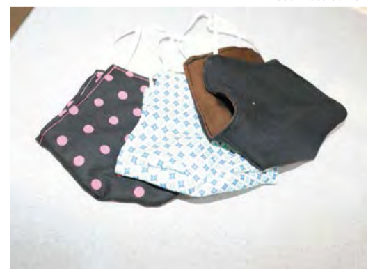
Produção das máscaras se tornou alternativa de renda para costureiras canoinhenses