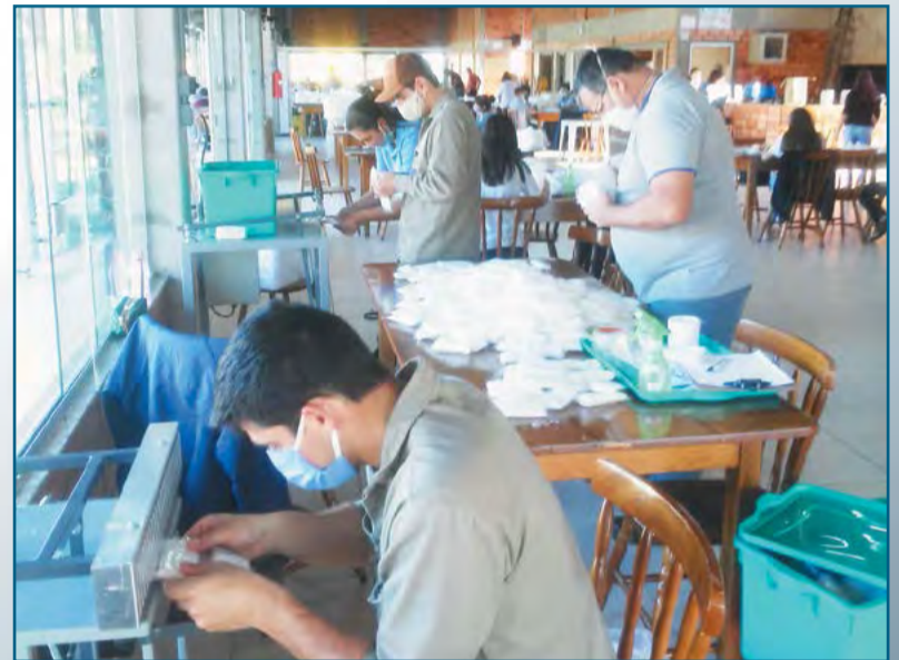
Confecção das máscaras

Fundada em 1983, a Mili é uma das maiores fabricantes brasileiras no segmento de higiene e limpeza. O papel higiênico Mili é apontado como o mais vendido do país entre os papéis de folha simples, segundo pesquisa Nielsen publicada pela Associação Brasileira de Supermercados (Abras). Seus produtos – papel higiênico, toalha de papel, guardanapos, fraldas descartáveis, absorventes higiênicos, hastes flexíveis e toalhinhas umedecidas – estão entre os líderes nacionais de mercado. Atualmente a empresa tem cerca de 1.800 colaboradores, distribuídos por três unidades fabris localizadas em Santa Catarina, Paraná e Alagoas. Saiba mais em: www.mili.com.br e www.facebook.com/MiliOficial ■