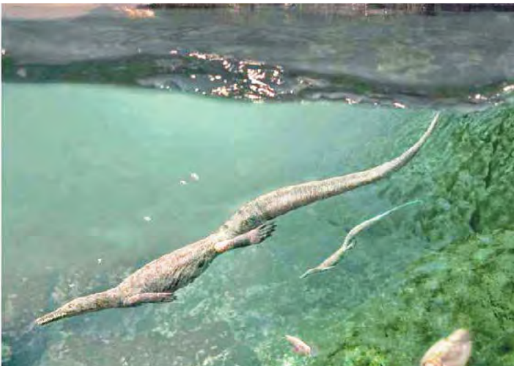
Os mesossauros habitaram a região há cerca de 250 milhões de anos