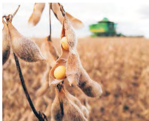
Semente de soja é um dos primeiros insumos que o produtor rural costuma adquirir, ao mesmo tempo, é um dos insumos mais sensíveis à qualidade

Portanto, neste momento, de compras antecipadas e planejamento, vale muito atentar para a qualidade do produto que se está comprando, principalmente a qualidade de sementes de soja, não apenas o material genético, mas também vigor, germinação