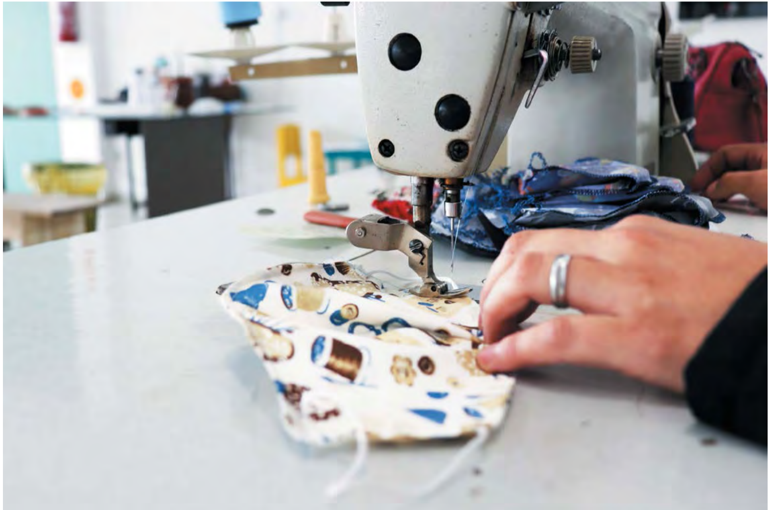
Máscaras estão sendo confeccionadas artesanalmente em Canoinhas

O Ministério da Saúde alerta que é importante que a máscara seja feita nas medidas corretas, cobrindo totalmente a boca e nariz e que estejam bem ajustadas ao rosto, sem deixar espaços nas laterais. ■