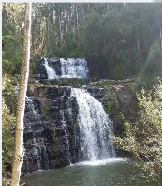
Outro atrativo turístico é a cachoeira Serra dos Borges, que possui duas quedas totalizando 13 metros de altura