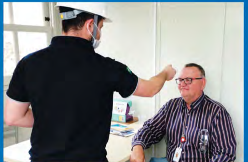
Aferição de temperatura dos colaboradores do projeto, funcionários, clientes, fornecedores e visitantes.

Dispomos de dois ambulatórios médicos: um para a triagem dos colaboradores, com aferição de temperatura na entrada do projeto; e outro para atendimento médico exclusivo a quem trabalha na obra. Além disso, comunicamos e reforçamos, diariamente, a importância em todos seguirmos as recomendações de prevenção do Ministério da Saúde, por meio de conversas e materiais de conscientização.