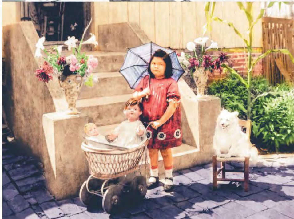
Desta vez apresentamos outra foto de Curt Uhlig, retratando uma criança desconhecida. A colorização é obra da jornalista e fotógrafa Jucelli Moreira.