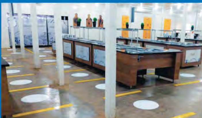
Marcações reforçam distanciamento no refeitório do projeto

Nas repúblicas - onde moram parte dos colaboradores do projeto, apenas duas pessoas poderão dividir quartos , para manter o distanciamento necessário para a prevenção da COVID-19.