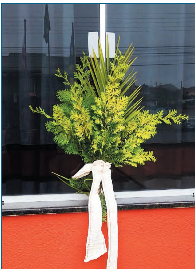
Lindo quartel de Bombeiros de Três Barras, decorado para a benção de Ramos que aconteceu no domingo, 05.