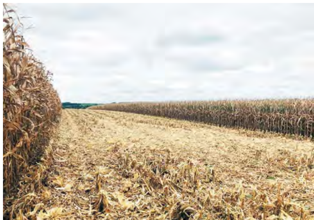
Lavoura de milho sendo colhida em Papanduva

Para os agricultores que deixaram de plantar a cultura nos últimos anos, que tal voltar a plantar na próxima safra? O milho traz uma série de benefícios para a propriedade, ajudam desde a redução da ociosidade de máquinas e operadores, escalonam plantio e colheita com as demais culturas, ajudam na construção do perfil de solo, trazem novos herbicidas para o manejo das plantas daninhas de difícil controle e o mais importante, trazem retorno no curto e no longo prazo! ■