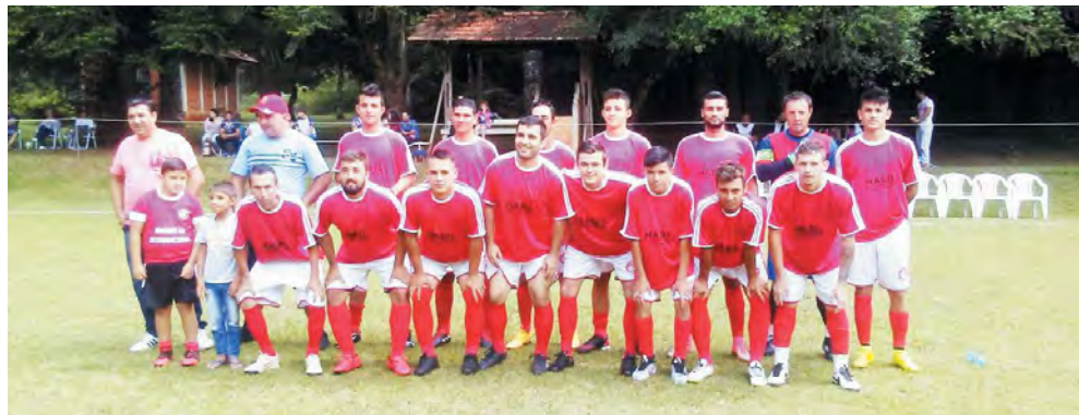
Amigos do Internacional