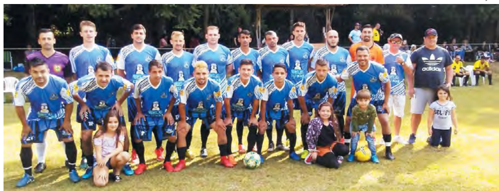
Amigos Gelo Cubas