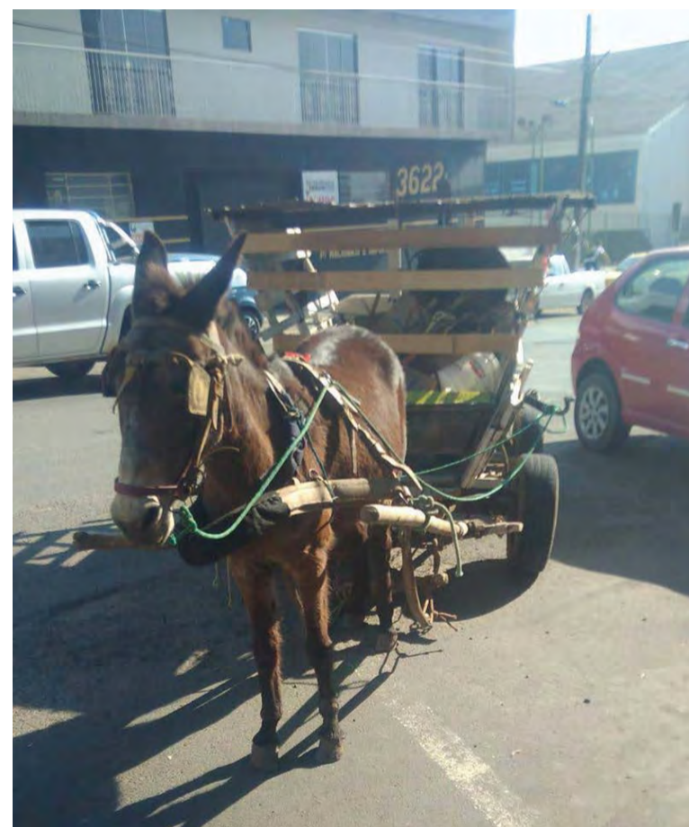
O terceiro caso foi de um burro que não aguentou o peso da carroça

O Cavalo de Lata também foi um projeto de lei de iniciativa popular que propunha substituir as carroças tracionadas por equídeos, por veículo de propulsão humana ou motorizada, como as bicicletas normais ou as bicicletas elétricas, buscando melhorar as condições de trabalho e vida dos carroceiros, bem como o bem-estar dos animais. Um abaixo assinado online foi elaborado como forma de pressionar a Câmara de Vereadores, no entanto o projeto não foi para o Plenário. ■