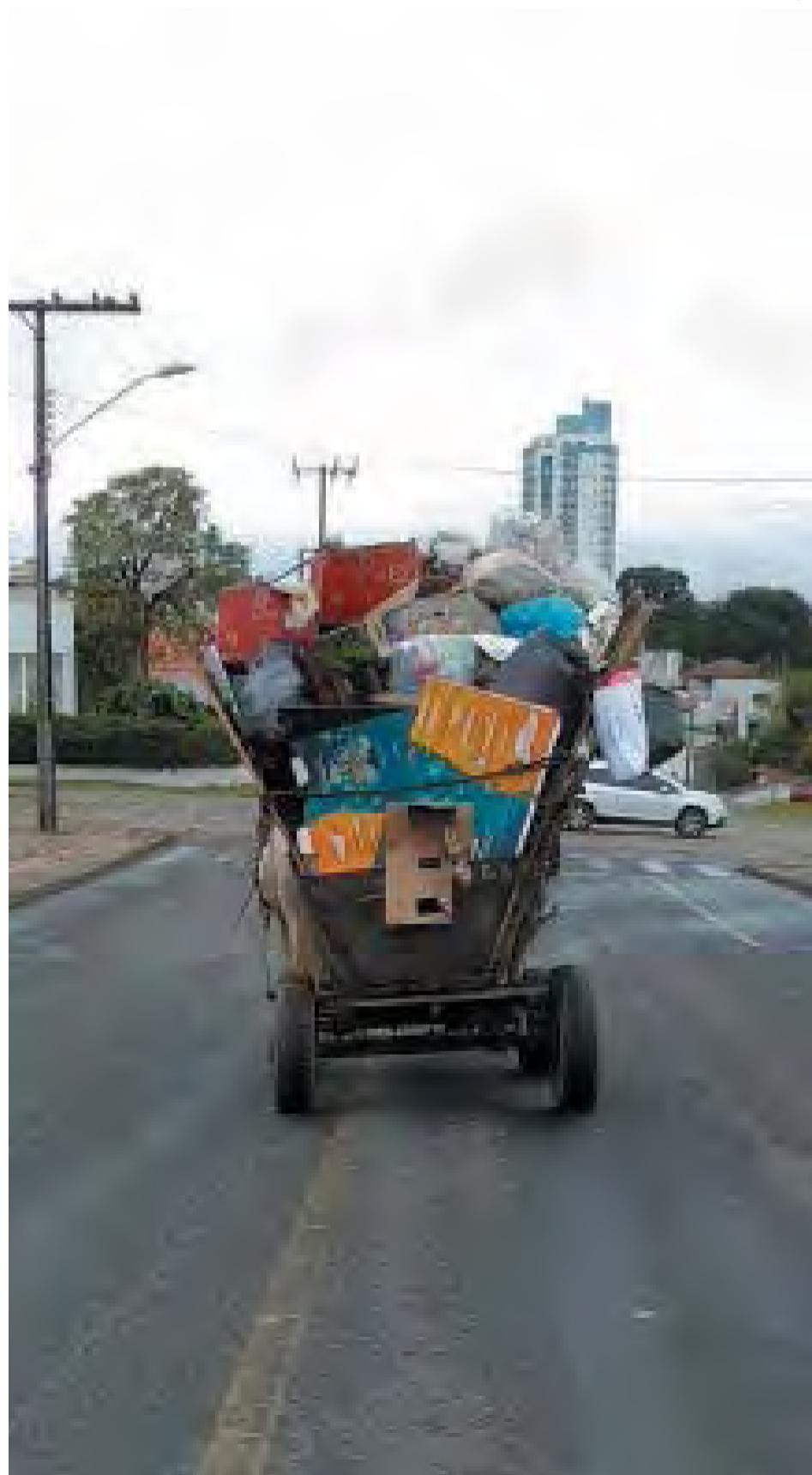
Em Canoinhas, era comum encontrar cavalos puxando carroças sobrecarregadas