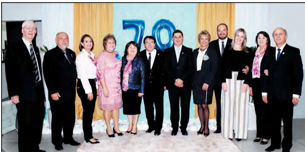
70 anos do Rotary club de canoinhas