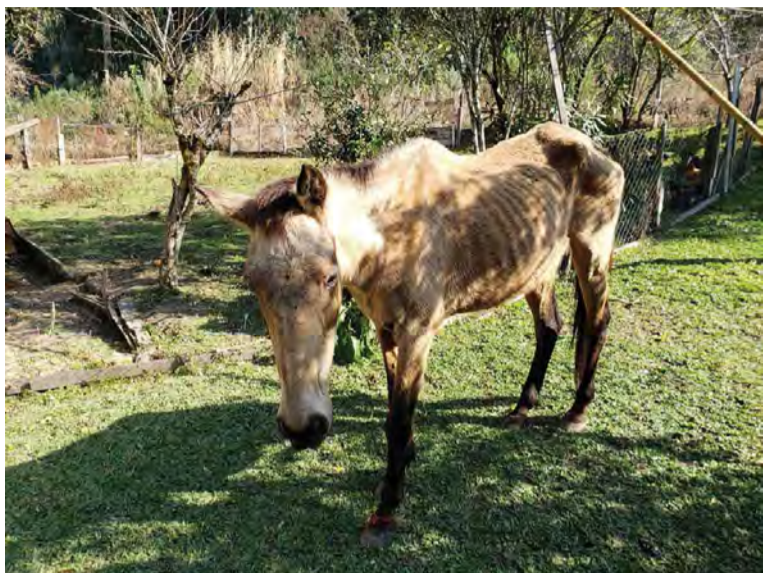
Não será permitido cavalos soltos ou presos em vias e logradouros públicos

valor da UFM, o valor para este ano é de R$3,4524, conforme Memorando nº 002/2020 do Departamento de Tributação, portanto, o resultado da soma apresentado acima são com base neste documento.