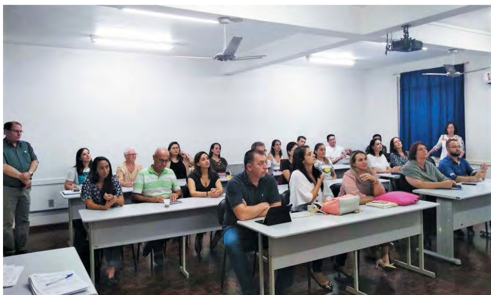
Alunos da 5ª turma do Programa de Mestrado