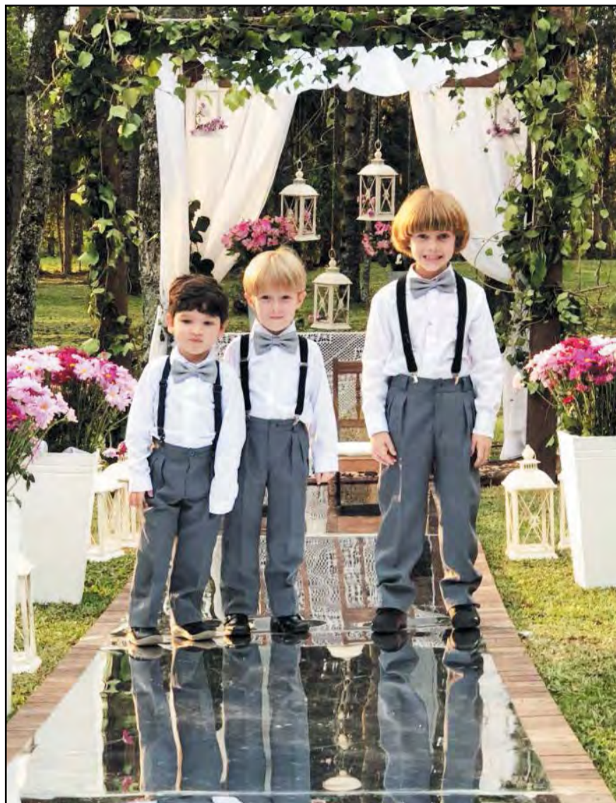
Pajens dando um show