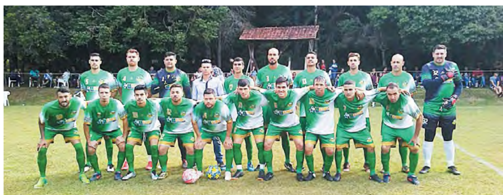
Ouro Verde FC