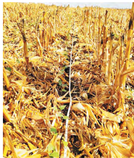
Plantio de feijão safrinha pós cultura do milho em Três Barras

Com base em tudo que foi apresentado nos resta apenas uma certeza, não existe decisão fácil a ser tomada no dia-a-dia da agricultura, os fatores que afetam o resultado final de uma lavoura são inúmeros e muitas vezes são detalhes que separam o lucro do prejuízo em uma propriedade. Acompanhar o mercado da cultura, as previsões do tempo, zoneamento climático, conversar com seu técnico e observar o histórico dos últimos anos são as melhores ferramentas para tomar uma boa decisão, minimizar riscos e buscar uma boa safra. ■