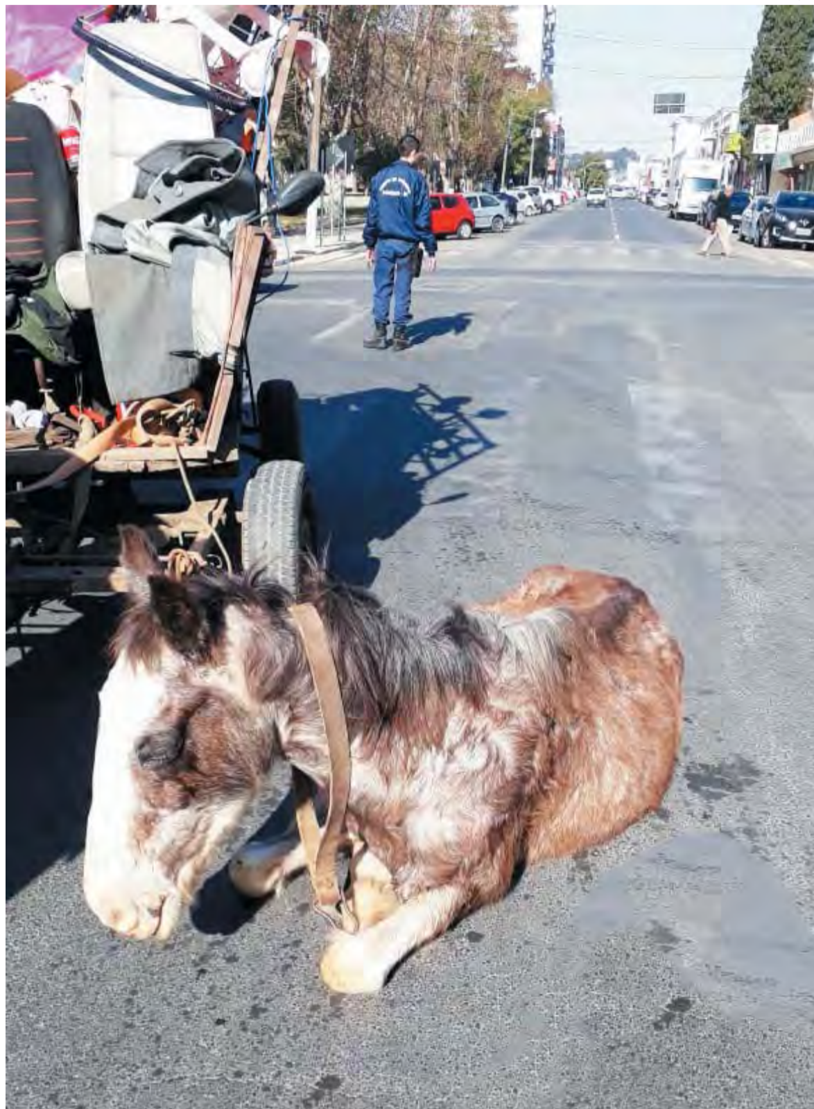
Segundo caso antes da criação da lei aconteceu no dia 24 de julho

"Acontece que para que se caracterize os maus-tratos, em muitos casos, a Polícia Militar precisa que um veterinário vá ao local e assine um laudo atestando isso. Não sei porque muitas vezes isso não era possível e o infrator saía