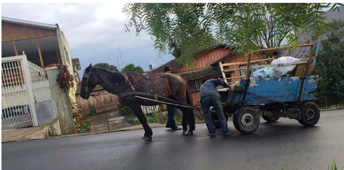
Veículos de tração animal não serão mais permitidos em Canoinhas