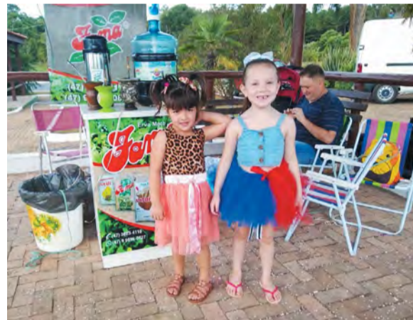
Inspirados pela folia de Carnaval, alguns dos pequenos marcaram presença fantasiados

FOLIA: Ao som das tradicionais marchinhas, crianças, jovens e adultos de todas as idades curtiram o Carnaval em Três Barras, no último domingo, 23, na praça Prefeito Emiliano Uba, no centro da cidade.