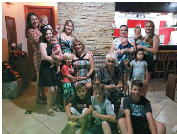
Dona Anna tinha doze netos e dez bisnetos