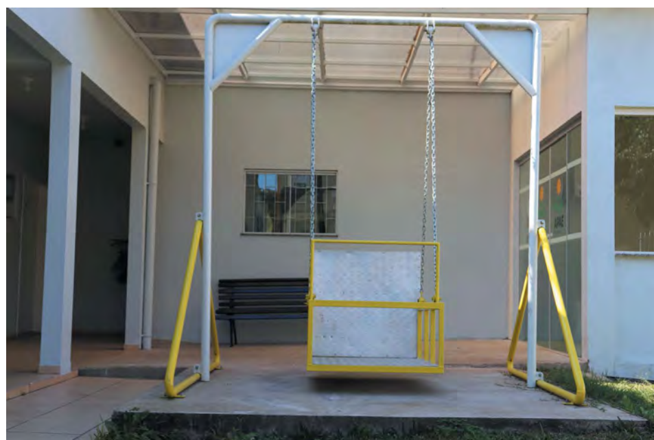
Acessibilidade: Balanço para cadeira de rodas