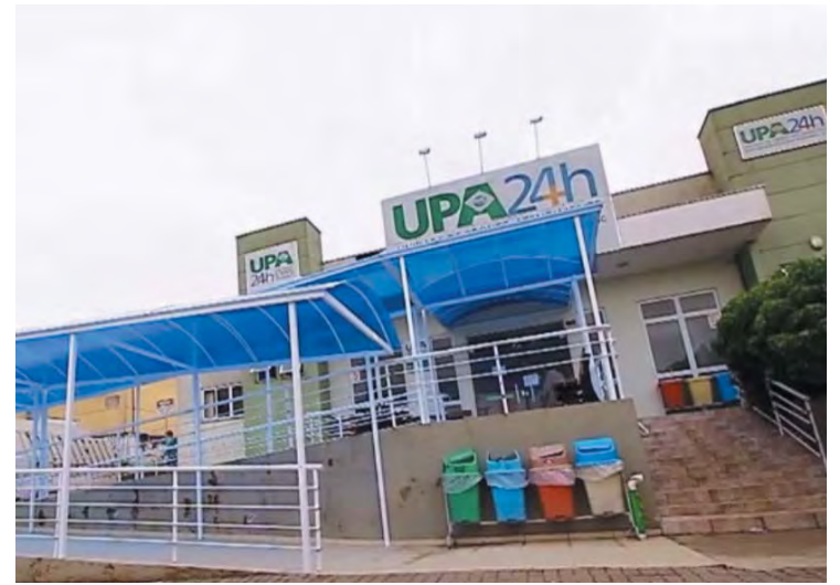
Prioridade na UPA serão casos de urgência e emergência

A secretária lembra que Canoinhas está investindo e inovando com ações de curto, médio e longo prazo. “Toda mudança gera desconforto, mas em breve a população vai notar os resultados positivos desta proposta”, avalia.