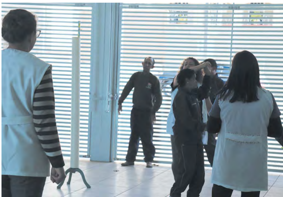
Ensaio para o show de talentos, que acontece na próxima quinta-feira. 22

De acordo com o Censo IBGE 2010, o Brasil tem 45.606.048 de pessoas com deficiência, o que equivale a 23,9% da população do País. 18,60% foram declaradas pessoas com deficiência visual, 7% com deficiência motora, 5,10% com deficiência auditiva e 1,40% com deficiência mental.