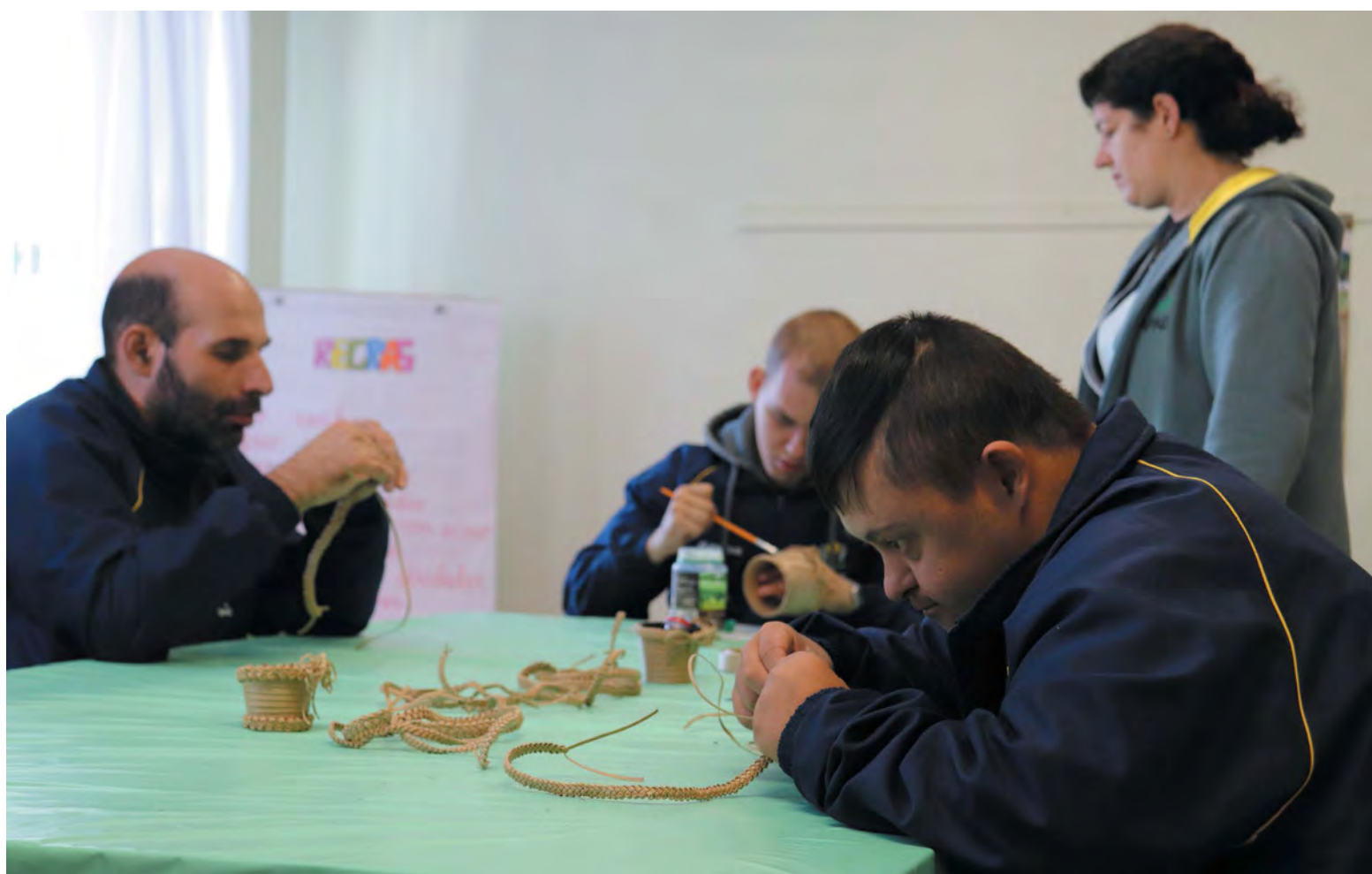
Usuários na Sala Verde, fazendo trabalho manual para o estímulo das habilidades finas e motoras