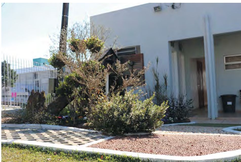
Jardim sensorial para estímulo dos sentidos (tato, olfato, paladar, audição, visão) dos usuários