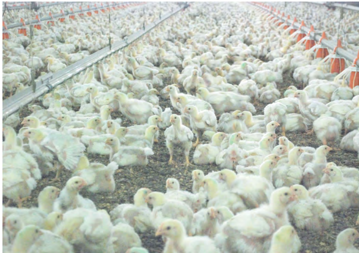
As carnes de aves representam 24% das exportações catarinenses