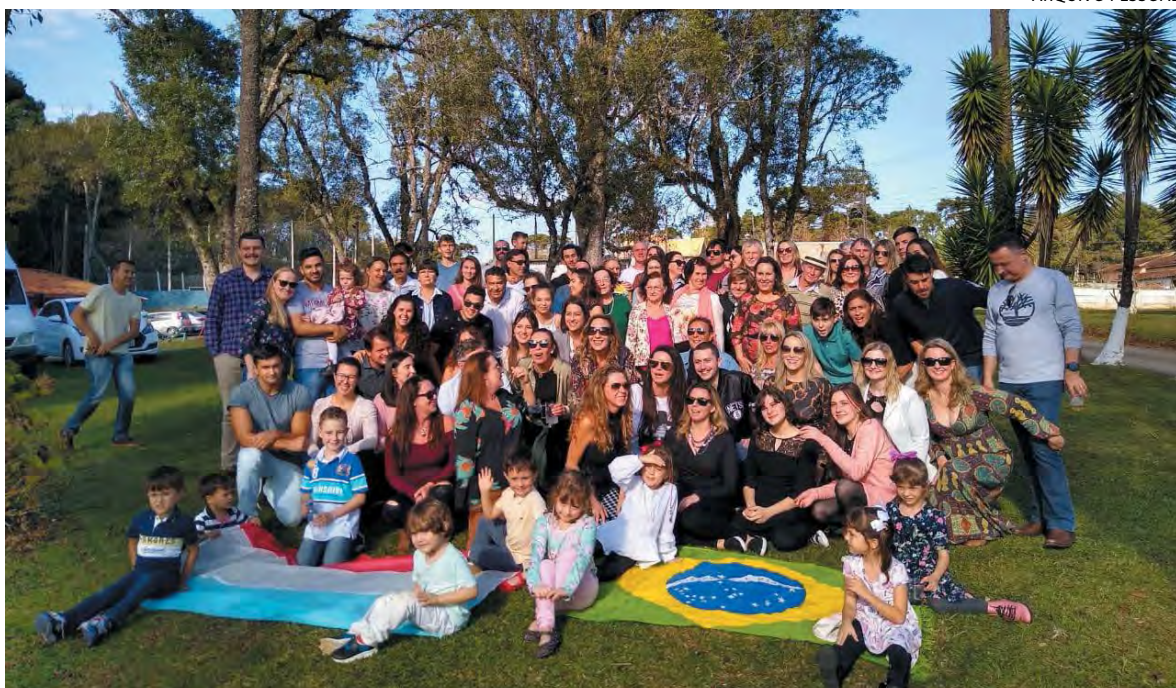
A família se reuniu para comemorar a conquista no domingo dia 29 de junho