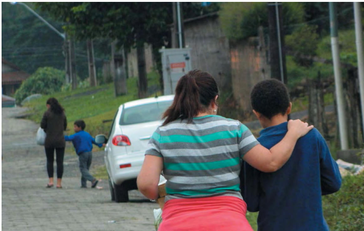
Além de atenção e carinho, o apadrinhamento afetivo visa o desenvolvimento físico, mental, moral, espiritual e social

Os interessados devem procurar o Setor de Assistência Social do Fórum da Comarca de Canoinhas, na Rua Duque de Caxias, 80, Centro, ou entrar em contato pelo telefone (47) 3621-5600