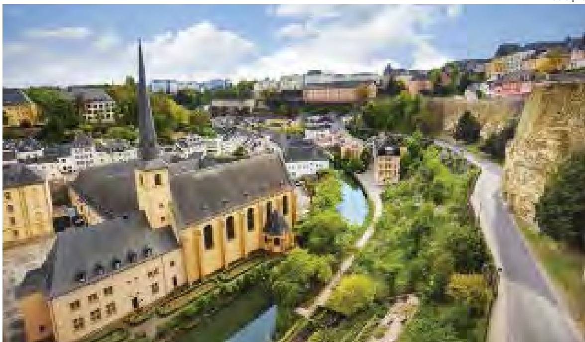
Luxemburgo é um pequeno país europeu, rodeado por Bélgica, França e Alemanha