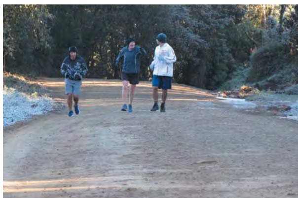
Temperatura negativa e a geada acompanharam os corredores pelos 54 km percorridos na serra