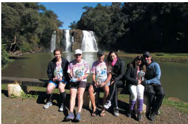
No cartão postal da cidade, na cachoeira do Rio Espingarda, equipe (atletas e apoio) da Wipi Run descansa após maratona

Com pouco tempo de existência, a equipe já conquistou mais de 40 pódios, entre medalhas e trofeus. Agora a WipiRun se concentra no próximo grande desafio, que acontecerá em outubro, na cidade de União de Vitória. Serão 12 horas de prova noturna, largando às 21 horas para chegar às 9 horas da manhã seguinte. A meta é correr de 80 km à 100 km neste dia.