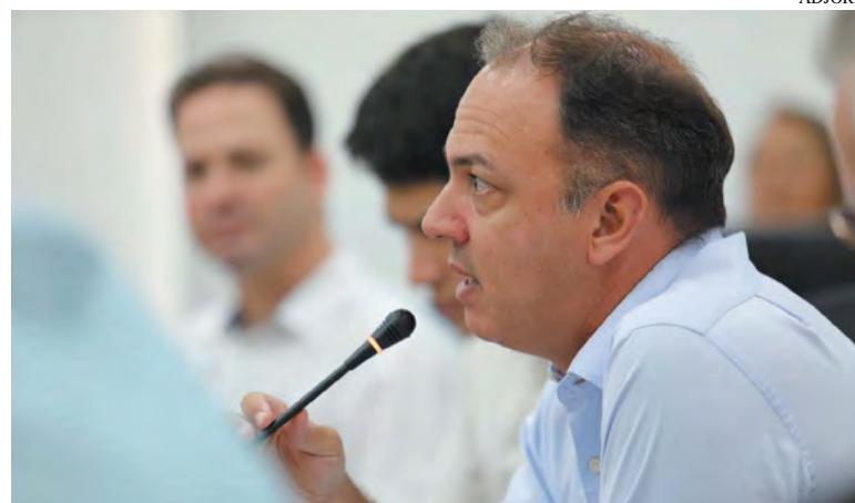
A fim de discutir ações para a saúde, autoridades catarinenses promoveram um evento no último dia 5

RCN/PE - Um dos argumentos para o projeto era de que a inflação da