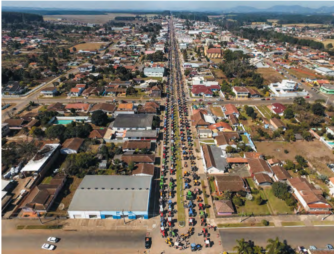
Tratoração realizado em 2017

O município tem o maior desfile de tratores do Brasil