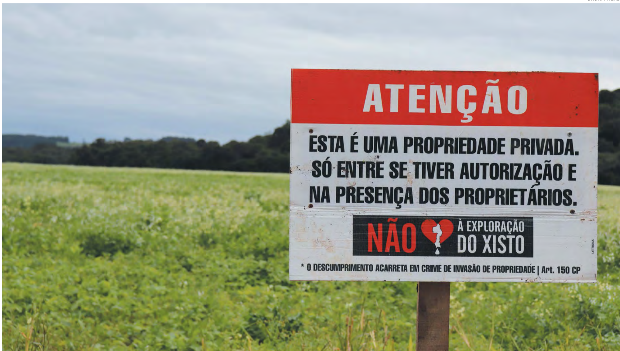
Placa encontrada por todo o interior dos municípios de Papanduva e Três Barras