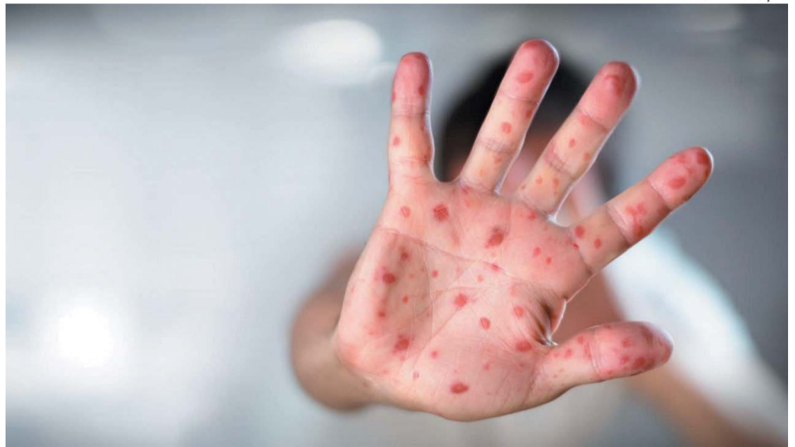
Caracterizada por feridas na boca, pés e mãos, a Síndrome de Coxsackie é uma infecção viral