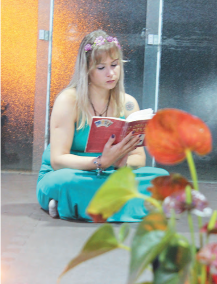
Para Tathiane o Sagrado Feminino é o resgate de si mesma, como mulher, mãe, esposa e profissional