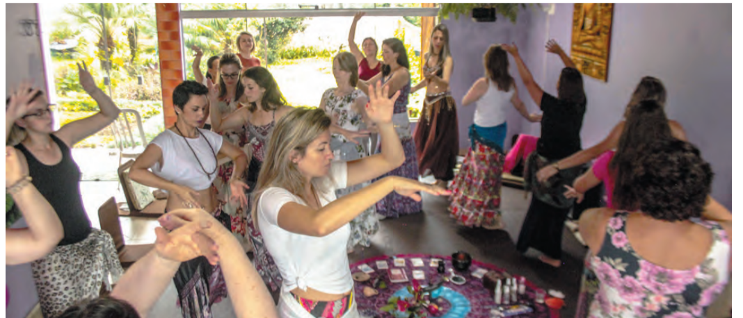
Conversas, danças, meditação e troca de experiências aconteceram durante o evento