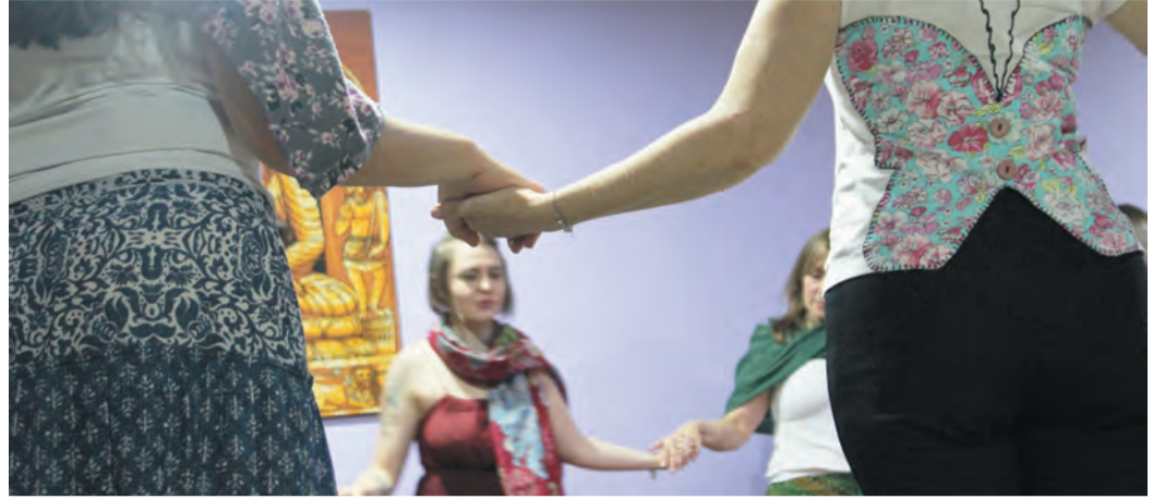
O movimento busca difundir os saberes, antigos e novos, e reconectar o corpo da mulher à sua essência