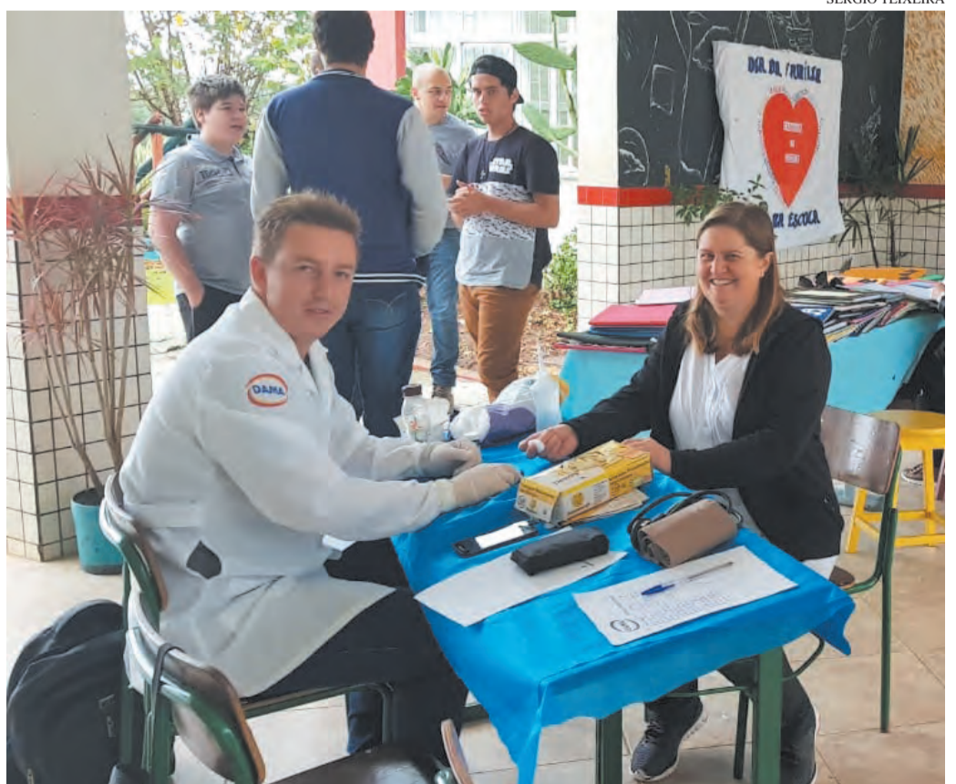
Teste de glicemia em Monte Castelo