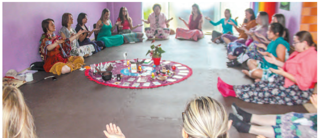
O círculo resgata elementos de tradições milenares que auxiliam na busca pelo autoconhecimento, como a prática de meditação