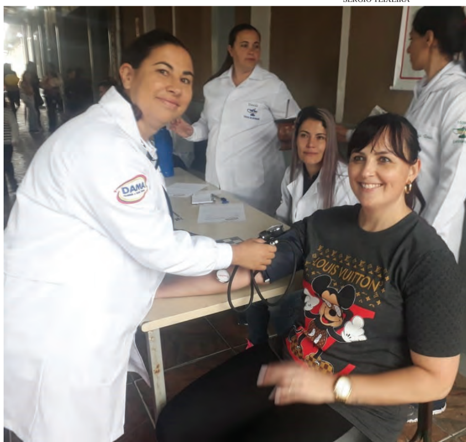
Alunos na EEF Sagrado Coração de Jesus