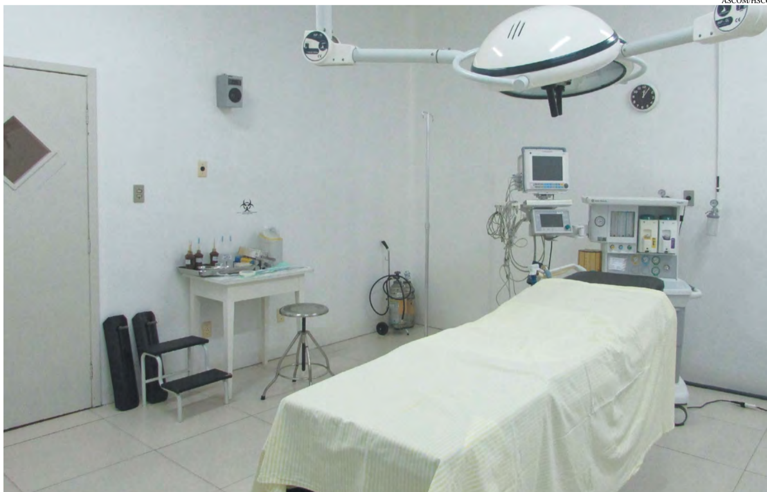
Pacientes estão com exames prontos e aguardam as cirurgias nas filas

Então das 941 cirurgias que estão aguardando na fila,