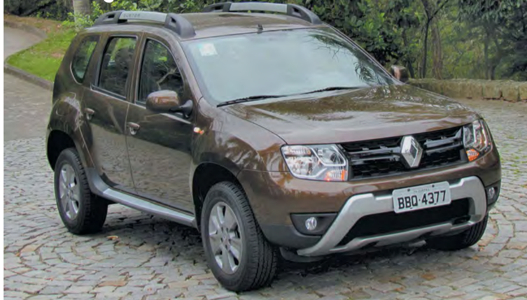
LUIZA KREITLON/AGÊNCIA AUTOMOTRIX