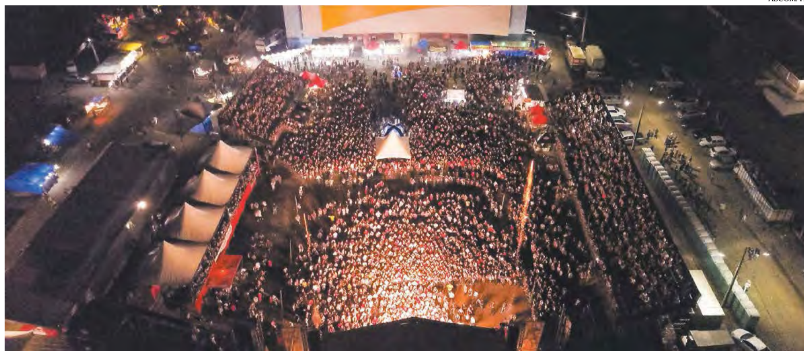
Arena lotada durante o show nacional dos sertanejos Fernando e Sorocaba