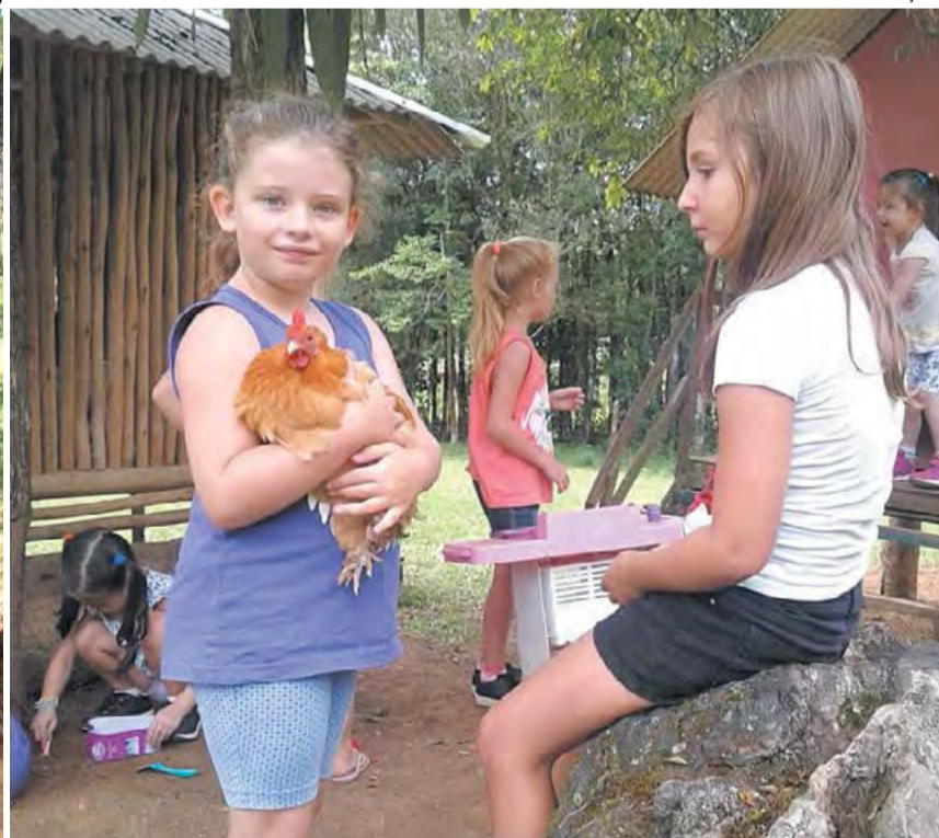
A intenção é promover o contato das crianças com a natureza

mo local. Somos o diferencial na região, por oferecer o turismo pe-