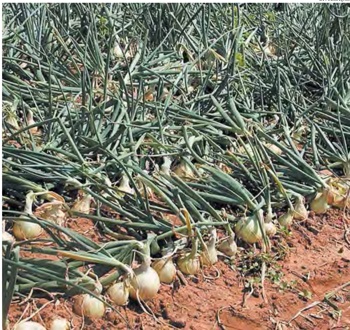
Era esperada uma colheita de 100 mil toneladas, mas ela deve ficar em apenas 80 mil