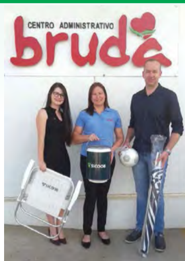
ESTABELECIMENTO SIPAG Supermercado Bruda