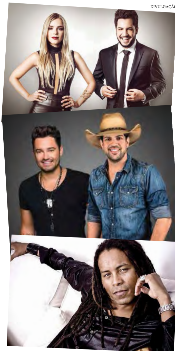
Thaeme e Thiago, Fernando e Sorocaba e Serginho Moah são alguns dos shows nacionais