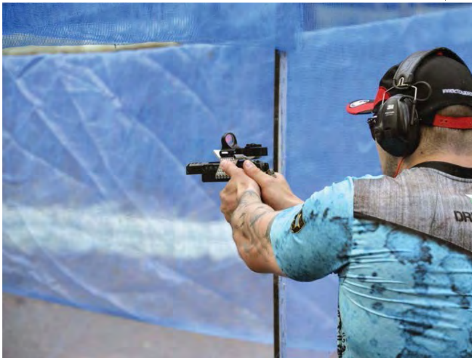
Integrante do Clube de Tiro de Canoinhas, praticando tiro ao alvo