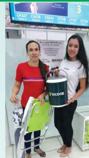
ESTABELECIMENTO SIPAG Mercearia Muller