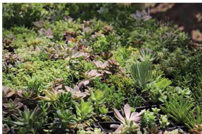
São mais de 600 espécies de flores