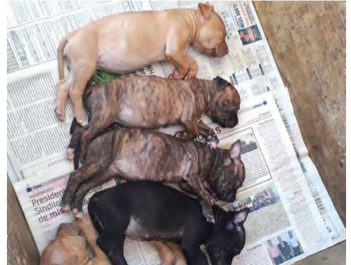
Os cães foram roubados para serem vendidos