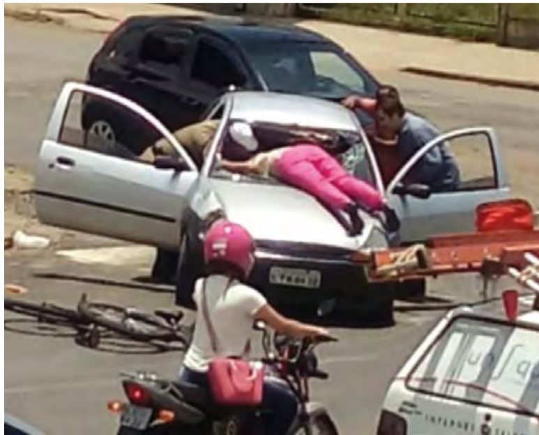
A mulher teve ferimentos no rosto e no abdômen