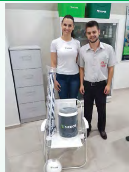
ESTABELECIMENTO SIPAG Restaurante e Pizzaria Portal