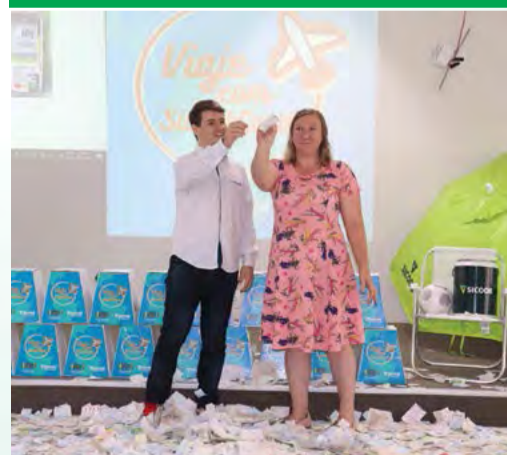
REALIZADO NA MATRIZ DE CANOINHAS