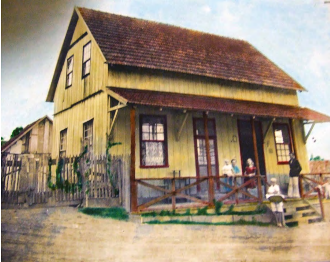
Não consegui identificar a localização desta imagem colorida a mão, mostrando uma magnífica residência ou um estabelecimento comercial, possivelmente dos anos 1940.