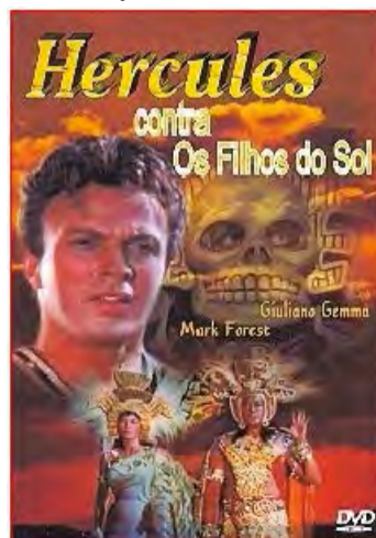
Hércules contra o Filho do Sol