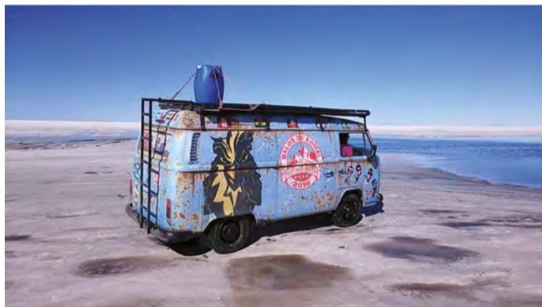
A Kombi recebeu uma plotagem personalizada e levava o nome da expedição: Galos de Kombi

dência e o grupo agora já projeta novos roteiros.