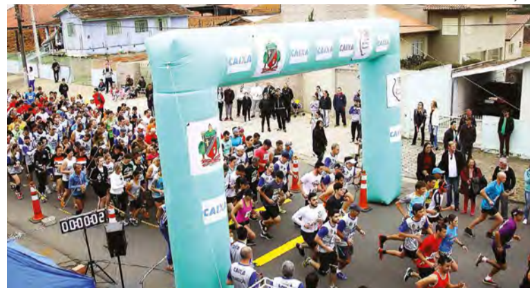
14ª Corrida Rústica do Dia do Trabalhador que contou com a participação de 300 atletas

Pela primeira vez Canoïnhas teve duas corridas no ano. Em setembro, o evento celebrou o aniversário de Canoïnhas com a participação de 500 pessoas de 15 municípios