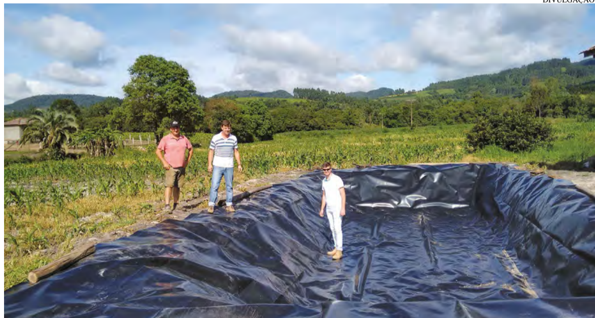
Nos últimos dois anos no município de Irineópolis foram instaladas trinta e quatro esterqueiras em vinte propriedades produtoras de leite