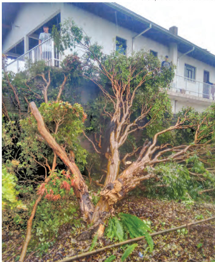
Árvores caíram e casas foram destelhadas no bairro Sossego no sábado, 13