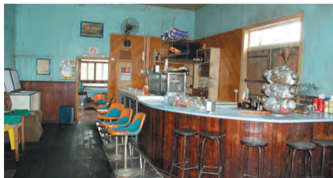
Dependências do bar