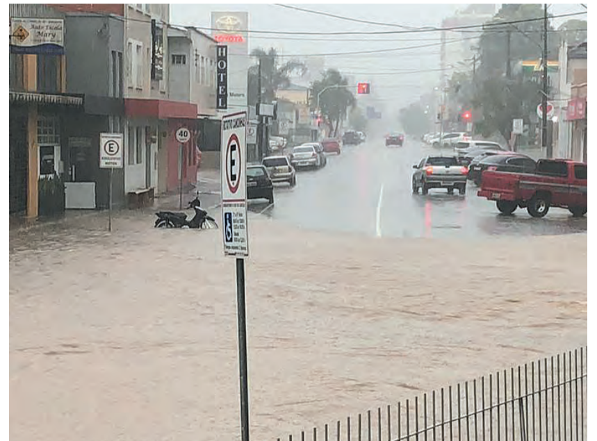
Rua Vidal Ramos, no Centro, na manhã de ontem, 18