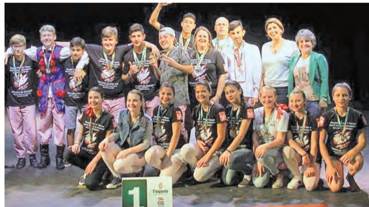
N.E. Adolfo Konder – 1º. lugar na Categoria infantil Danças Populares e Folclóricas. - Coreografia: Danças da Região da Krakowiak