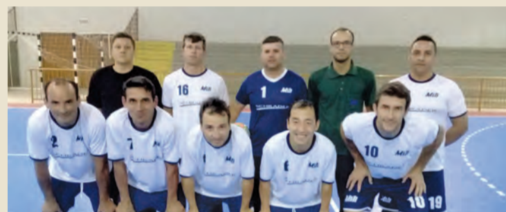
2º LUGAR - MILI A