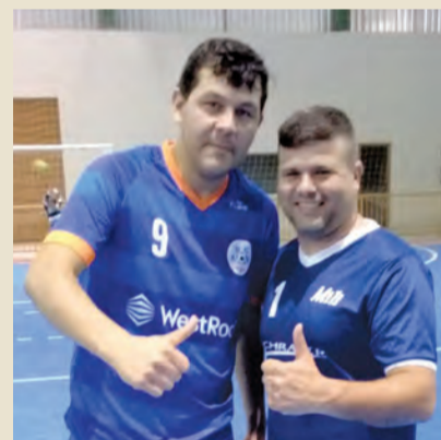
3º LUGAR - WESTROCK