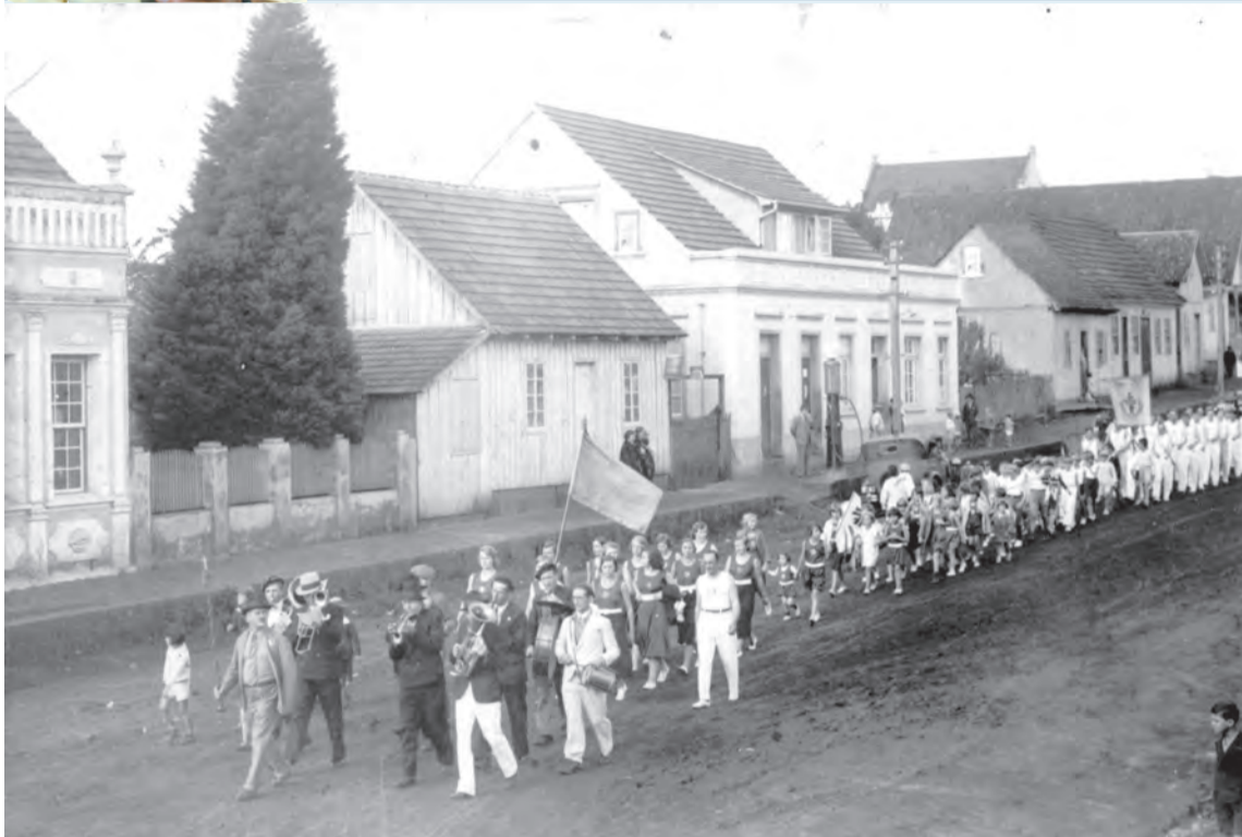
Em 1935, na Rua Major Vieira, um desfile da Sociedade de Ginástica Jahn. Diante da Casa Mayer (o segundo prédio em evidência), uma bomba manual de gasolina.