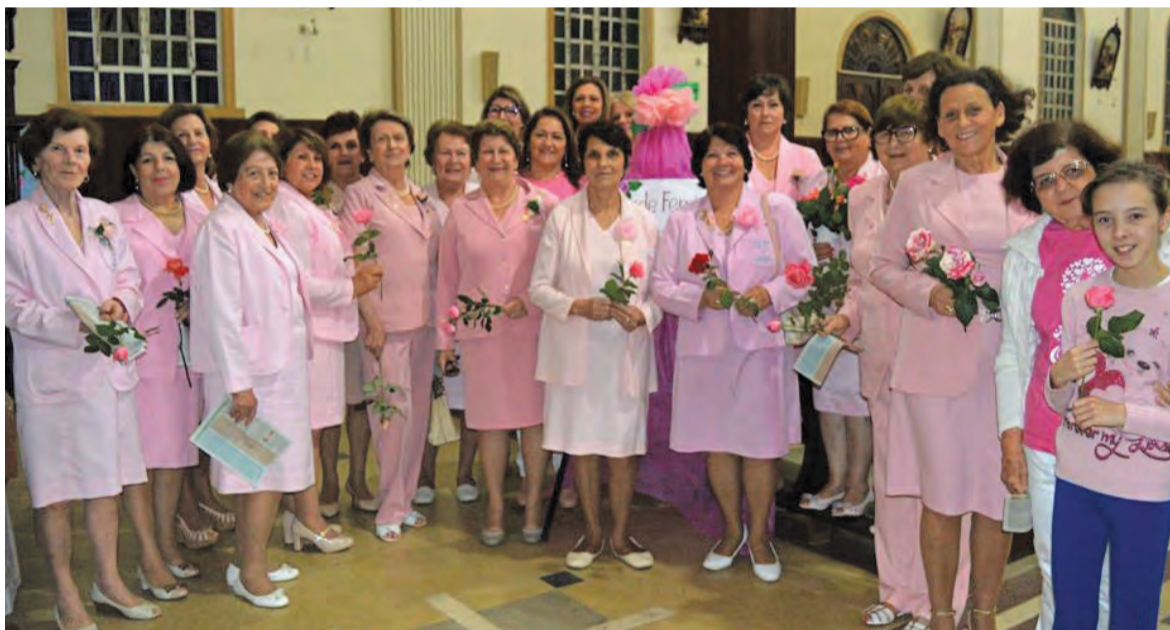
Voluntárias da Rede Feminina na abertura do Outubro Rosa, celebrada no dia 1º, na Igreja Matriz Cristo Rei.