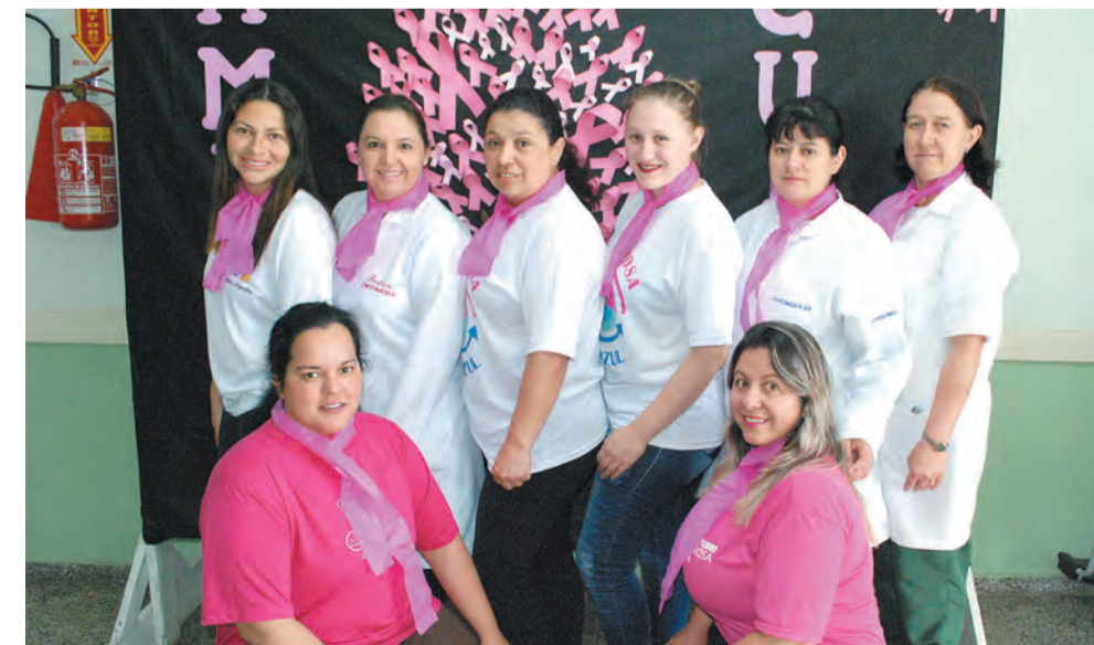
Equipe de Saúde da UCS - Canoinhas