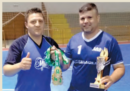
1º LUGAR - MILI B

Na última terça-feira (02), aconteceu a final da modalidade de Futsal Masculino Livre, confira os resultados: