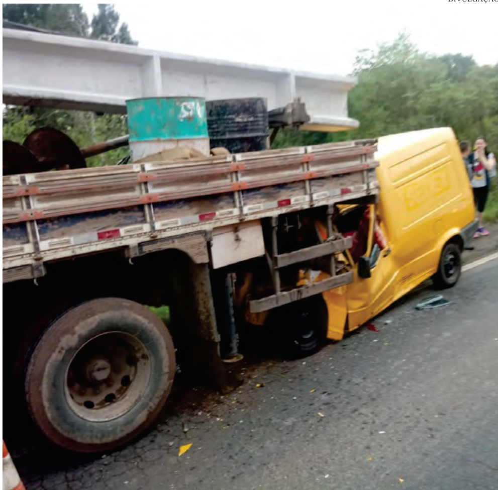
Veículo colidiu com o caminhão parado no acostamento

A equipe do SAMU se também prestou atendimento e a vítima foi encaminhada até a Unidade de Pronto Atendimento (UPA) de Canoinhas.