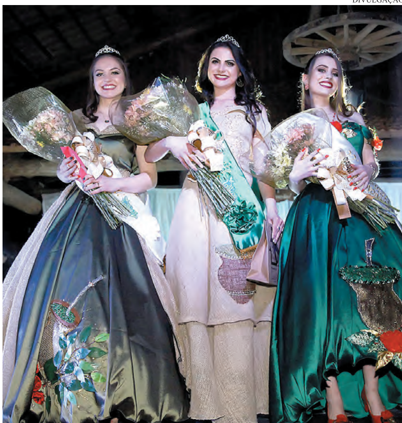
Rainha e princesas da 22ª Fesmate

A eleição da rainha da Fesmate teve suas origens na década de 1980, e desde então vem dando um brilho especial às festividades comemorativas pelo aniversário de Canoinhas. À realeza da 22ª Fesmate caberá a missão de levar o nome do município, as tradições e a programação da festa para o público, além de acompanhar os eventos que acontecerão no Parque de Exposições Ouro Verde, entre os dias 12 e 16 de setembro.