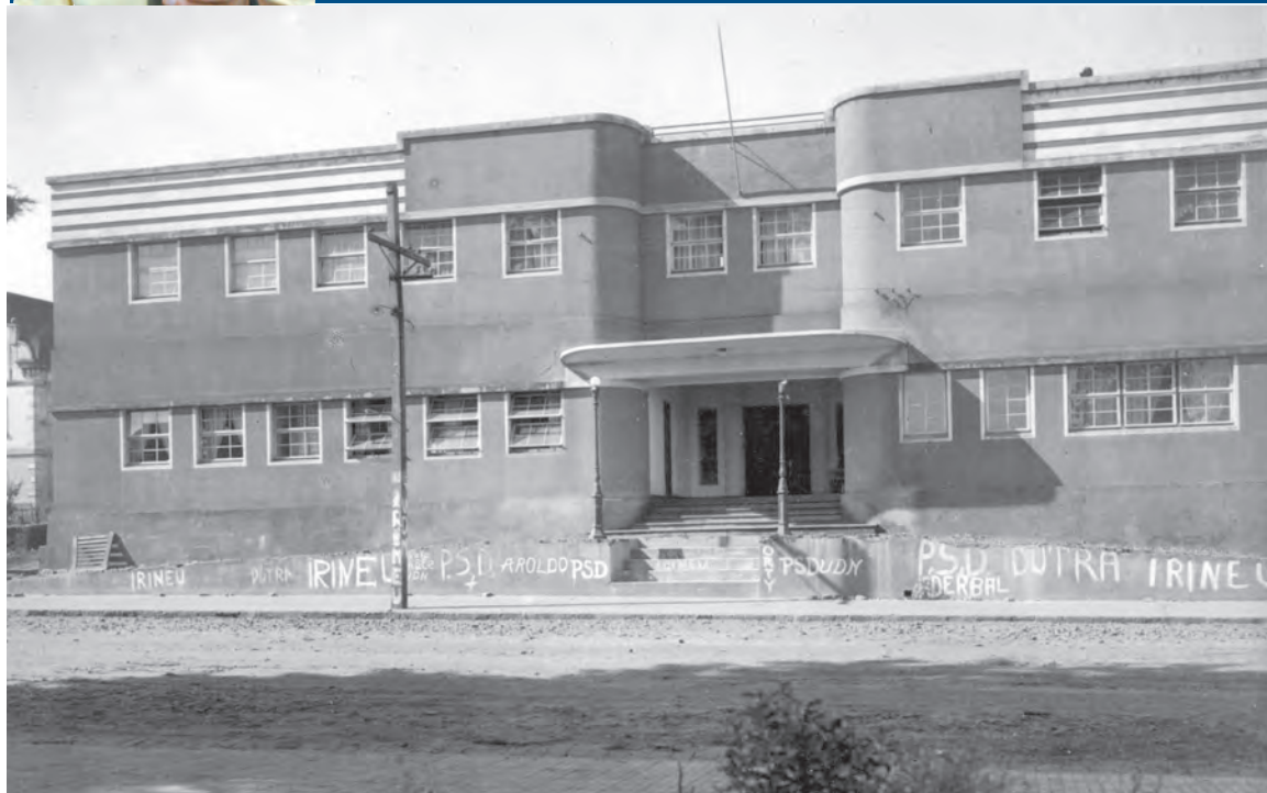
Pichações no Clube Canoinhense antevendo as eleições estaduais ocorridas aos 19 de janeiro de 1947.