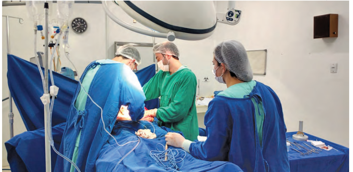
Rins, fígado e córneas foram doados em procedimento que teve assessoria de equipe de Florianópolis

Esta é a terceira captação de órgãos realizada no Hospital Santa Cruz no ano de 2018. Em setembro, a entidade realizará a 2ª Pedalada “Sou Doador”, que visa conscientizar para a importância de ser doador de órgãos e salvar vidas.