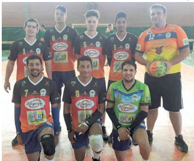
TVC Sparta fez dez sets seguidos na competição

A equipe soma, com esta competição, mais experiência em campeonatos e mostra-se disposta a disputar ponto a ponto com equipes com maior bagagem. “Vemos que estamos