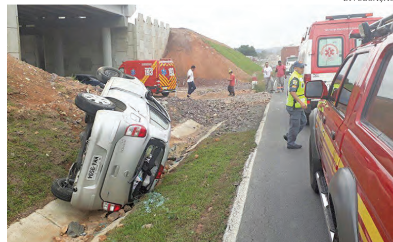
204 pessoas morreram em acidentes nas rodovias federais de SC nos seis primeiros meses de 2018

Apesar desta alta, número de acidentes caiu 13,3% em relação a 2017