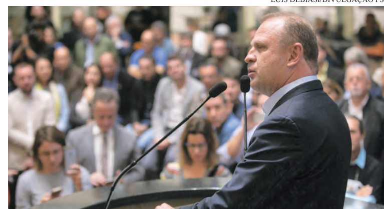
Candidatura de Merisio já tem apoio de dez partidos

Na sexta-feira, 20, a REDE Sustentabilidade realizou sua convenção na sede do Partido