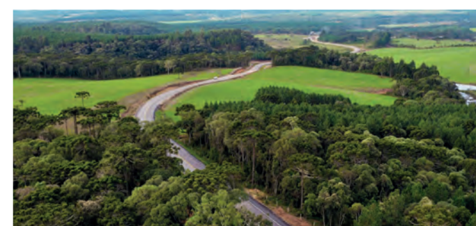
PAVIMENTAÇÃO DA SC-477, ENTRE PAPANDUVA E DR. PEDRINHO NORTE

Acompanhe todas as obras em: 178obras.com.br