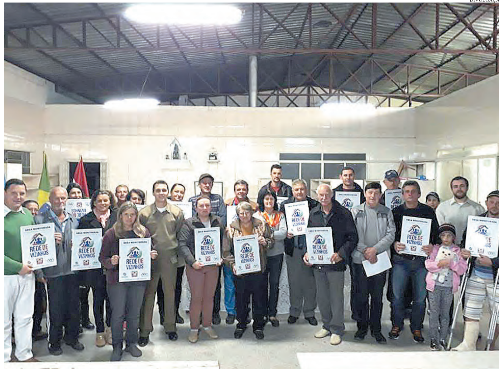
Implementação da Primeira Célula da Rede de Vizinhos em Canoinhas ocorreu na região do Conseg Noroeste

O 3º Batalhão de Polícia Militar (BPM) iniciou os trabalhos da Rede de Vizinhos e implementou a primeira célula (como os grupos de WhatsApp são chamados)