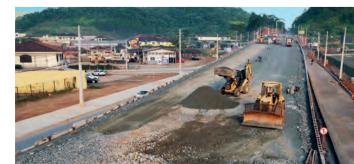
DUPLICAÇÃO DA AV. SANTOS DUMONT, EM JOINVILLE NORTE