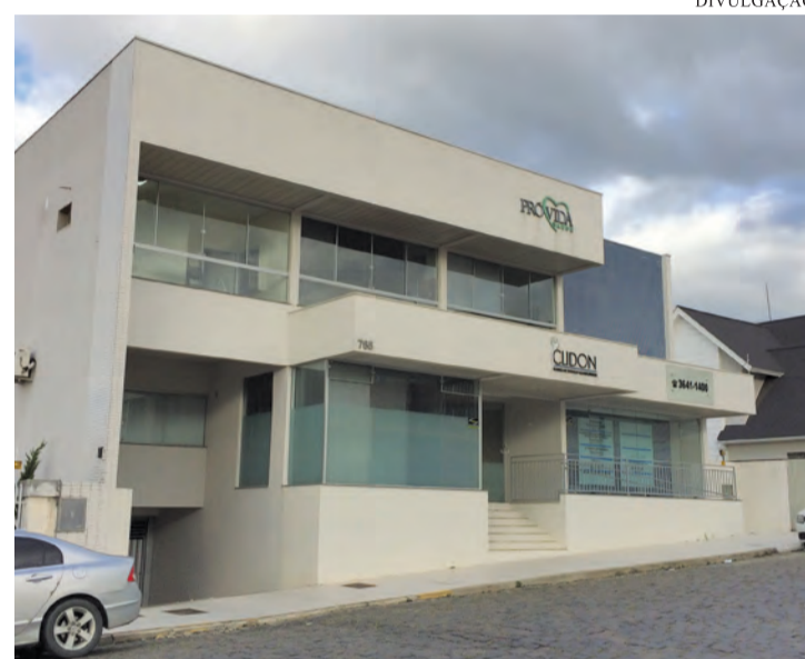
A clínica ainda está em fase de mudanças e irão implantar placas na fachada

O Núcleo de Oncologia Catarinense oferece tratamento oncológico com cirurgias abertas e videolaparoscópicas, tratamento do câncer de mama e reconstrução oncoplástica da mama e quimioterapia. Atendem os seguintes convênios: Unimed, SC saúde, GEAP, CASSI, FUSEX, Correios.