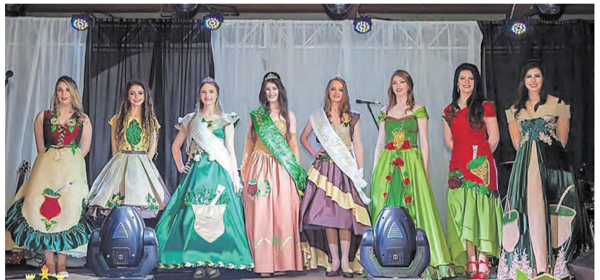
As oito candidatas vestiam trajes típicos