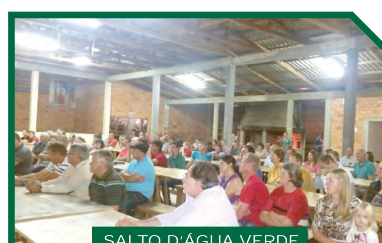
SALTO D'ÁGUA VERDE