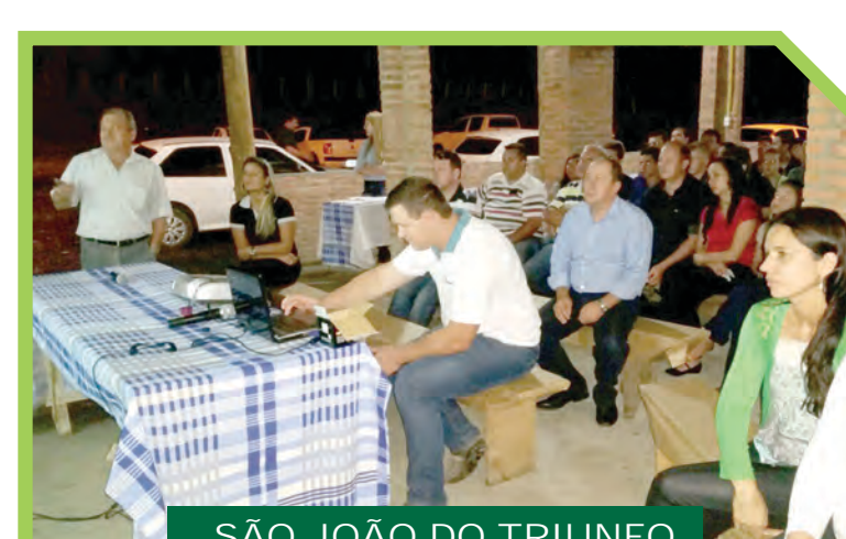
SÃO JOÃO DO TRIUNFO