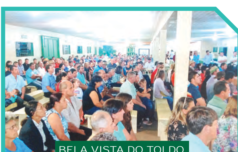
BELA VISTA DO TOLDO