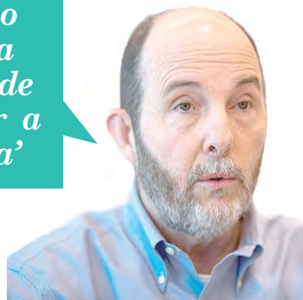
Erminio Fraga, ex-presidente do Banco Central

“Trocar de governo daria a chance de estancar a sangria”