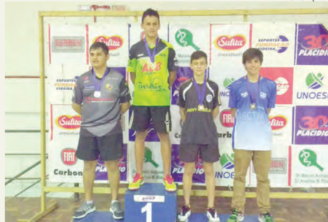
Um dos pódios conquistados pelos tresbarrenses