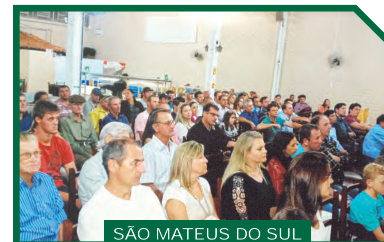
SÃO MATEUS DO SUL