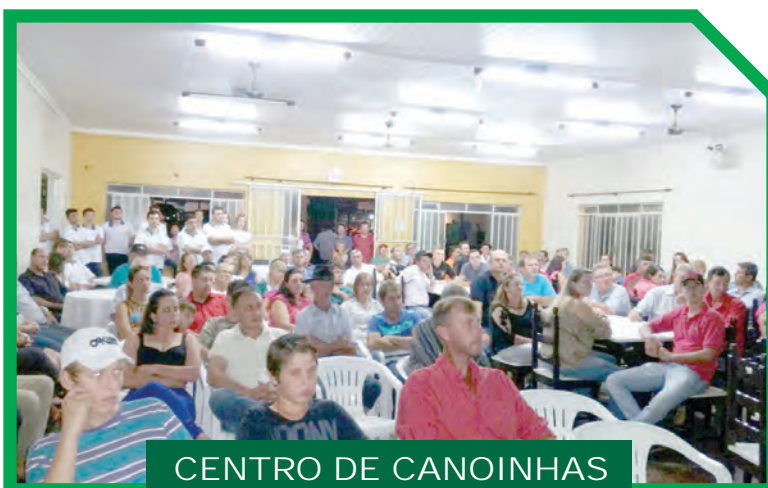
CENTRO DE CANOINHAS