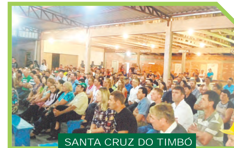
SANTA CRUZ DO TIMBÓ