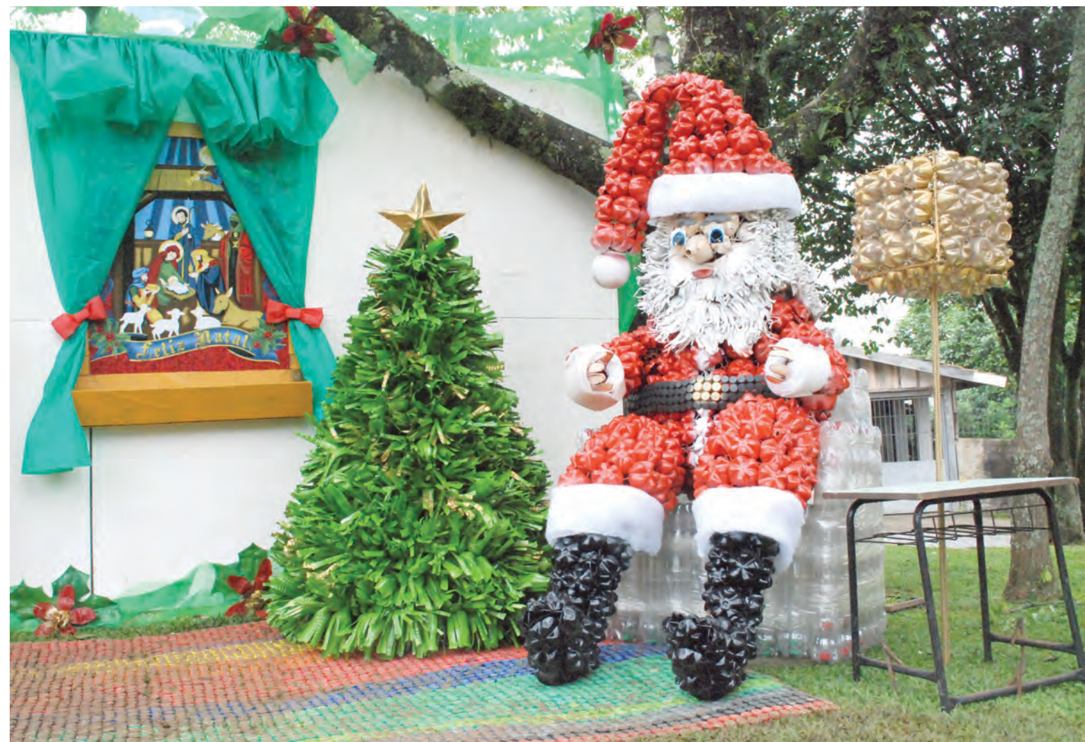
Praça Oswaldo de Oliveira está se transformando no "Sonho de Criança"

Dia 9 acontece o casamento coletivo, apresentações de escolas e a abertura do "Natal Luz". Neste dia o Papai Noel chegará na cidade também e haverá apresentação da Banda Novos Talentos.