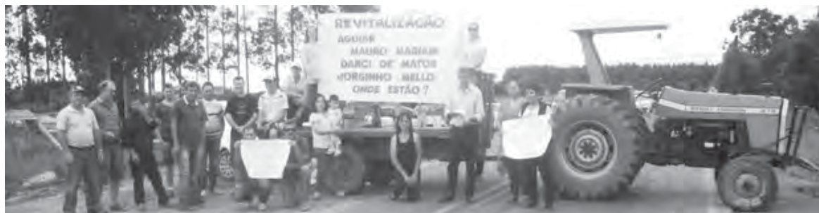
Moradores manifestaram com cartazes e tratores

Este trecho da SC-477 liga as rodovias federais BR-280 e BR-116 – entre Papanduva e Canoinhas. A interdição de uma hora gerou aproximadamente um quilômetro de fila em cada sentido. Alguns moradores carregavam cartazes com frases