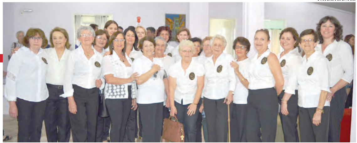
Inaugurou no último sábado, 21, o Lar dos Idosos "Recanto da Colina", administrado pelas senhoras da Pia União de Santo Antônio.