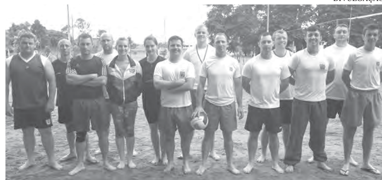
Participantes do torneio de vôlei

Domingo, às 19h, será realizada uma missa de ação de graças na Matriz Cristo Rei que contará com a participação de