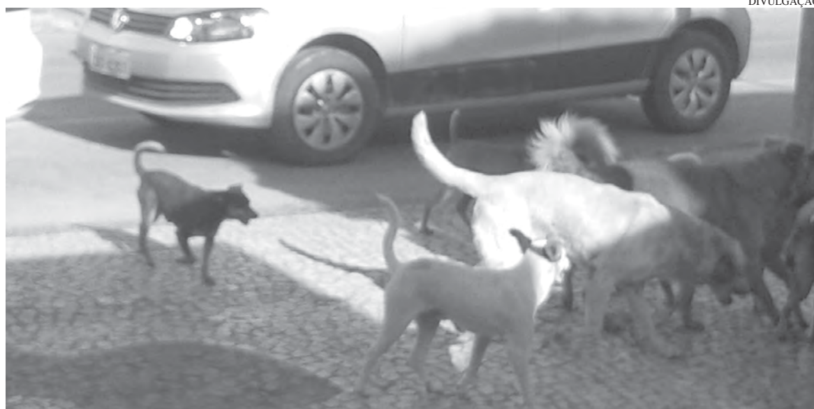
Cachorros circulam pelo centro e atacam pedestres