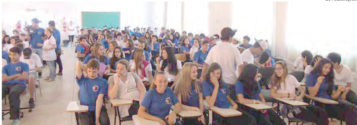
Projeto do CESC garante bolsa a estudantes via CNPq

Unidade oferece várias opções para alunos que cursam o Ensino Médio