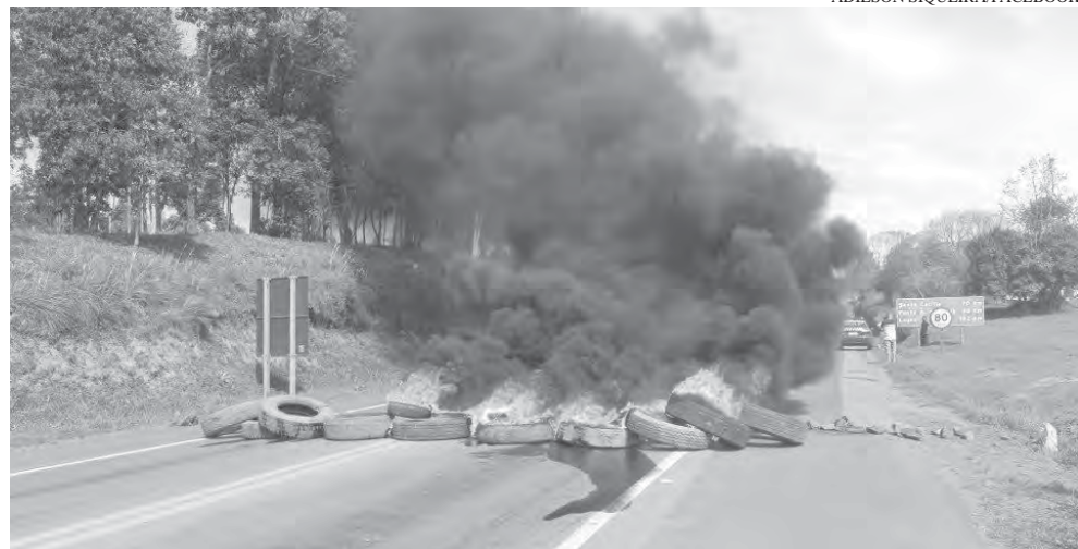
Fechamento da BR-116 foi um dos protestos registrados na região nos últimos dias