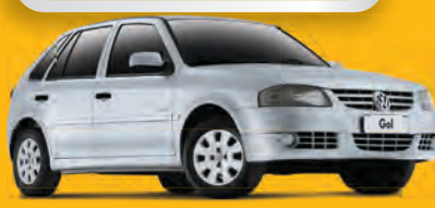
GOL G4 1.0 2012 - BRANCO - AQ+DT+LT

DE R$ 20.990 POR R$ 18.990,00 OU ENTRADA R$ 3.990,00 + 36x 655 | 48x 550 | 60x 484