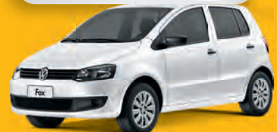
FOX GII 1.0 2013 - COMPLETO

DE R$ 31.900 POR R$ 30.900,00 OU ENTRADA R$ 9.300,00 + 36x 932 | 48x 776 | 60x 683