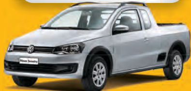
SAVEIRO 1.6 2014 - COMPLETO

DE R$ 33.900 POR R$ 31.900,00 OU ENTRADA R$ 8.000,00 + 36x 1.018 | 48x 845 | 60x 743