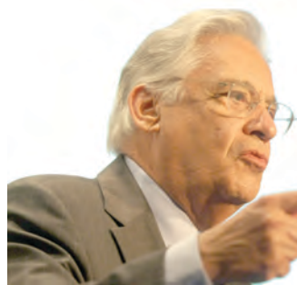
Fernando Henrique Cardoso, ex-presidente da República

“Não é hora de afastar Dilma nem de pactuar”