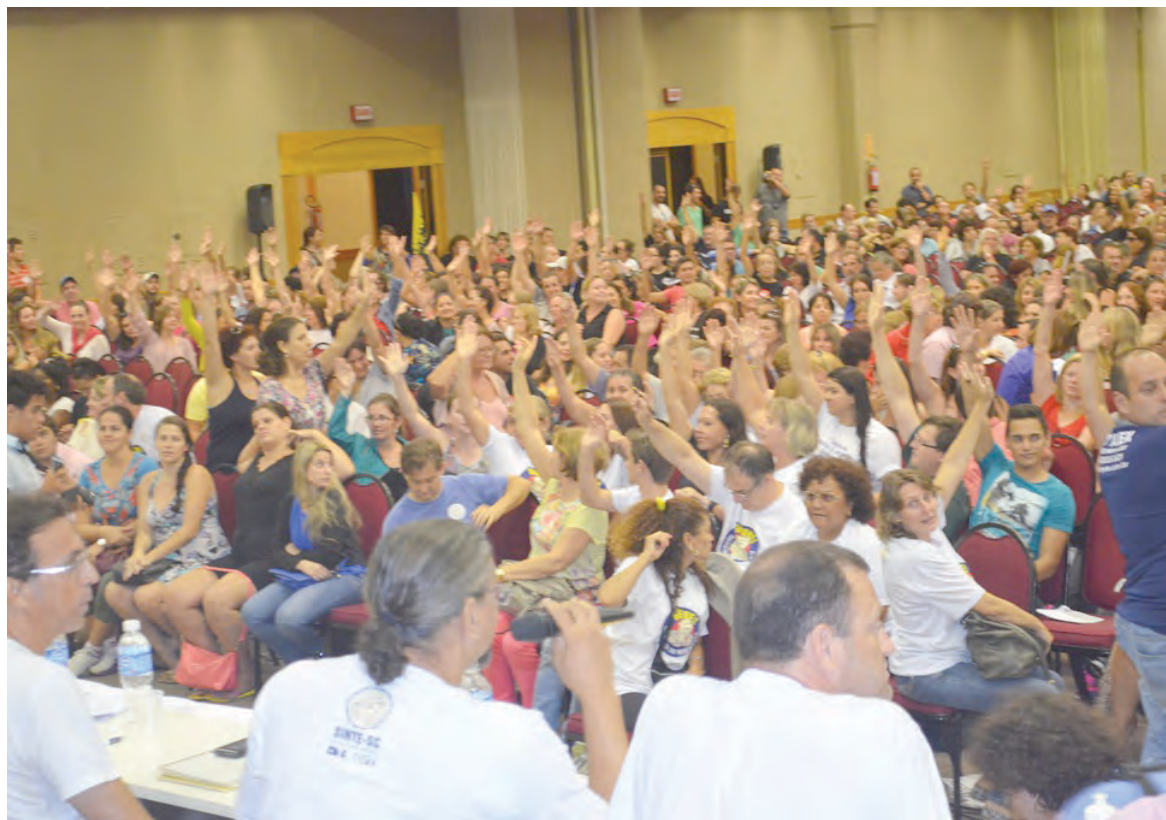
Assembleia estadual do Sinte/SC define 24 de março como início da greve