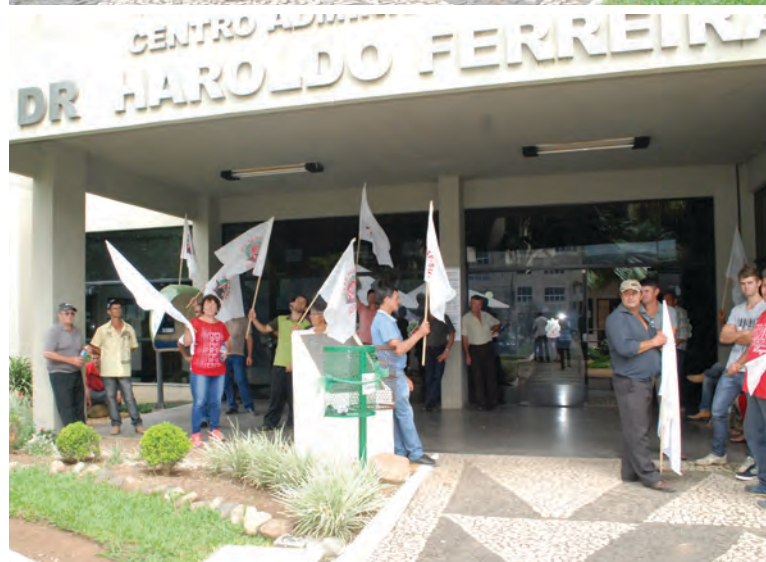
Agricultores pediram melhor preço do fumo e condições de tráfego no interior