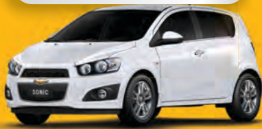
SONIC LTZ 1.6 2013 - PRATA - COMPLETO

DE R$ 44.900 POR R$ 42.500,00 OU ENTRADA R$ 13.500,00 + 36x 1.236 | 48x 1.029 | 60x 906