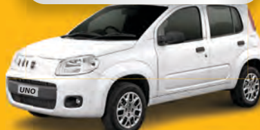
UNO VIVACE 1.0 2014 - PRATA - COMPLETO

DE R$ 32.900 POR R$ 31.500,00 OU ENTRADA R$ 6.500,00 + 36x 1.063 | 48x 882 | 60x 776