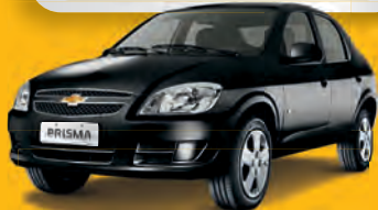
PRISMA 2012 - BRANCO - TRIO ELÉTRICO + AQ

DE R$ 28.990 POR R$ 25.990,00 OU ENTRADA R$ 4.990,00 + 36x 900 | 48x 755 | 60x 665