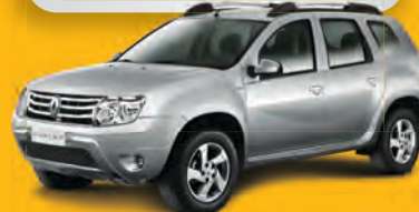
DUSTER 2.0 2014 - VERDE - COMPLETO+4X4+KIT AVE

DE R$ 65.990 POR R$ 59.990,00 OU ENTRADA R$ 24.990,00 + 36x 1.471 | 48x 1.234 | 60x 1.086