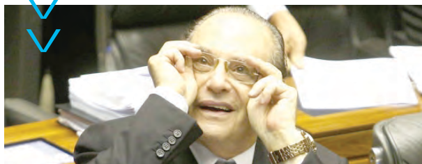
Maluf, sobre a Operação Lava Jato.

“Nesta operação não tenho nada. Sou um homem correto”