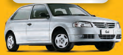
GOL G4 1.0 2009 - BRANCO - AQ+DT+LT+SOM

DE R$ 19.990 POR R$ 16.600,00 OU ENTRADA R$ 3.990,00 + 36x 562 | 48x 473