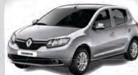
SANDERO DYNAMIQUE 1.6 2015 | AZUL | COMPLETO