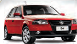
GOL GV 1.6 2009 | VERMELHO | COMPLETO