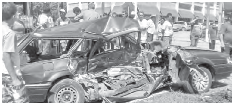
Motorista do Versailles sofreu ferimento no braço direito, rosto e escoriações leves