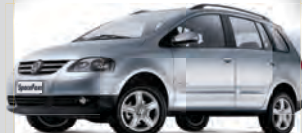
SPACE FOX 1.6 2012 | PRATA | COMPLETO