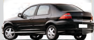
PRISMA MAXX 1.4 VERMELHO | AÇ DESEMBAÇADOR TRAS