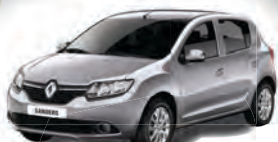
SANDERO ESPRESSION 1.0 AZUL | COMPLETO