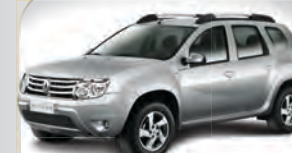
DUSTER 2.0 DYNAMIQUE 2013 | BRANCA | COMPLETO