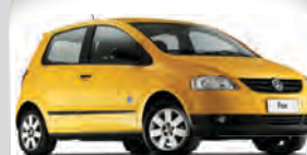
FOX ROUTE 1.0 2008 | VERMELHO DH | LDT