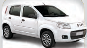
UNO VIVACE 1.4 2013 | PRETO | COMPLETO