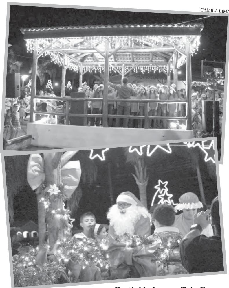
Festividades em Três Barras já começaram

A Casa do Papai Noel está na Praça Emiliano Uba e fica aberta todos os dias, das 8h às 12h, das 13h às 17h e das 19h às 23h. Todos os sábados antecedentes ao Natal haverá também apresentações culturais na Praça a partir das 19h30. O Natal Mágico no município se estenderá até o dia 14 de dezembro.