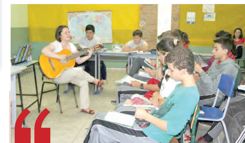
"Posso parabenizar a comunidade de São Pascoal pelo interesse das crianças que são a nova geração. As crianças são muito espertas e inteligentes, muito sábias e têm facilidade linguística, então eu tenho esperança que este projeto trará bons frutos, não somente para a comunidade de São Pascoal, mas para Irineópolis como um todo."

Muito satisfeita com a oportunidade de ensinar sobre a língua e cultura de seu país, a professora parabeniza Irineópolis. "O município me surpreendeu positivamente. O interesse da administração de Irineópolis em chamar uma professora de polonês é louvável. Está sendo uma experiência incrível e espero que renda bons frutos", finaliza.