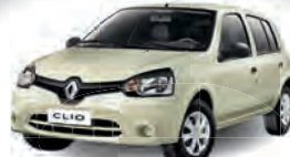
CLIO EXPRESSION 1.0 2014 | PRATA | COMPLETO