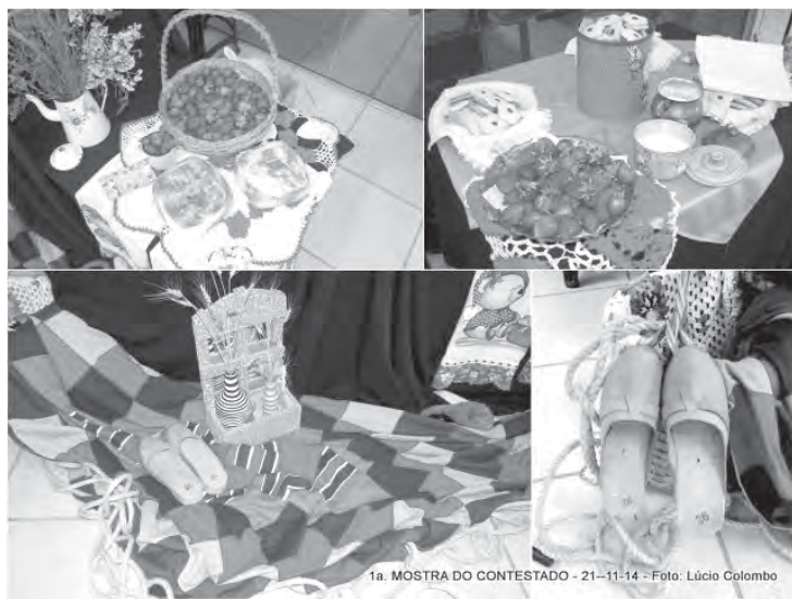
1a. MOSTRA DO CONTESTADO - 21-11-14