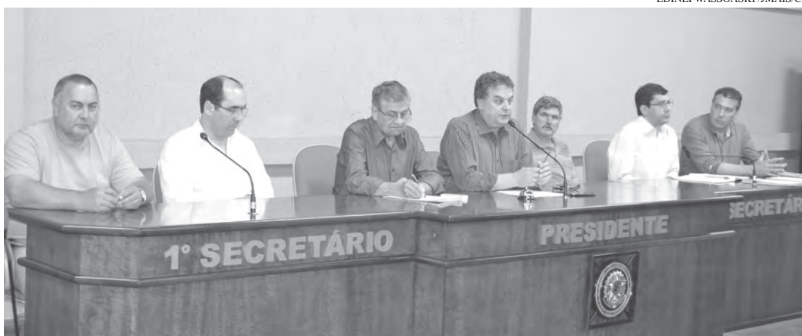
Momento da audiência pública realizada na quarta-feira, 26, na Câmara de Canoinhas