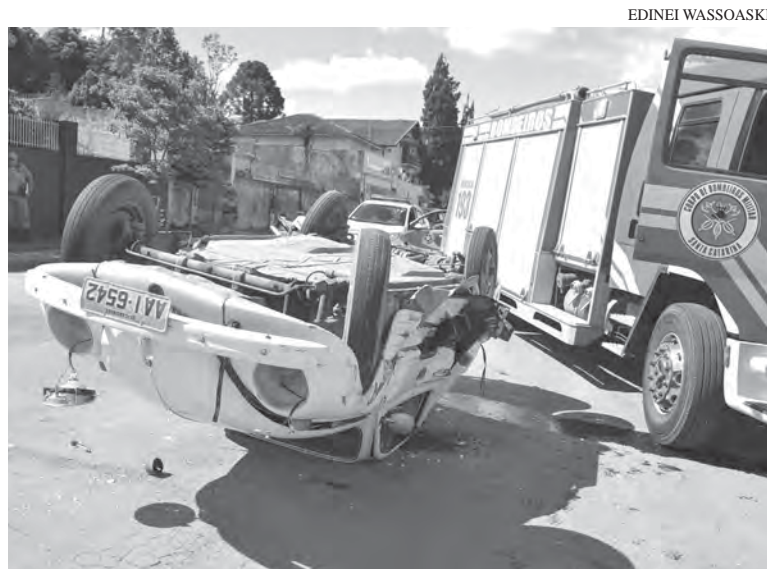
Com o impacto, o Fusca rodou na pista e capotou

Moradores relataram que as colisões na esquina são frequentes por causa da alta velocidade com que motoristas descem a rua Emílio Scholtz vindo da rotatória em frente ao Cemitério Municipal. Uma rotatória ou lombada já foram solicitadas à Câmara de Vereadores.