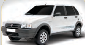
UNO MILLE ECONOMY 2013 | AZUL | DH | LDT | 2P