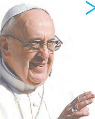
Papa Francisco, sobre os casos de pedofilia de 3 padres e do professor de religião presos sob acusação de abuso sexual de menores, em Granada

“A verdade é a verdade. Não podemos escondê-la”