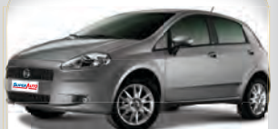
PUNTO ATTRACTIVE 1.4 2013 | VERMELHO | COMPLETO