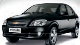
PRISMA 1.4 2012 | PRATA | AC