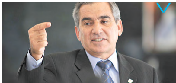
Ministro da Secretaria Geral da Presidência da República, Gilberto Carvalho, sobre Dilma Rousseff.

“Essa mulher luta contra a corrupção dia e noite e gosta dos pobres”