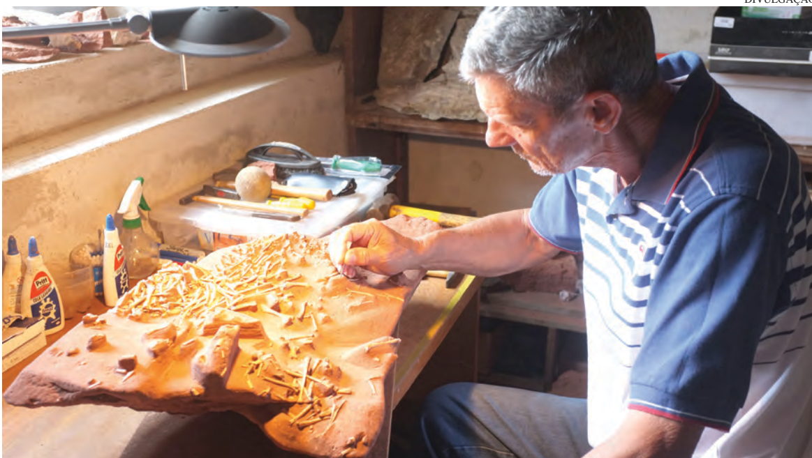
Preparação de bloco com dezenas de ossos do pterossauro

Os pesquisadores já coletaram cerca de cinco toneladas de material. Cada coleta dura de uma a duas semanas, mas o trabalho em laboratório para preparar o material chega a oito meses.