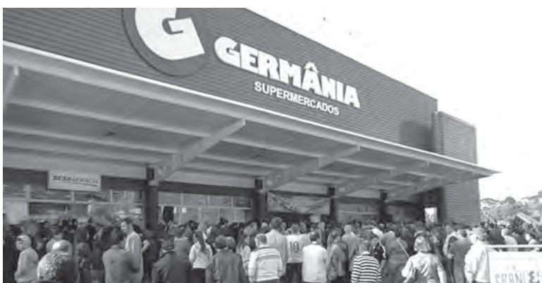
Empresa inicia processo de instalação em Mafra