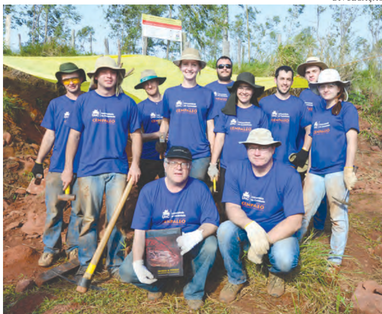
Equipe do Cenpaleo no local de escavação