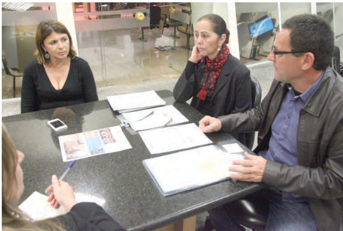
Comissão responsável pela pesquisa realizada pela Escola do Legislativo

Dos 295 municípios catarinenses, 96 foram visitados pelo censo. “A captação dos dados feita de forma presencial foi a forma que encontramos de não deixar nenhum município fora da pesquisa. Muitos, principalmente os menores, não têm computador ou utilizam os