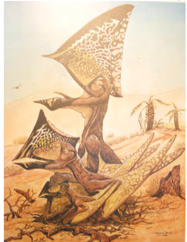
Reconstituição paleoartística do Caiuajara

Geólogo paranaense, Manzig viu no material as características do arenito encontrado no Deserto