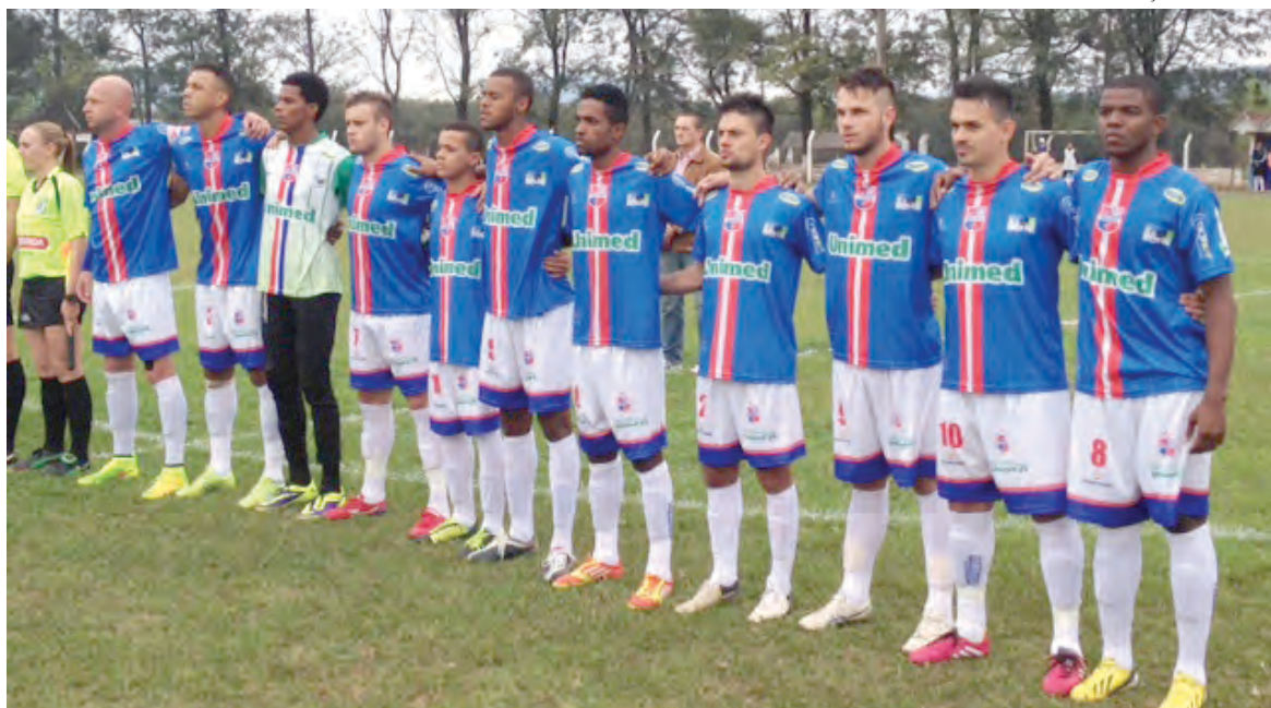
Equipe da Caçadoreense abriu o placar pela 6ª rodada da Série B do Estadual