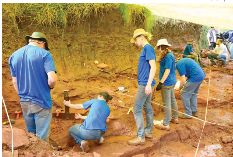
Equipe em campo para coleta de fósseis