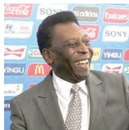
Após recusar sorteio, Pelé fez breve discurso na abertura do evento

“Tenho certeza de que o Brasil vai ganhar”