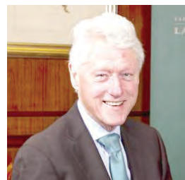
Ex-presidente americano, Bill Clinton, criticou o rastreamento das comunicações da Petrobrás

“Não deveríamos levantar informação econômica sob o pretexto de segurança”