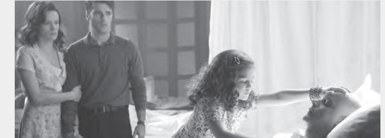
Os capítulos dos dias 19 e 20/12 não foram divulgados pela emissora.

Marinalva anuncia que patrocinará o projeto de beleza de Sofia. Anita, Giovana e todos pedem que Monique pense na proposta de fazer parte da turma. Bernardete pensa em voltar a estudar. Raíssa tenta convencer Vera a compreender Anita. Os professores decidem armar um almoço comunitário de fim de ano na escola. Marinalva apresenta Sofia para a imprensa. Sofia não menciona o apoio de Flávia e Serguei a seu projeto nas entrevistas. Pedro alerta Sofia sobre sua vaidade. Sidney ajuda Ben a se encontrar com Anita.