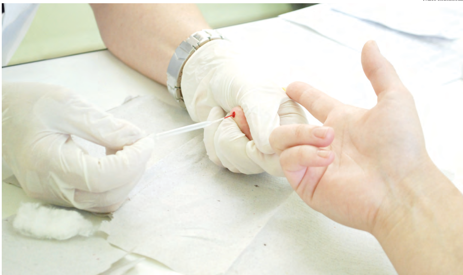
Para o teste rápido, são necessárias duas gotas de sangue, coletadas a partir de uma picada no dedo