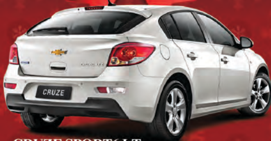
CRUZE SPORT6 LT