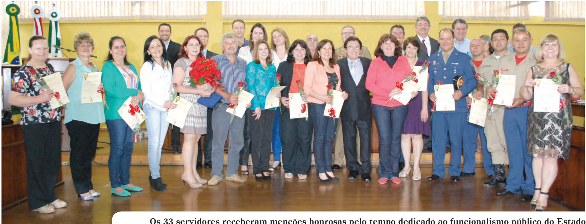
Os 33 servidores receberam menções honrosas pelo tempo dedicado ao funcionalismo público do Estado