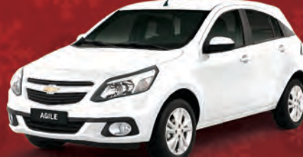
NOVO AGILE 2014