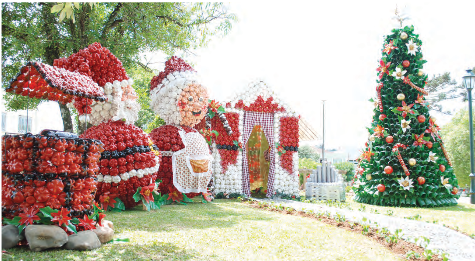
Enfeites totalmente produzidos pelos pacientes do Caps já chamam a atenção de quem passa pelos locais decorados

Inspirado no evento que acontece anualmente em Gramado-RS, o Desfile quer surpreender o público e fazer com que as pessoas usem a imaginação. O Desfile é uma parceria da Secretaria de Educação com a AABB Comunidade, Clubes de Mães e Universidade do Conestado.