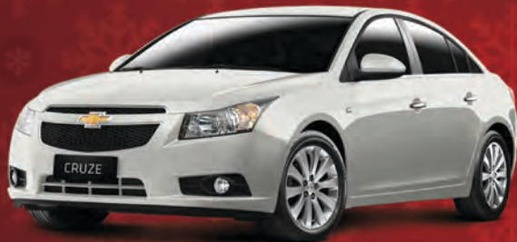
CRUZE SEDAN LT 1.8 2014

144 cv + Câmbio Automático Bancos em Couro + Aro 17