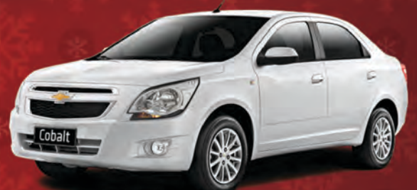
COBALT LTZ 1.4 106 CV 2014

Completaço! AirBag + ABS Central Multimídia - Touch Screen