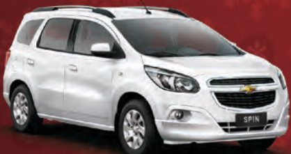
SPIN LT 5 LUGARES 2014

Completaço + ABS + AIRBAG + SOM MP3 Câmbio Manual + Pacote R9X