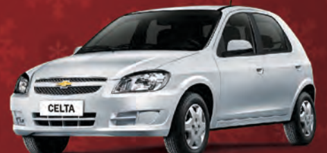
CELTA LT 1.0 78CV 2014

COMPLETO! Direção Hidráulica Alarme + Travas + Vidros Elétricos Diant. + Ar Quente + Jogo Tapete + Flex