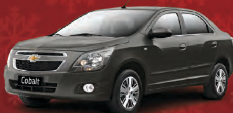
COBALT LTZ 1.8 2014

Completaço! Automático + AirBag + ABS Central Multimídia - Touch Screen