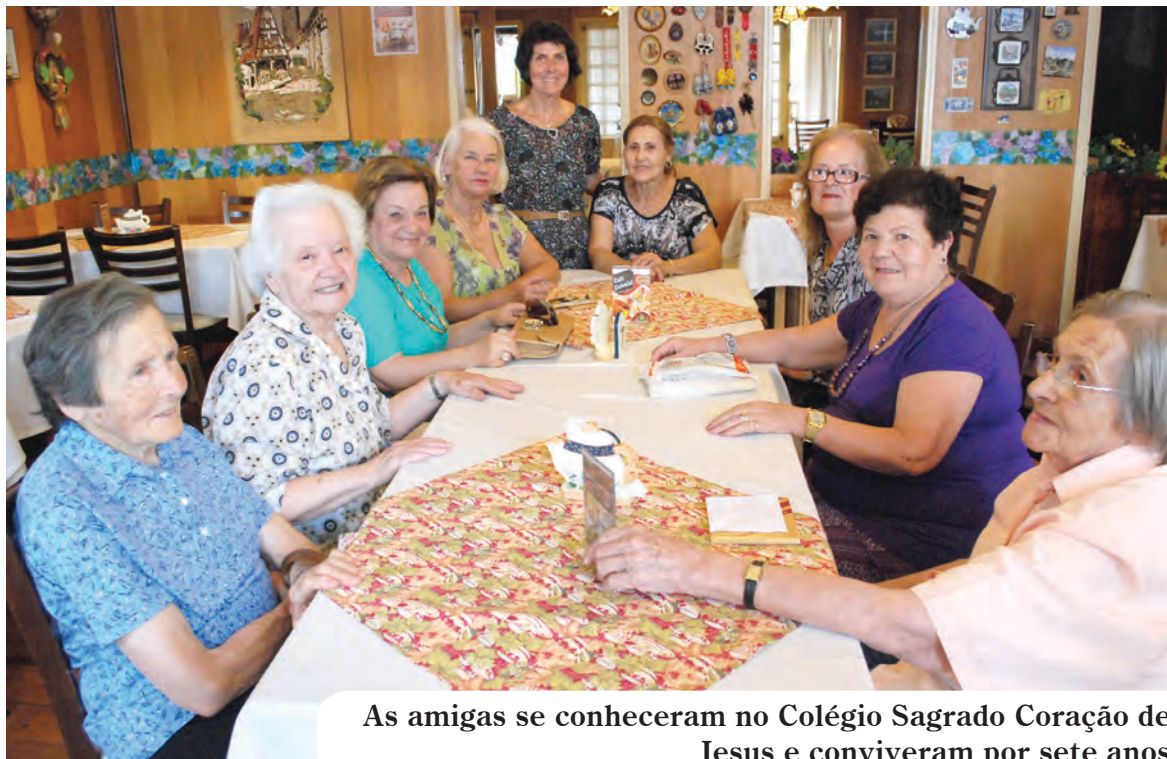
As amigas se conheceram no Colégio Sagrado Coração de Jesus e conviveram por sete anos