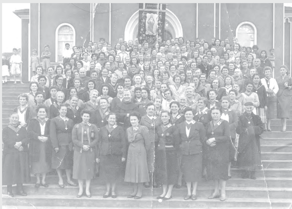
Nos anos 1950, nas escadarias da igreja matriz de Canoinhas, integrantes do Apostolado da Oração.