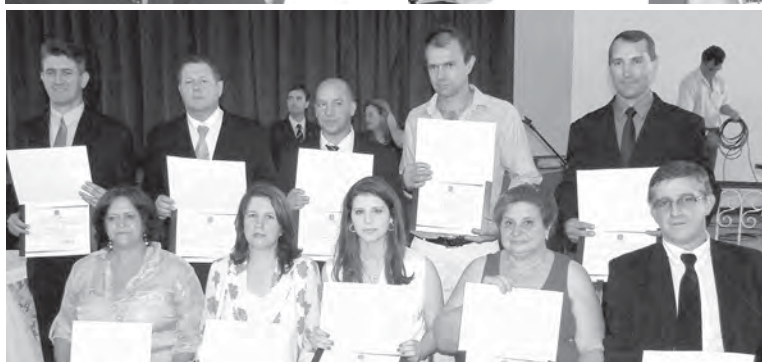
Também diplomados pela Justiça Eleitoral, os nove vereadores (foto) eleitos no pleito de 2012