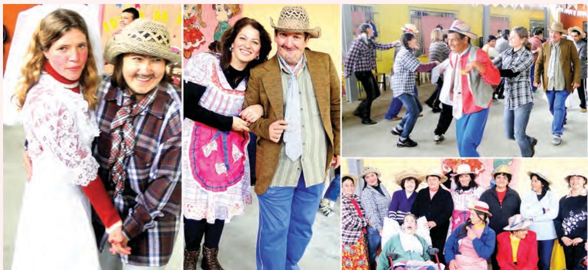
A direção e professores da APAE de Irineópolis, promoveram nos dias 27 e 28 de junho, a sua tradicional festa junina, com muita animação e alegria. Além da apresentação da quadrilha e do casamento caipira, foram distribuídos, doces, refrigerantes, pipoca e pé-de-moleque. A festa caipira foi animada pela Banda do CRAS e contou com a participação do Clube de Mães.