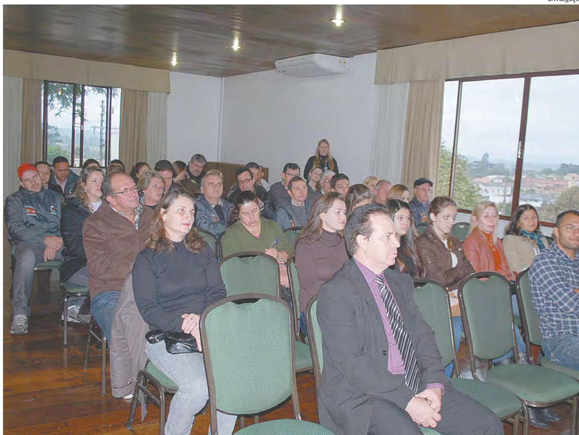
Mais de 55 servidores estaduais participaram do encontro motivacional