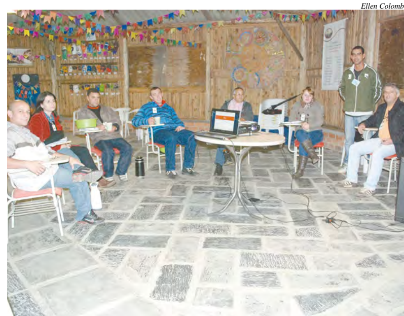
Equipe técnica de funcionários da Atena em reunião

O programa de tratamento consiste em quatro fases. Sendo elas: 1ª Fase – Centro de acolhimento e triagem, na qual o candidato passa por um processo de aceitação do programa e orientação aos familiares, bem como avaliação clínica. 2ª Fase – Comunidade Terapêutica (Unidade Rural), programa de recuperação de no mínimo quatro meses. Na comunidade o residente possui atividades rotineiras que procuram desenvolver o indivíduo em sua totalidade, corpo, mente, espírito em uma perspectiva psicossocial. 3ª Fase – Atividade de Reinserção (Unidade Urbana) – Programa de Reinserção social de no mínimo dois meses na qual o residente possui atividades que buscam capacitá-lo para sentir-se seguro em seu retorno a vida cotidiana. 4ª Fase – Programa de Pós Residente – Durante um ano, após