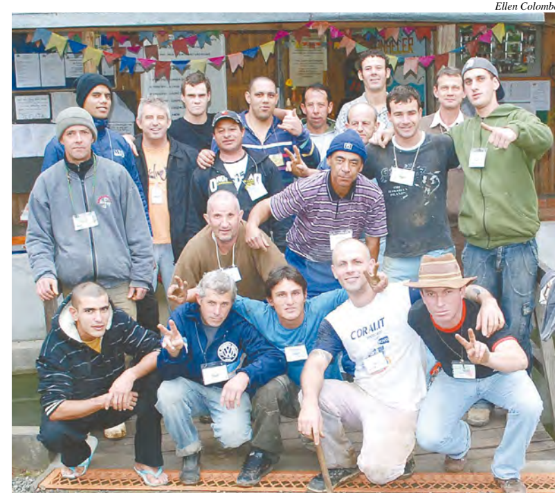
Residentes em tratamento posam para foto na unidade rural