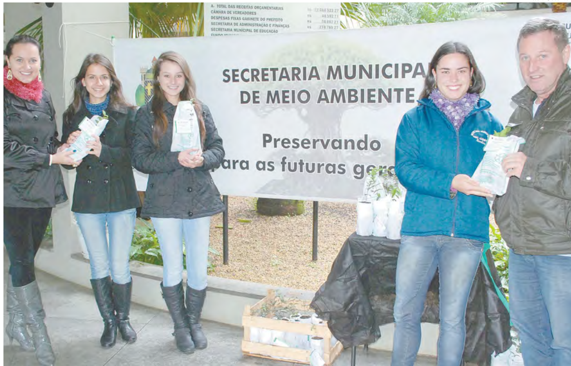
Mudas doadas foram produzidas no horto florestal da prefeitura