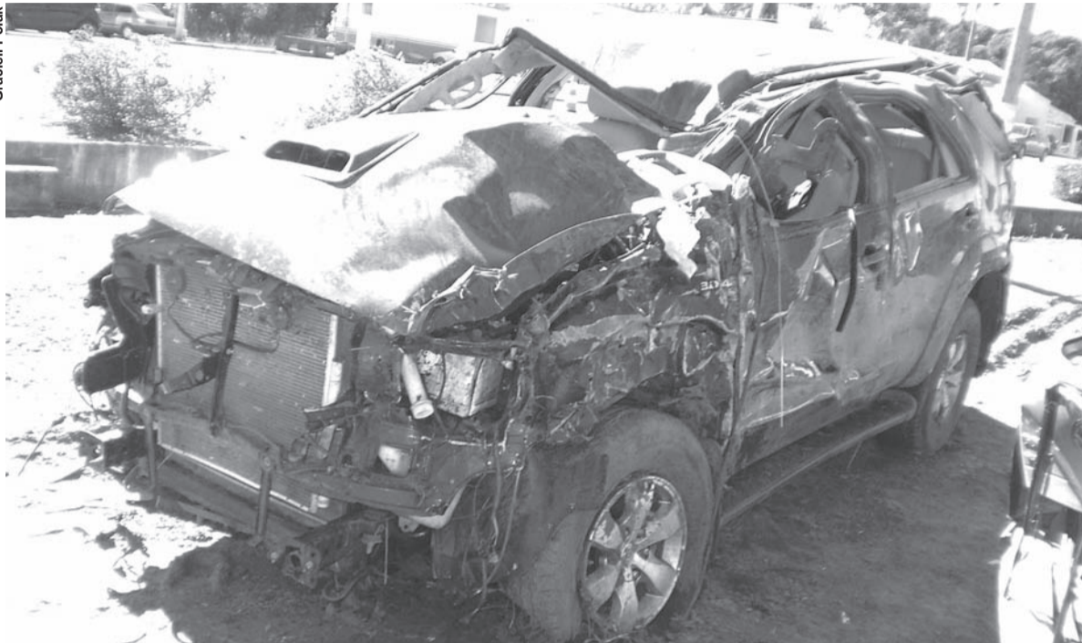
TOYOTA Hilux estaria sendo conduzida por um empresário canoinhense que saiu do local antes da chegada da Polícia

Toyota Hilux invadiu pista contrária e bateu de frente contra motocicleta