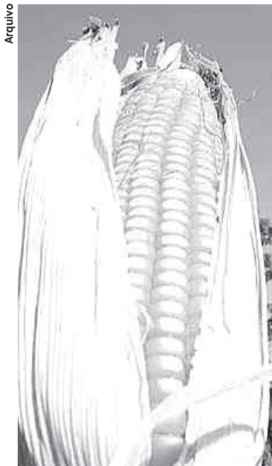
MESMO com recorde, há déficit

No entanto, Santa Catarina ainda apresentará déficit na produção, com importação do grão maior do que a do ano anterior. A ocorrência de fenômenos climáticos, como o La Nina, fez com que a produtividade fosse menor em relação à safra anterior, mas como a área plantada foi maior do que no ano passado, a quantidade importada de