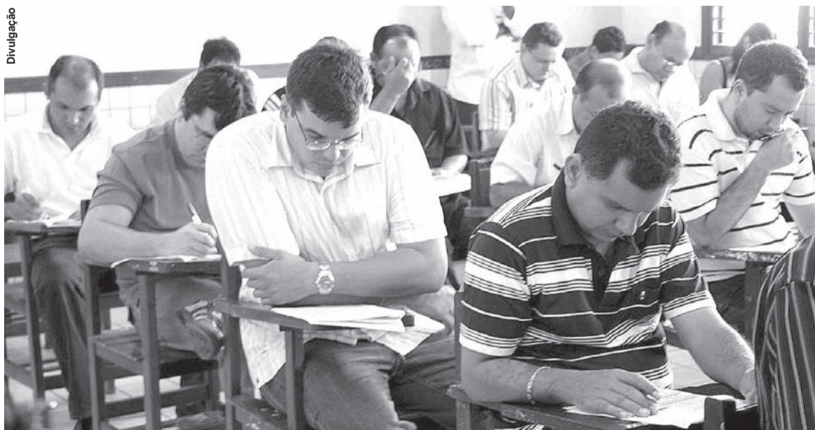
CONCURSO para vagas de analista censitário, com salário de R$ 4 mil mensais, será lançado na próxima semana

Na próxima semana está prevista a liberação de edital para o concurso de nível superior, que disponibilizará vagas de analista censitário para pessoas com graduação em 18 diferentes áreas de conhecimento, com remuneração de R$ 4 mil mensais por 40 horas semanais.