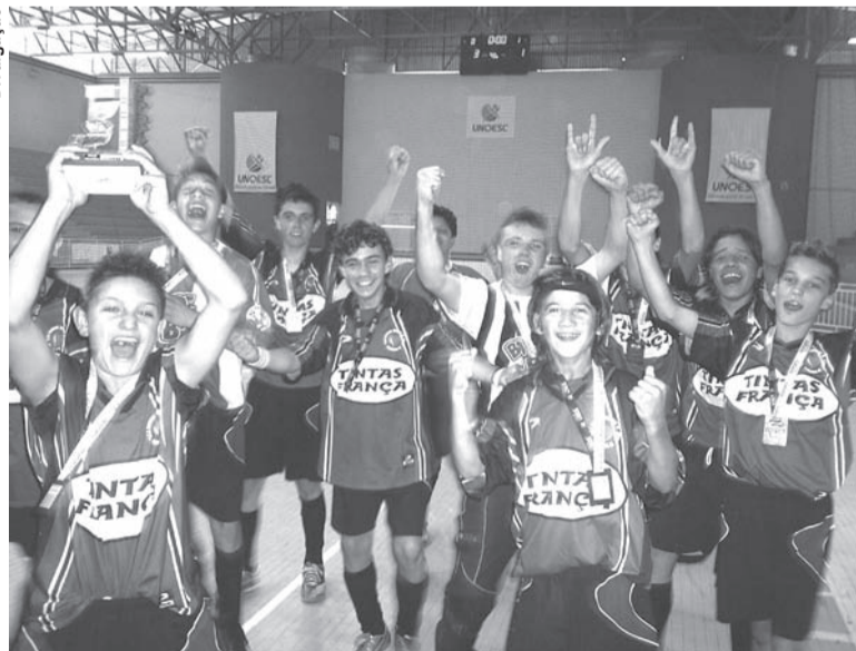
EQUIPE de Futsal do Sagrado comemora terceiro lugar nos JESC em Joaçaba

Sagrado 5 X 3 Lindóia do Sul Sagrado 7 X 3 Irani Sagrado 2 X 2 Lages Sagrado 0 X 1 Luzerna Sagrado 0 X 2 Caçador Sagrado 3 X 1 Luzerna (terceiro lugar)