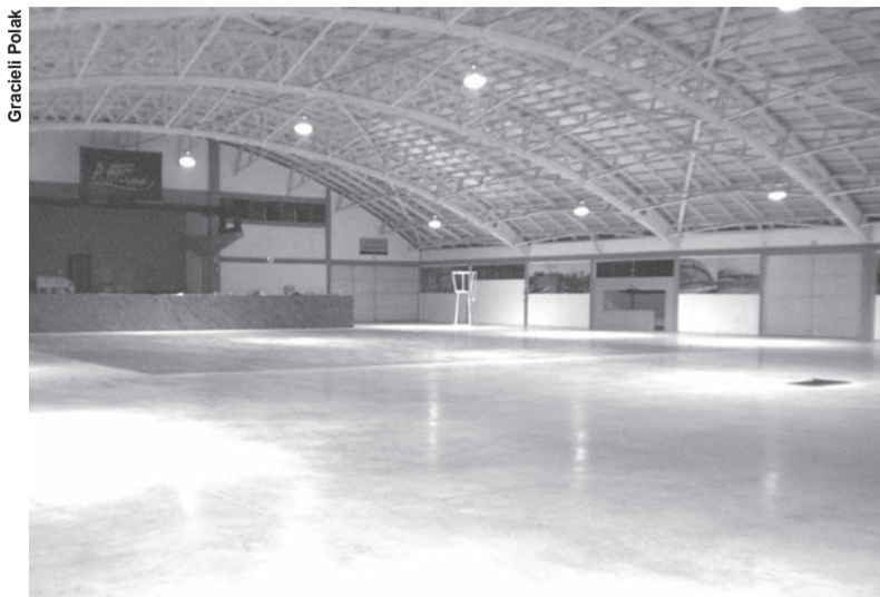
CENTRO de Eventos tem capacidade para receber mais de 6 mil pessoas