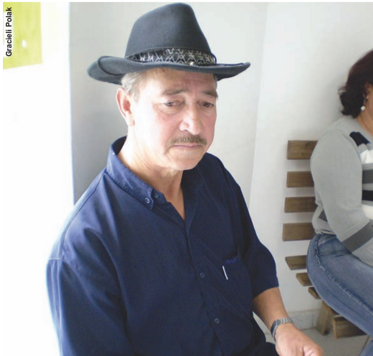
BUENO tem dificuldade para ir do bairro Aparecida até a Policlínica

Ela explica que, como não havia nenhum imóvel no centro com a estrutura necessária que a