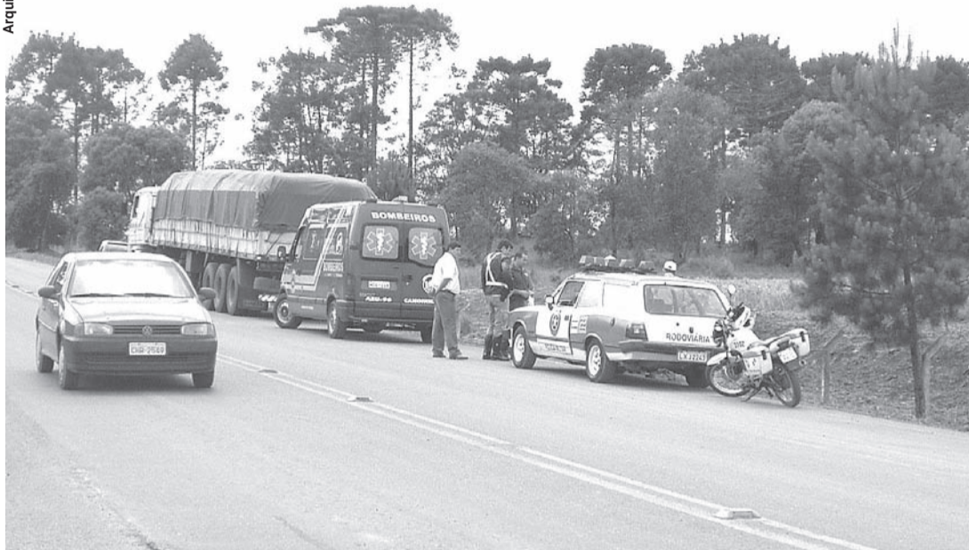
BLITZE somente de rotina; por enquanto a Polícia Militar não deve fazer operações especiais para Lei Seca