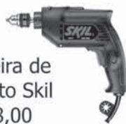
Furadeira de impacto Skil R$ 68,00