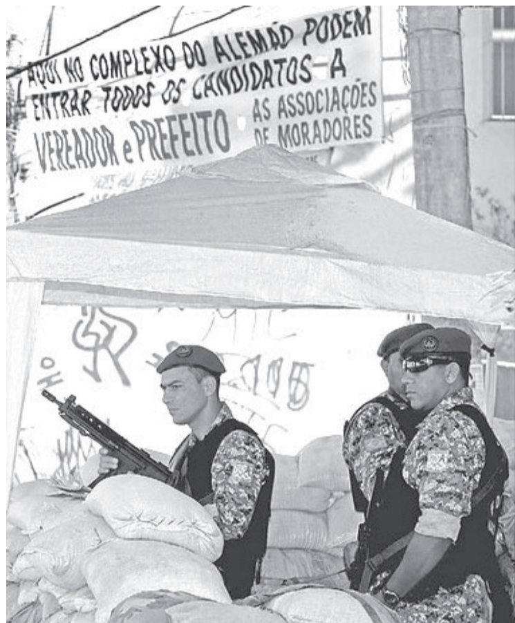
Wilton Junior/O Estado de S.Paulo-29/07/08

PERMITIDO: Agentes da Força Nacional montam guarda em favela do Rio de Janeiro onde no fim de semana, jornalistas foram intimidados durante cobertura da visita do candidato a prefeito, Marcelo Crivella (PRB)