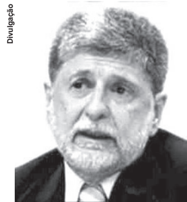
MINISTRO Celso Amorim representou o Brasil na Rodada Doha

Uma das diferenças foi a pressão dos Estados Unidos para encorajar as nações em desenvolvimento a tomar parte em acordos voluntários