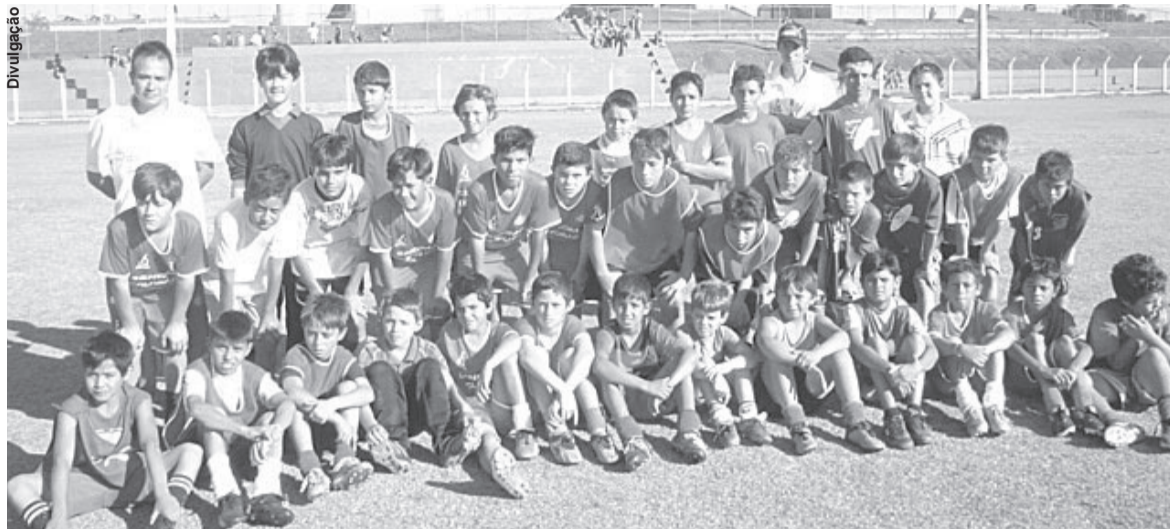
GRUPO de alunos da escolinha Genoma Colorado de Três Barras, está confiante na vitória nos jogos de amanhã

Escolinha tresbarrense joga pelas categorias Mirim, Infantil e Juvenil