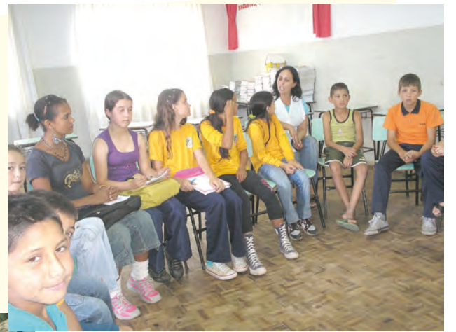
Equipe Barra Mansa

Dando continuidade ao trabalho de formação das Comissões Internas de Preservação Ambiental (CIPAs), foi montado outro grupo na Escola Básica Municipal Barra Mansa, de Canoinhas, onde foi formada pela primeira vez uma equipe de preservação ambiental, apoiada pelo projeto Educação no Campo, parceiro do PACA. Os alunos visitam a empresa Rigesa e fazem um treinamento voltado para a formação de lideranças. Além do grupo de Barra Mansa, a CIPA de Rio d'Areia do Meio, também participa do treinamento na sede da empresa.