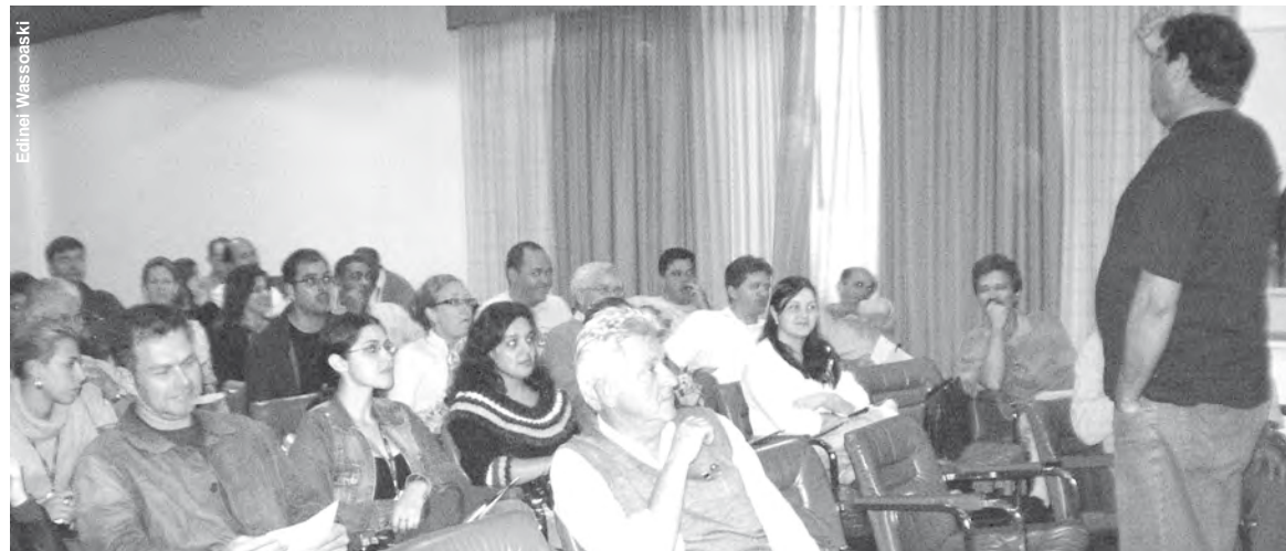
EVENTO reuniu inspetores, funcionários e conselheiros das inspetorias de Canoinhas e outras seis cidades da região

Encontro reuniu engenheiros de toda a região