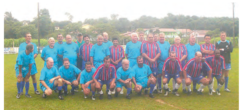
BOTAFOGO (camisa listrada) e AVAL: disputa foi bastante acirrada