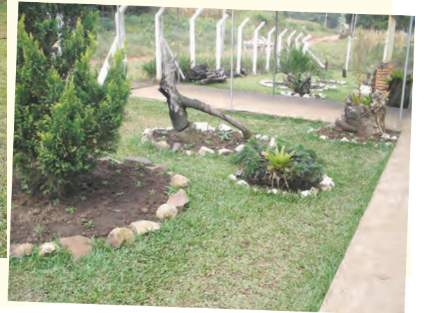
Embelezamento do jardim da escola

Pomar da escola, onde os alunos aprendem a cultivar; a idéia é incentivar o mesmo trabalho em suas casas, já que a atividade agrícola é comum na localidade