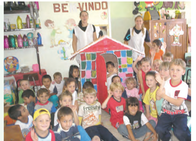
Montagem de uma casa com material reciclado

Os alunos do pré-escolar da E.B.M. Maria Isabel, de Canoinhas, usaram diversas caixas vazias de leite para montar uma mini-casa. A intenção é mostrar que produtos que geralmente são jogados no meio ambiente podem proporcionar a conscientização da reciclagem de um modo divertido.