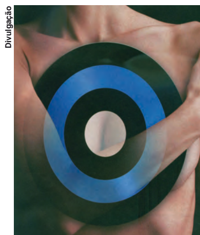
ALERTA: mais de 5 mil mortos por ano

No ano passado, o câncer matou menos do que em 2006, embora a Secretaria de Estado da Saúde possa revisar os dados de mortes de 2007, com atualizações. O envelhecimento da população e a melhor qualidade do diagnóstico são as alegações clássicas para justificar o aumento da mortalidade. A dificuldade de oferecer tratamento de qualidade para todos é uma possibilidade que autoridades de saúde