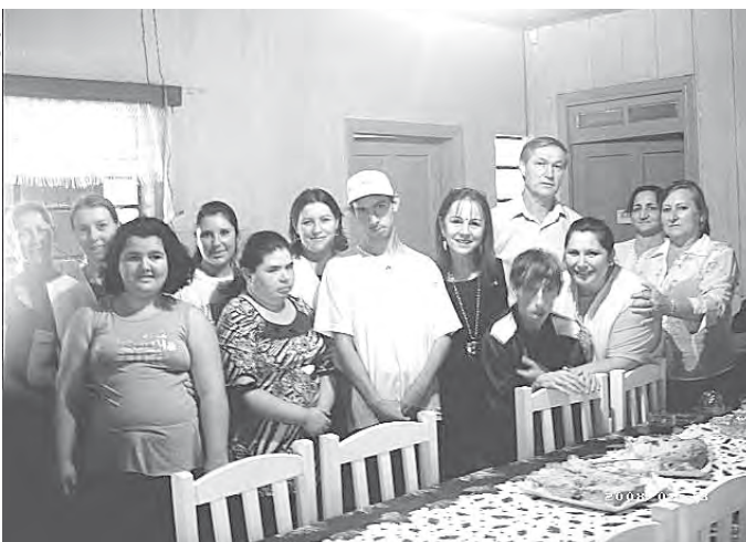
HÁ DEZ ANOS trabalho começou com uma Sala Alternativa; somente em abril de 2007 aconteceu a fundação da Apae

Toldo para o dia 19 de abril de 2007. Nesse mesmo dia foi eleita e empossada a diretoria da Apae. Diretoria esta, que nunca mediu esforços para abrir caminhos para as conquistas que obtivemos.