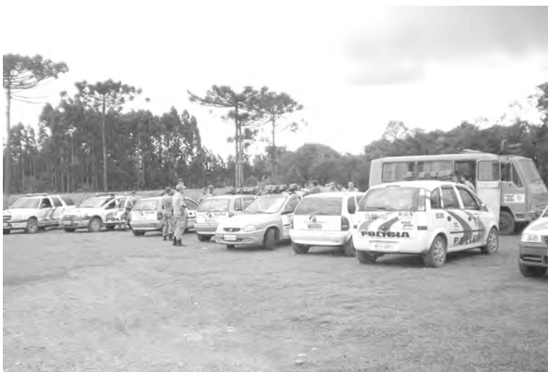
AÇÃO que levou a prisão de quatro suspeitos mobilizou policiais da região

No próximo passo do processo serão ouvidas diversas testemunhas de defesa. A maior parte delas não reside em Canoinhas, o que pode fazer com que a solução do processo demore um pouco mais do que o esperado.