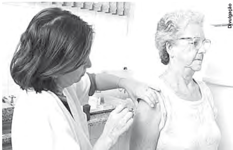
POSTOS DE SAÚDE estarão abertos amanhã em horários especiais