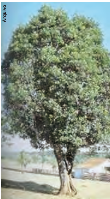
ERVA-MATE: riqueza do passado

Quando questionado sobre o que mais marcou durante esses 50 anos a resposta foi rápida: “O mais importante são as amizades que eu fiz. Amizade se faz e não se compra. Fico feliz por reunir os amigos de 50 anos e os amigos de agora para essa comemoração”, disse o homenageado. “Enquanto deixarem, eu estarei jogando”, completou.