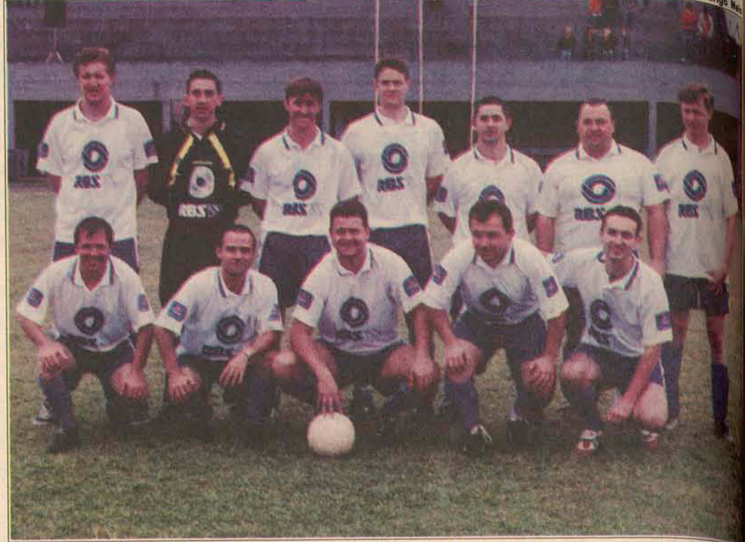
A equipe da RBS TV/Joinville foi surpreendida pelos canoinhenses