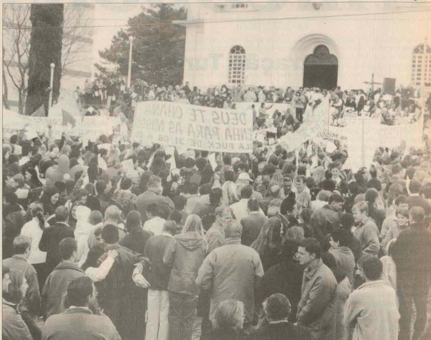
Segundo a Polícia Militar, o público presente ao ato religioso foi de cinco mil pessoas

Nesses dois meses de peregrinação, os missionários visitaram pessoas enfermas, realizaram celebrações com crianças, jovens e adultos, além de prestarem orientações individuais. A expectativa pela vinda dos religiosos, fez com que nos dias de missões, todas as capelas ficassem lotadas de fiéis. A despedida em Canoinhas foi tomada pela emoção, pessoas abanavam com as mãos, balançavam bandeirinhas e outras choravam. Tudo isso, como forma de agradecimento àqueles que souberam entender os problemas de cada cidadão, de cada comunidade e acima de tudo, souberam mostrar os caminhos para as soluções e como consequência a busca da felicidade. Nos próximos dias, os religiosos devem iniciar os trabalhos em Canela, no Rio Grande do Sul. Para o início de 2003, está prevista a vinda deles à São Mateus do Sul, no Paraná.