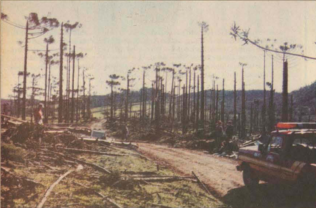
Os fortes ventos levaram as copas dos pinheiros e arrancaram árvores

de dois minutos poder ser comparado a um ciclone. Até o fechamento desta edição, a Defesa Civil não havia finalizado o levantamento dos prejuízos na região. "Nós temos 78 horas a partir de domingo para entregar a Avadan (Avaliação de Danos). Já foi feito o levantamento das famílias que ali residiam e também da quantidade de casas destruídas, mas os prejuízos ainda não foram calculados", frisou.