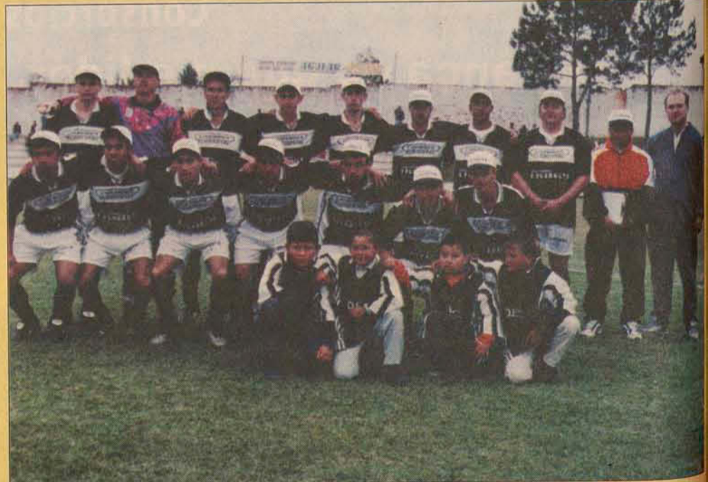
O time do Diplomata venceu por 4 a 0 e é o campeão dos Campeões