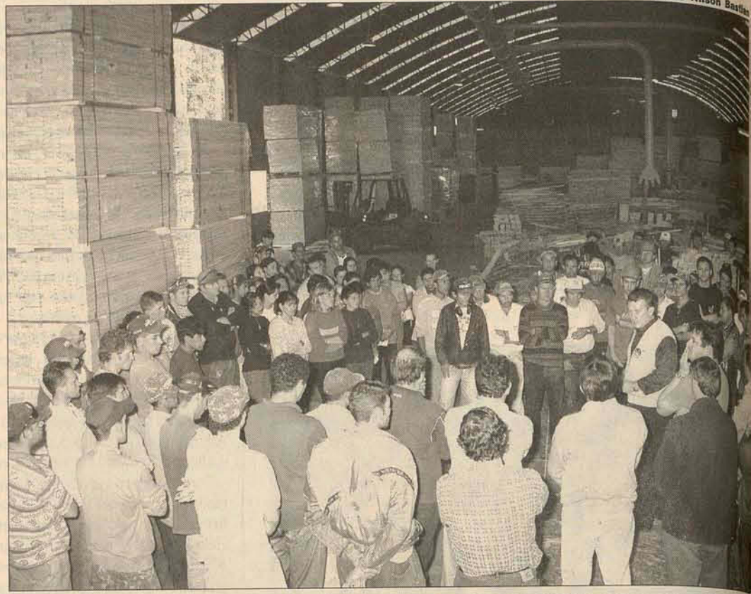
Funcionários da Cisframa acompanharam com atenção do discurso do candidato