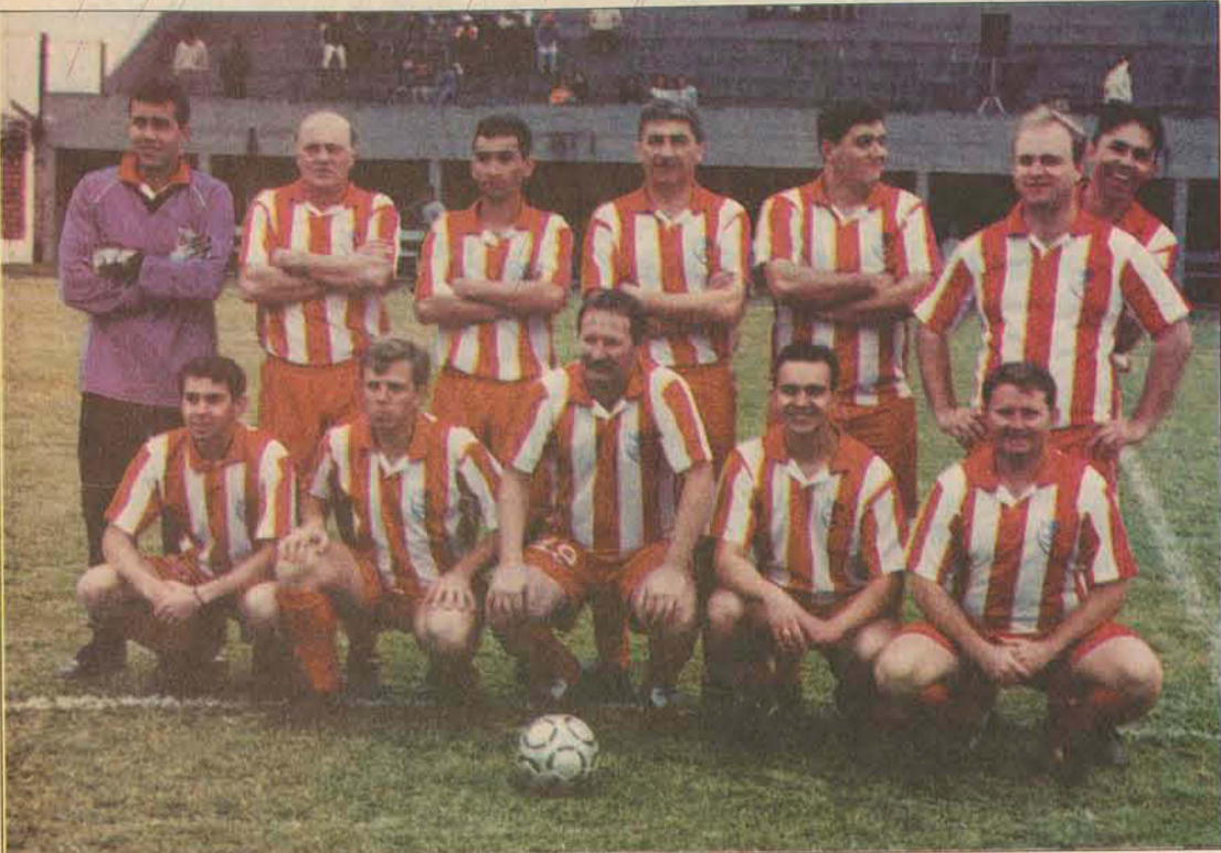
O time da imprensa local contou com alguns reforços de peso