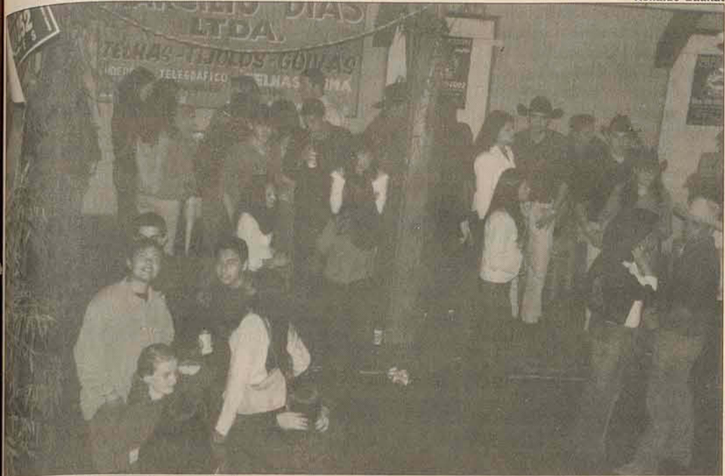
Um grande número de cowboys marcou presença