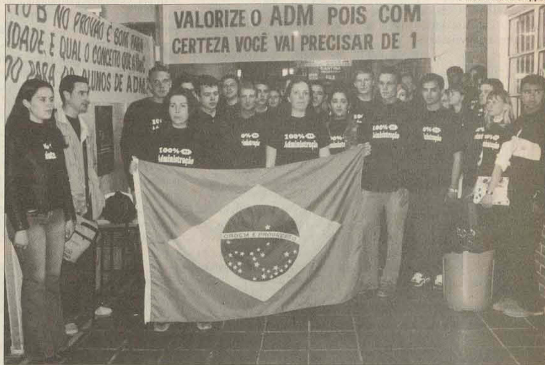
Futuros administradores vestiram a camiseta do curso e realizaram manifestação