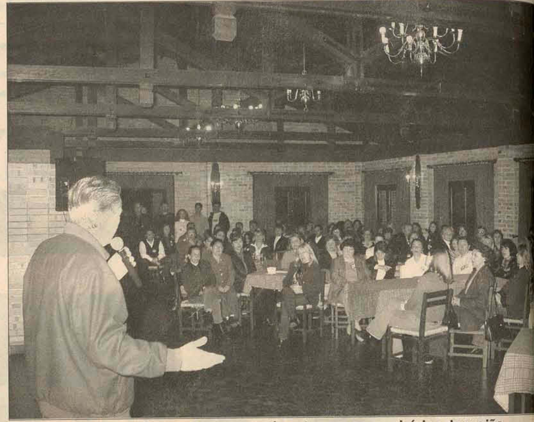
Na Arep, Voltolini reafirmou o comprometimento com os municípios da região