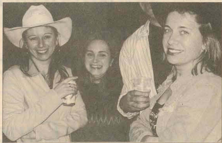
Pit-stop para abastecer

CIMENTELA Telas - Grades - Muros - Artefatos de Concreto FÁBRICA 624-1459 ESCRITÓRIO CIDE CONTABILIDADE Fone 622-1718 Rua Coronel Albuquerque, 1158