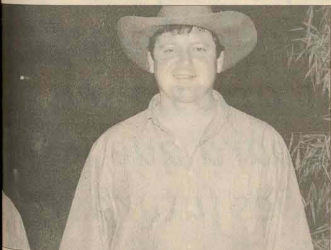
Os presentes não pouparam elogios.