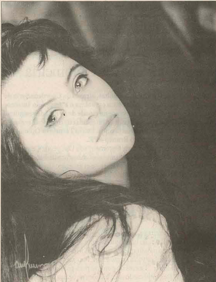
É uma das mais belas jovens senhoras de nossa sociedade, que completou idade nova nesse último dia 11. Parabéns a nossa futura mamãe.