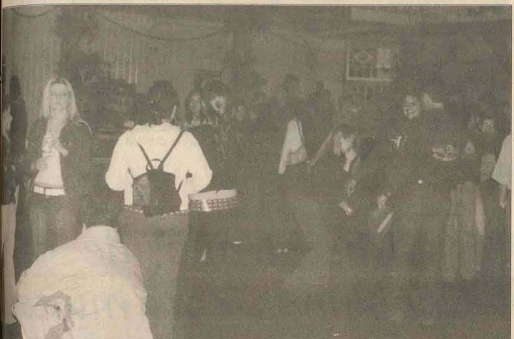
A decoração foi um espetáculo a parte