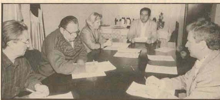
Os prefeitos assinaram a "Carta de Emergência", dirigida ao Presidente Fernando Henrique Cardoso.

Os nove prefeitos integrantes da Associação dos Municípios da Região do Contestado (Amurc), assinaram documento pedindo ao Governo Federal a criação de um Fundo de Emergência, que repasse recursos financeiros que compensem a queda de receita das prefeituras.