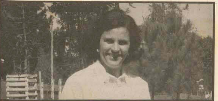
A ex-candidata ao governo do Estado Angela Amin é muito querida em nossa região, onde mantém a expressiva preferência do eleitorado. Tem sido uma presença constante e prometeu o seu empenho pessoal pelas causas do planalto norte.