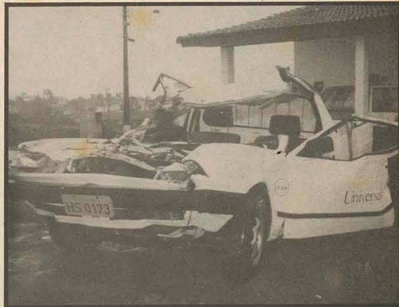
"O veículo saveiro ficou parcialmente destruído".