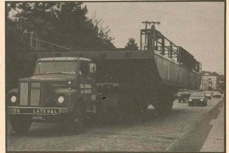
Momento em que chegava em nossa cidade, a nova Balsa que o governo Klempouz mandou contruir destinada à localidade de Paula Pereira.

A capacidade da mesma é de até 50 toneladas e vem resolver o antigo problema que afligia a região.