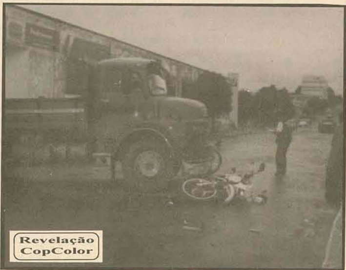
Caminhões envolvidos em acidentes. Detalhes pág. 04