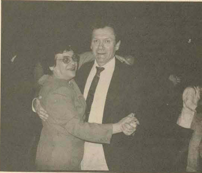
Ao som de uma valsa o casal sorri.