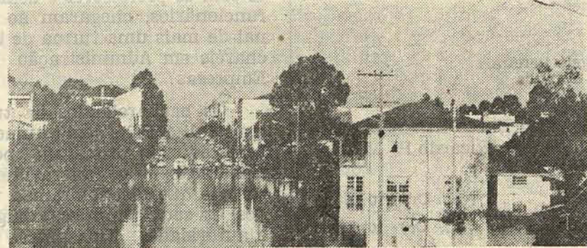
Na enchente de 83, às águas invadiram a cidade.

As chuvas que caíram na região do Planalto Norte e em todo o estado de Santa Catarina, voltaram a assustar a população de Canoinhas e municípios vizinhos, como Três Barras e Porto União. Entretanto, a enchente causada pelas últimas chuvas ficou longe de reproduzir a catástrofe do ano passado, quando somente em Canoinhas diversas centenas de pessoas ficaram