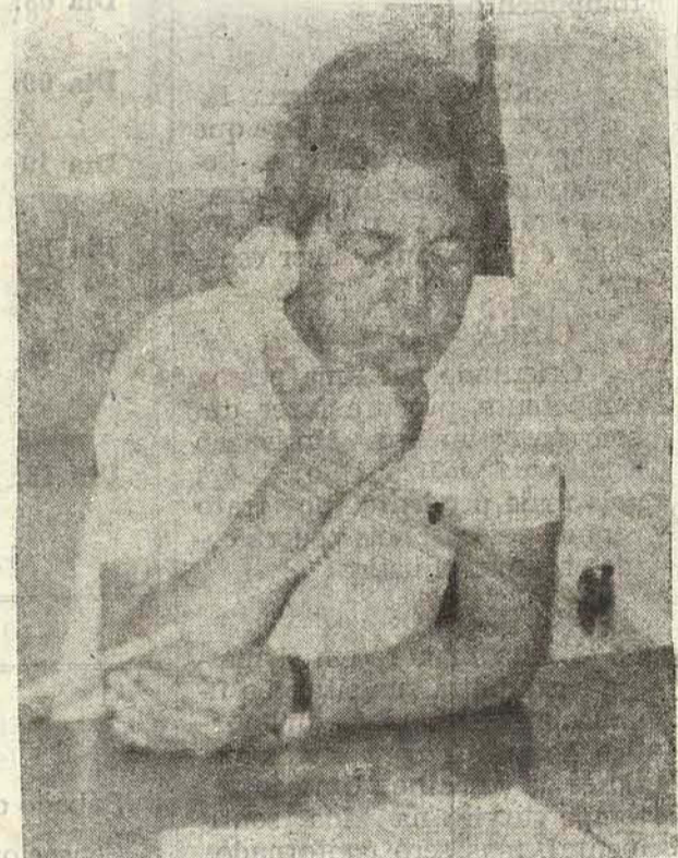
Kleinubing: apoio ao pequeno produtor rural

Entretanto, em razão dos fortes ventos que assolaram a região durante a quinta-feira, a viagem via aérea dos secretários foi desaconselhada e conclada.